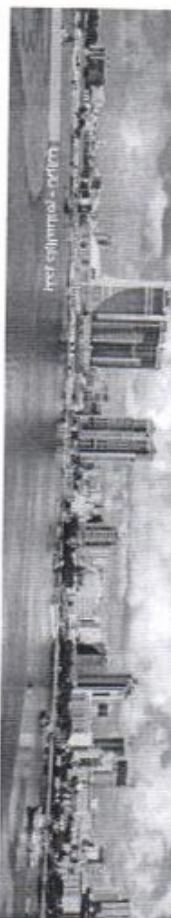
بازار مواصلاتی - تانزانیا

مشاوره و پیمان کاری راه های مواصلاتی شهری و بین شهری