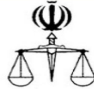
دیوان عدالت اداری

«فَلَا تَتَّبِعُوا الْهَوَىَٰ أَنْ تَعْبُدُوا»