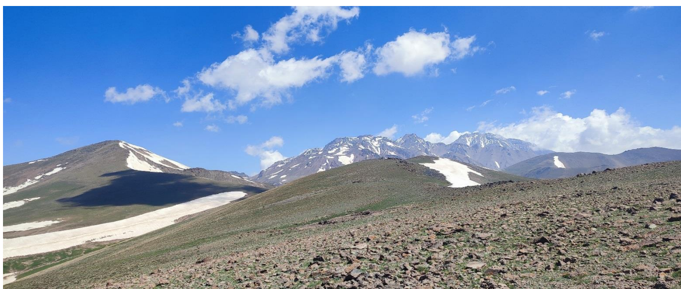
قلّه جنوار داغی با نمایی از قلال پنج گانه سبلان