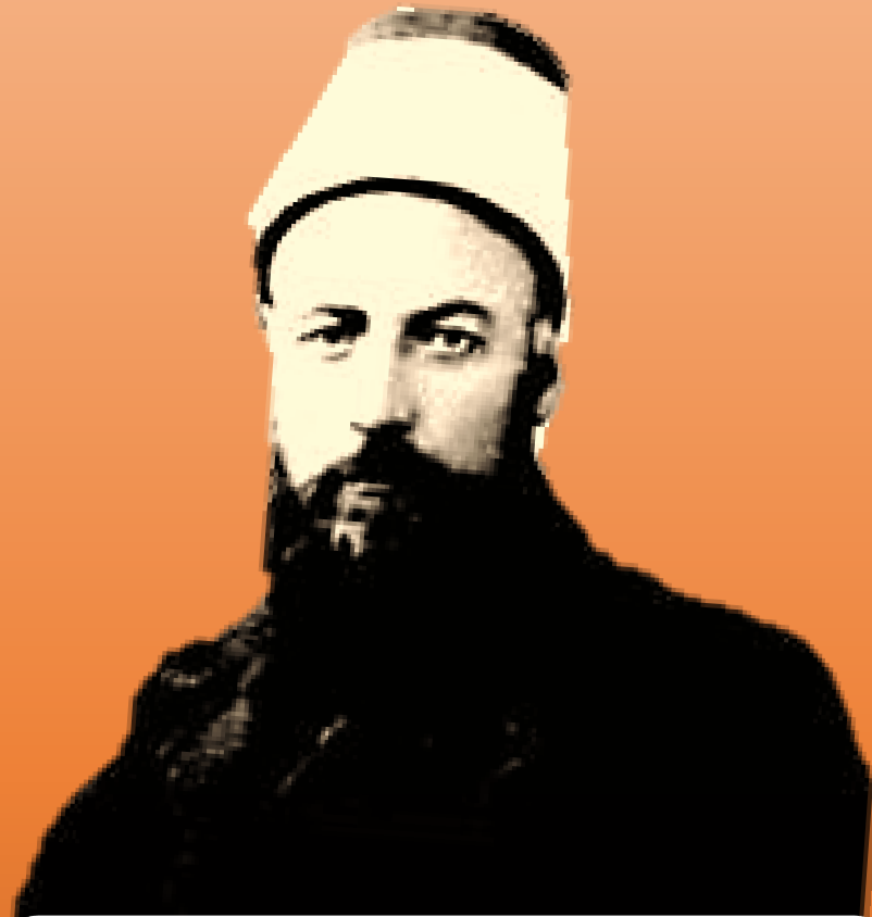
میرزا حسن رُشدیه