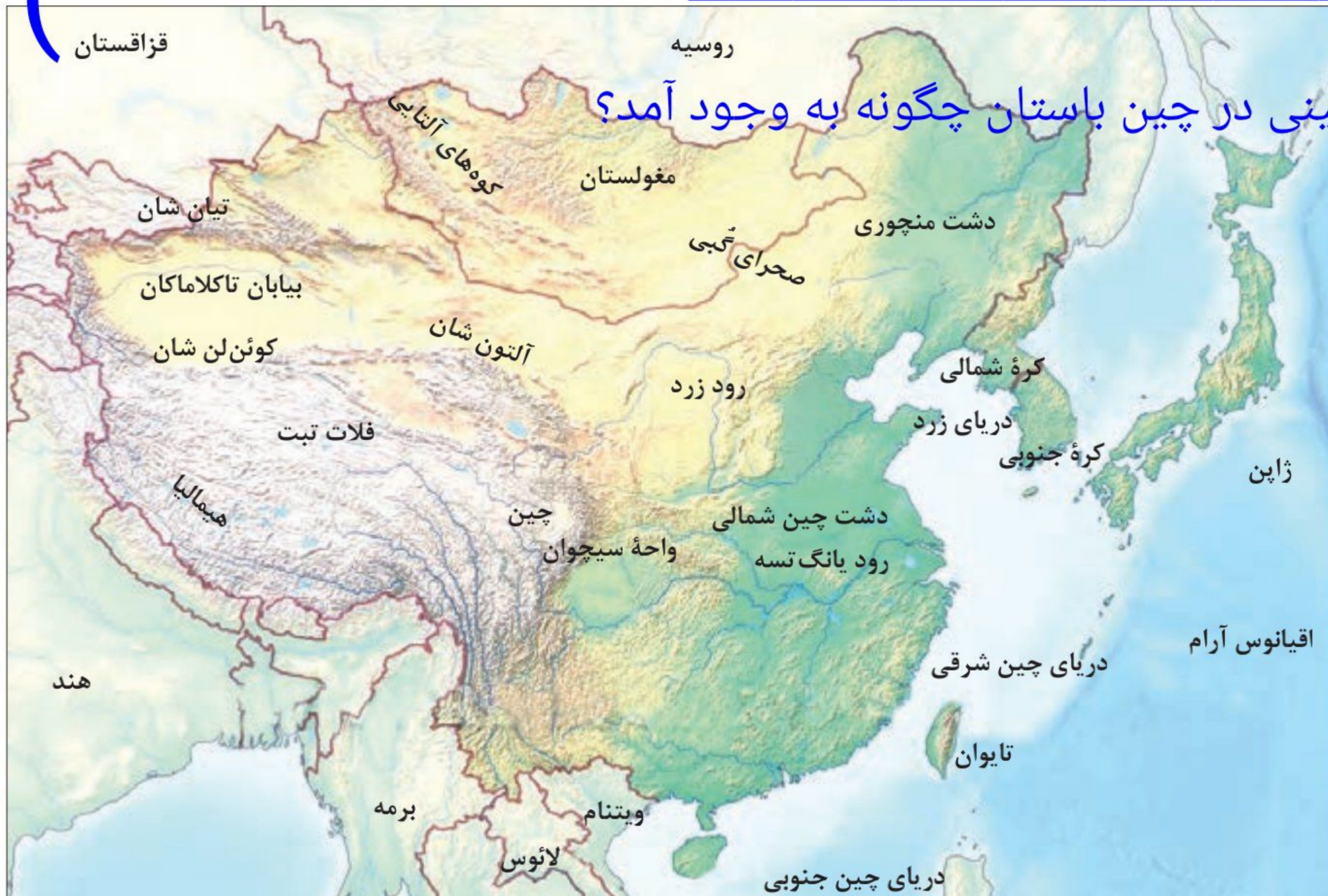
○ نقشه طبیعی چین