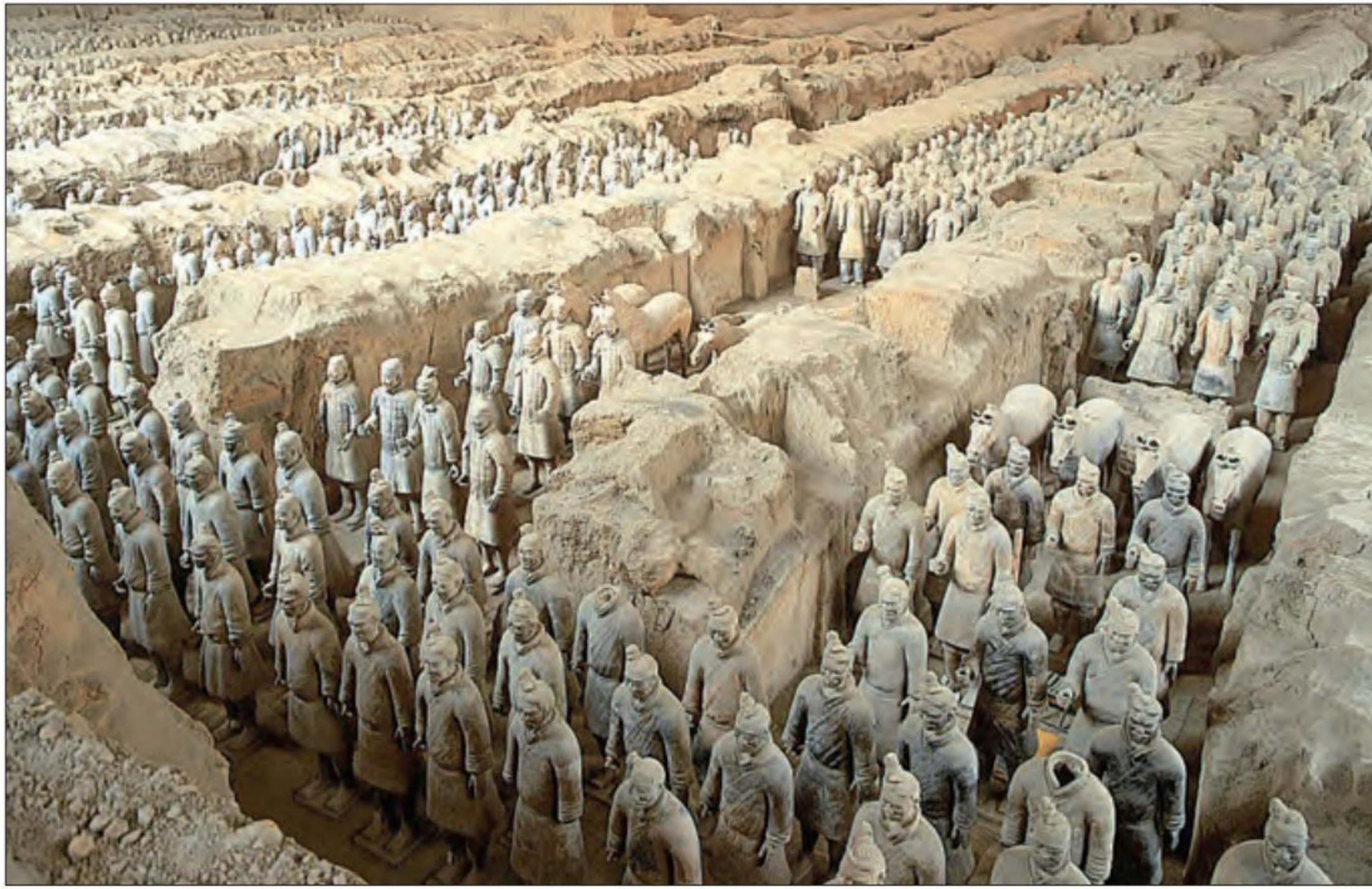
آرامگاه شی هوانگ تی؛ برای ساخت این آرامگاه، هنرمندان و کارگران زیادی به خدمت گرفته شدند.