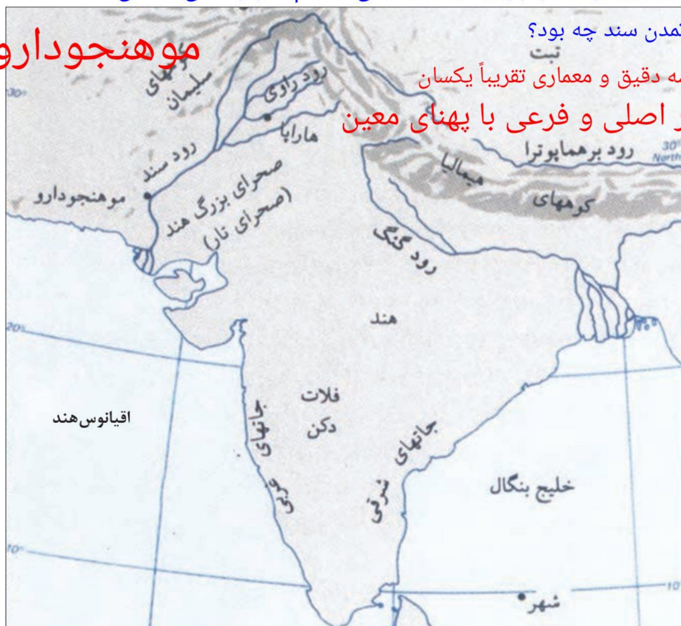
نقشه هند باستان