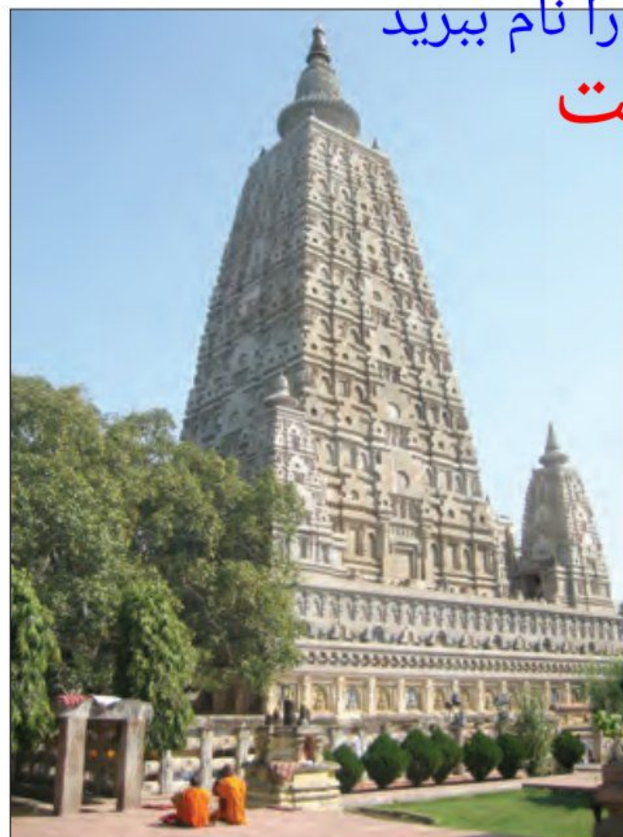
● معبد بودایی ماهابادی در استان بیهار هند، به اعتقاد بوداییان، بودا در همین مکان و در زیر درخت مقدس به روشنایی رسید.

در ایمان، نیت، گفتار، کردار، زندگانی، کوشش، پندار و مراقبه می شد.