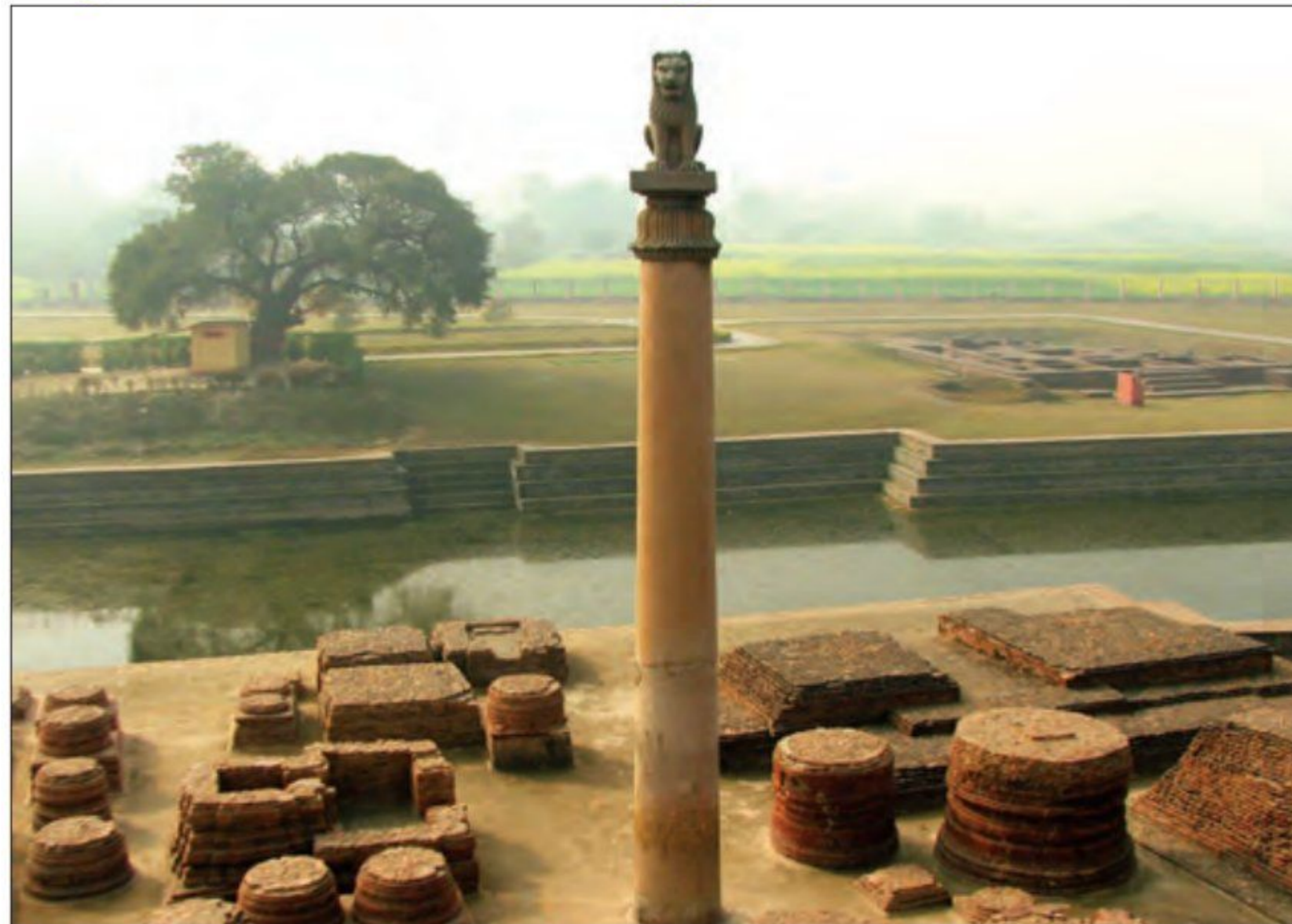
بقایای بنای متعلق به دوره اشوکا

سلسله های پادشاهی هند: قبایل آریایی مهاجر به هند، تا چندین قرن به صورت پراکنده می زیستند و حکومت فراگیری را تأسیس نکردند. داریوش بزرگ، پادشاه هخامنشی، قسمت هایی از شمال غرب هند را تصرف و آنجا را خراج گزار خویش کرد. اسکندر مقدونی نیز پس از آنکه حکومت هخامنشیان را برانداخت، بخش های وسیعی از هند را فتح کرد. (با انتشار خبر مرگ اسکندر، یکی از فرماندهان هندی به نام «چندرا گوپتا ۱ » بر ضد یونانیان سر به شورش برداشت. او با به اطاعت درآوردن شماری از حاکمان محلی شمال هند، سلسله موریای ۲ را بنیان گذاشت. حکومت موریای در دوران فرمانروایی اشوکا ۳ به اوج قدرت رسید و قلمرو خود را به سراسر هند، به جز قسمت های جنوبی آن، گسترش داد.) 2 3 (حکومت موریای پس از اشوکا ضعیف شد و کم کم سلسله دیگری به نام گوپتا بر سر کار آمد و چندین قرن بر هند فرمان راند.) 3