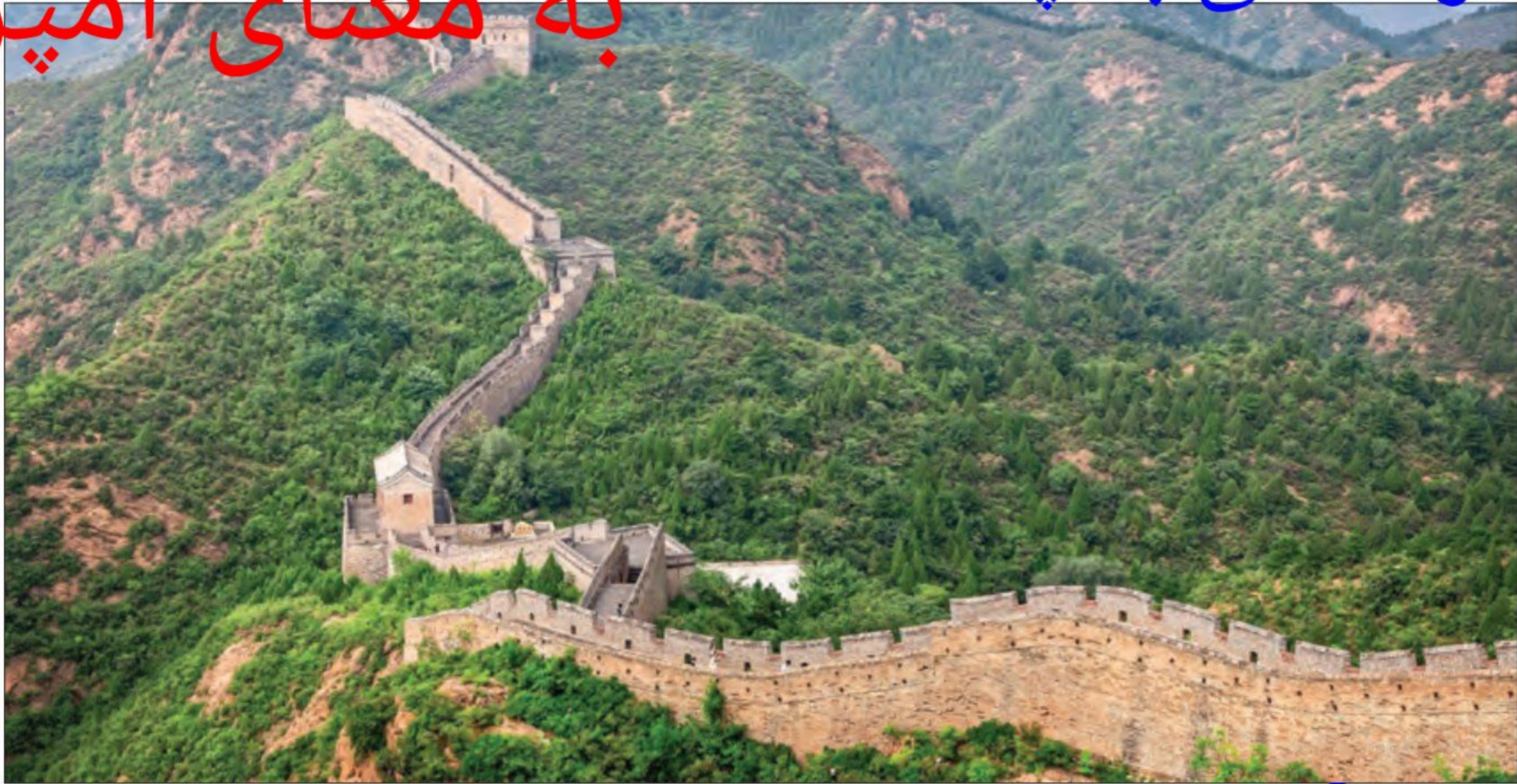
2 دیوار چین

رونق تجارت، مقیاس وزن‌ها و اندازه‌ها و عیار سکه‌ها را یکسان کرد.