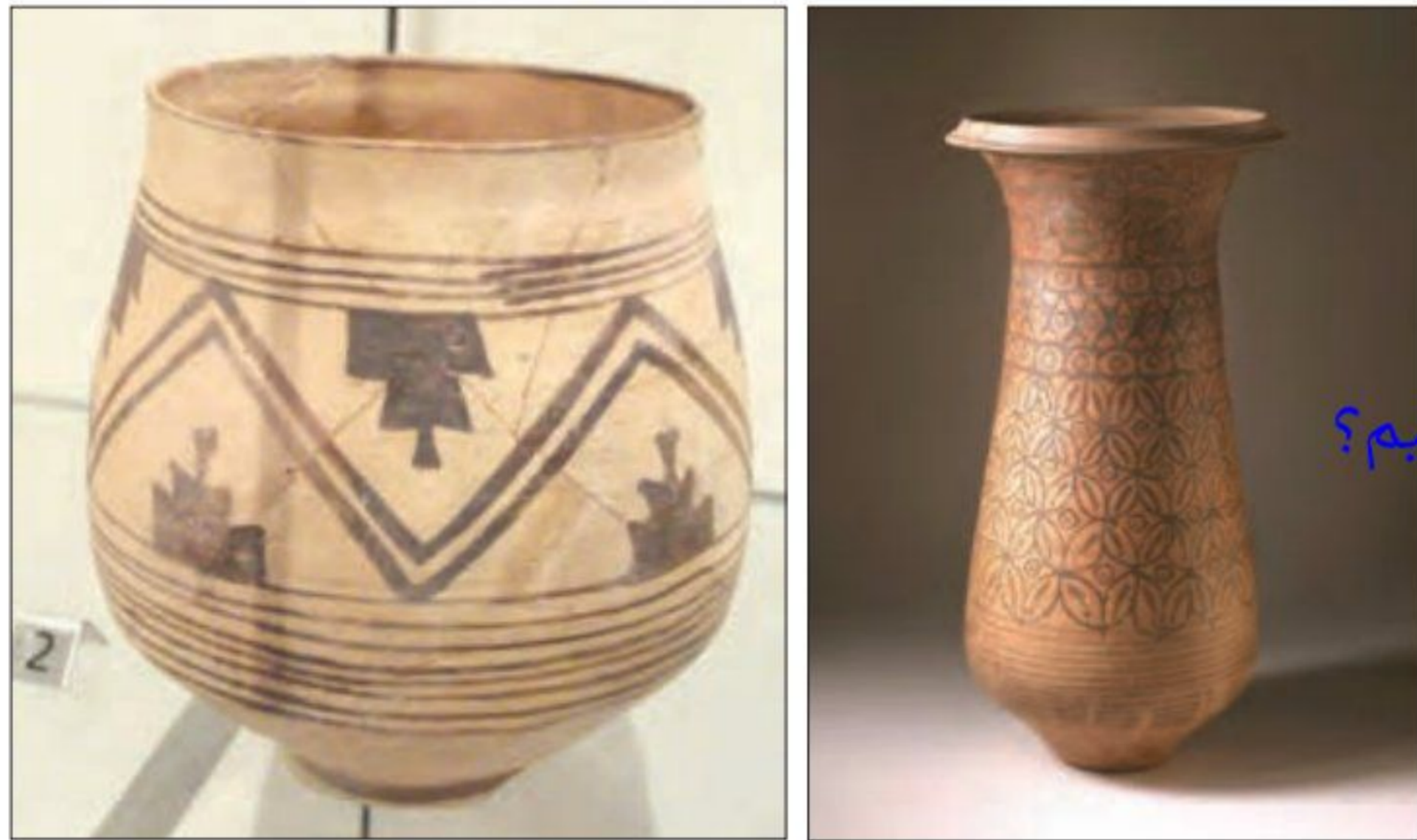
نمونه هایی از ظروف سفالی تمدن سند

2. وضعیت صنعت و تجارت در تمدن مصر چگونه بود؟