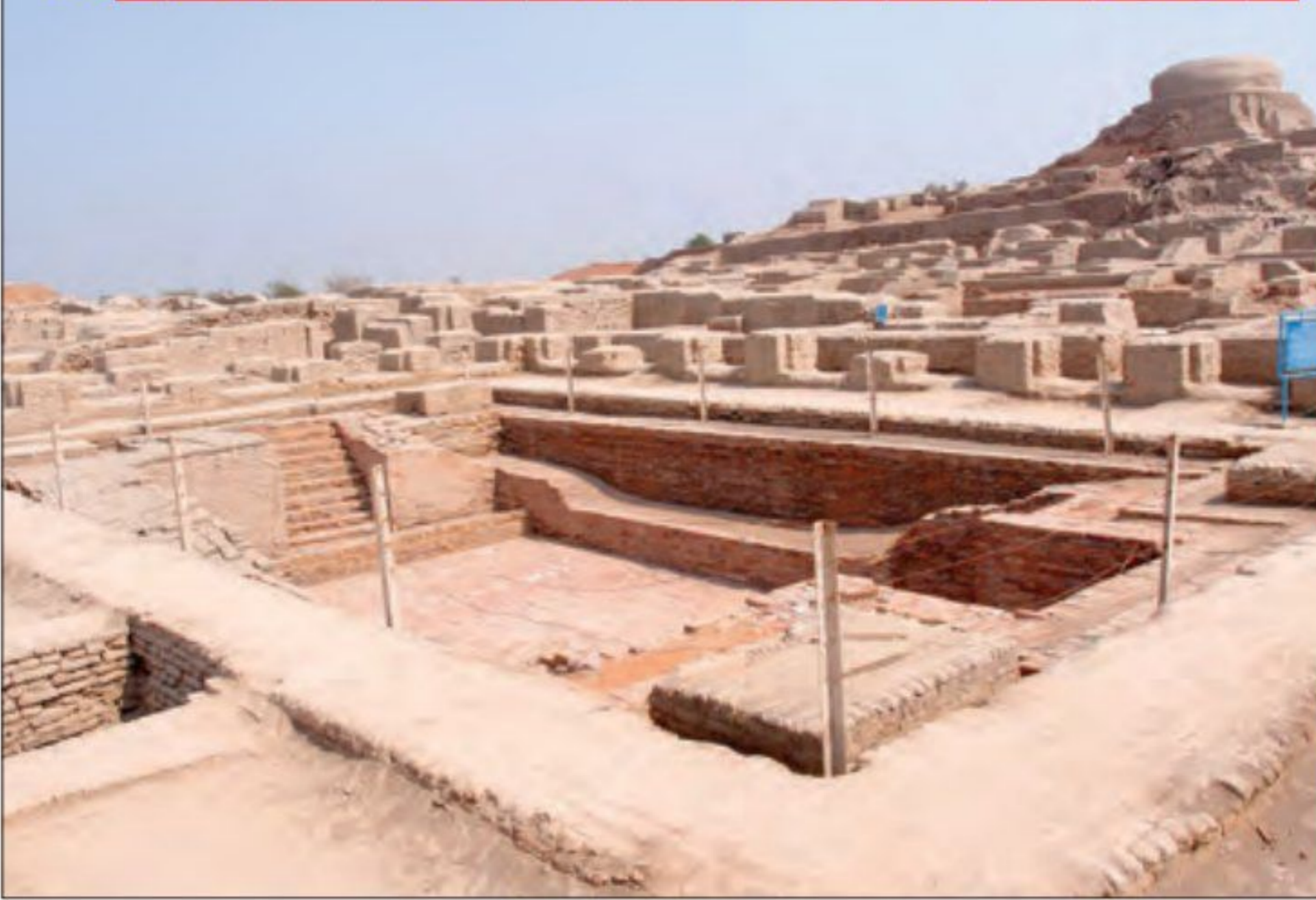
بقایای شهر موهنجودارو

جو و پنبه و پرورش دام به ویژه گاو می پرداختند