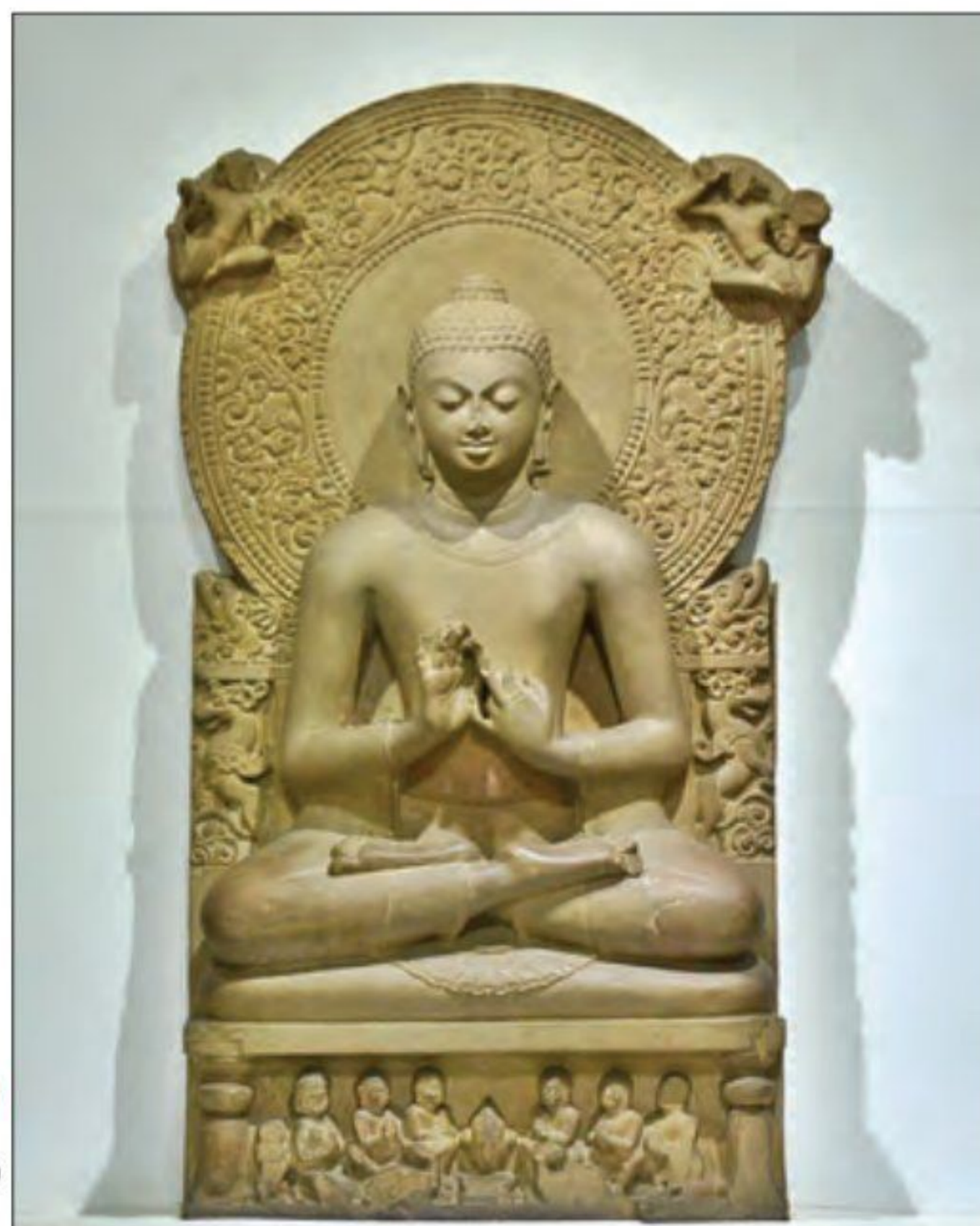
● پیکره بودا در سارنات هند