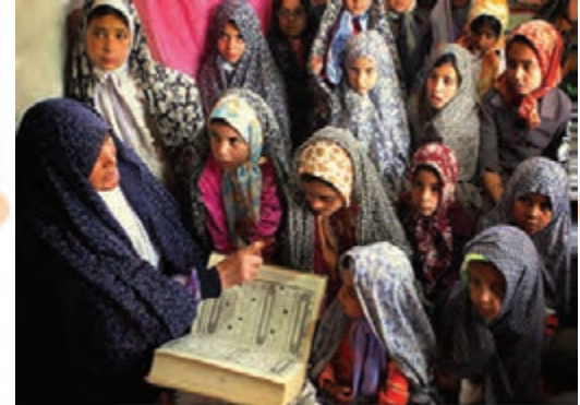
انس با قرآن کریم در روستای کرغند خراسان جنوبی