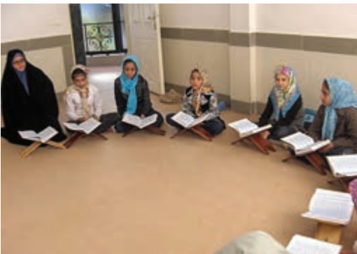
انس با قرآن کریم در یک «مدرسه‌ی قرآن»