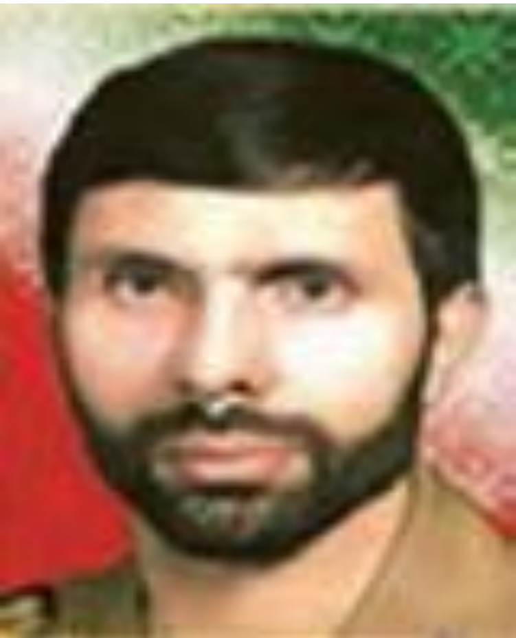
شهید سپهبد علی صیاد شیرازی