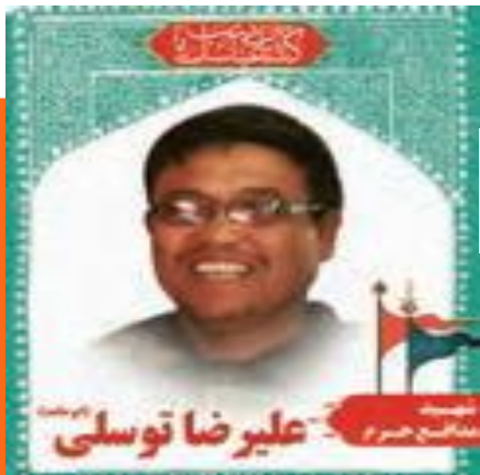
شهدید علیرضا توسلی ابوحامد) از تپ فاطمیون افغانستان