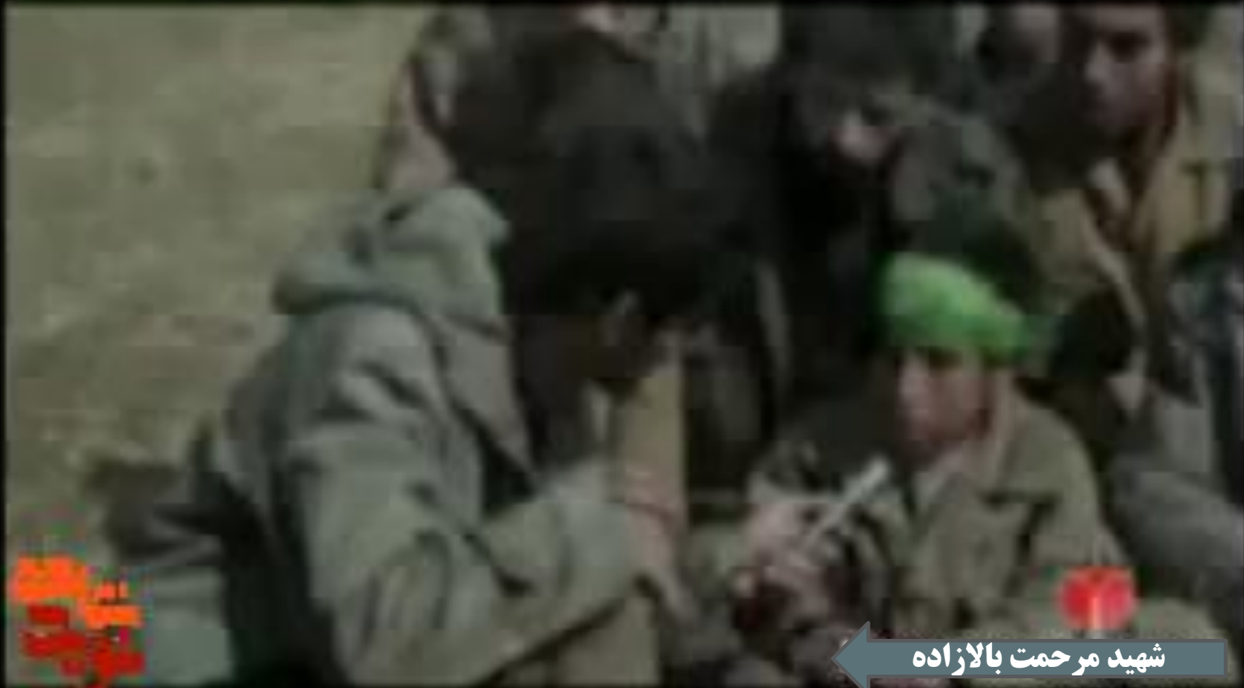
شہید مرحمت بالازادہ