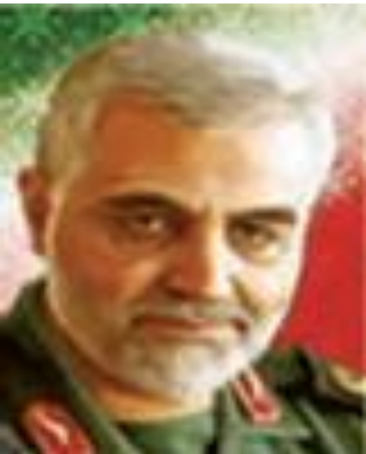
شهید سپهبد حاج قاسم سلیمانی