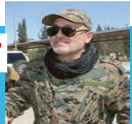
شهدید مصطفی بدرالدین از حزب الله لبنان