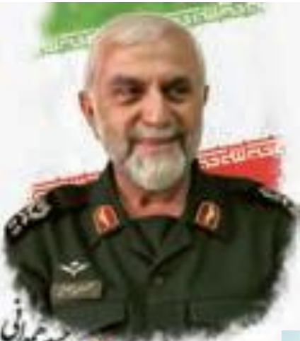
شهدید حاج حسین همدانی مستشار ارشد سپاه پاسداران انقلاب اسلامی