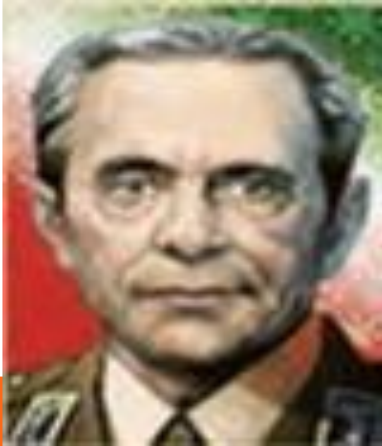
شهید سپهبد محمدولی قرنی

شهید قرنی شخصیتی بود که نه تنها در تثبیت موقعیت ارتش در نظام اسلامی نقش کلیدی داشت بلکه در مقابل طرح هایی که در جهت انحلال یا فروپاشی ارتش مطرح می شد با شهامت ایستادگی کرد. سرانجام در سوم اردیبهشت ماه سال ۱۳۵۸ ساعت ۱۱ صبح توسط عوامل گروهک فرقان در مقابل خانه اش به شهادت رسید.