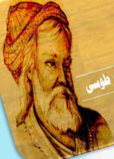
خواجه نظام الملک طوسی