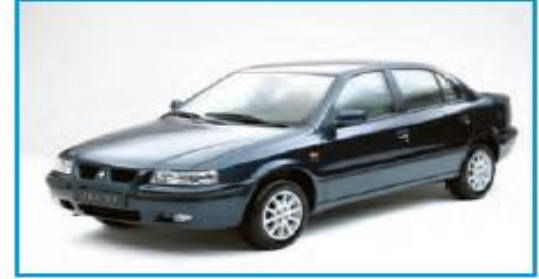
۱۵۰ میلیون تومان