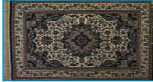
۵ میلیون تومان