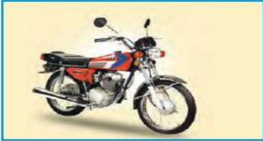
۱۰ میلیون تومان