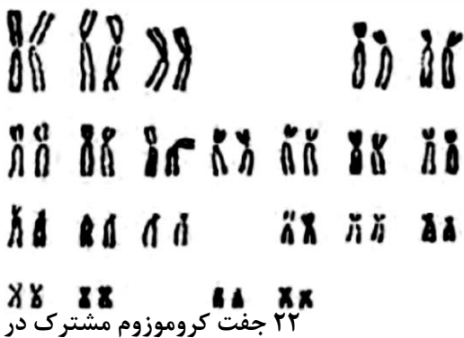
۲۲ جفت کروموزوم مشترک در