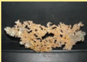
ت) مس خالص (معدن مس سرچشمه کرمان)

گروهی دیگر از کانی ها به عنوان ماده ارزشمند معدنی از زمین استخراج می شوند (شکل ۱ - پ و ت).