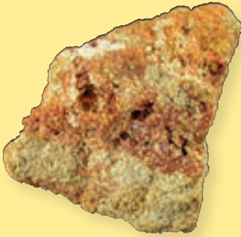
ب) کانی خادمیت

و رئیس وقت سازمان زمین‌شناسی کشور نام‌گذاری شد (شکل ۶-ب).