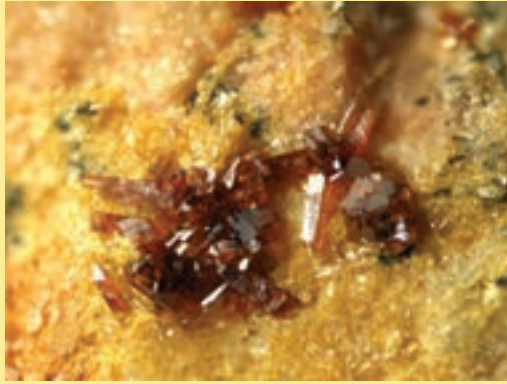
شکل ۶- کانی‌های ملی: الف) کانی ایرانیت