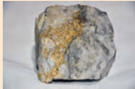
جواهر سازی و صنایع الکترونیک