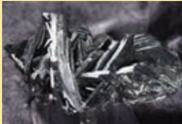
پ) هماتیت (سنگ معدن آهن)