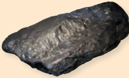
نوشتن و کاهنده ی اصطکاک

در شکل زیر دو کانی را مشاهده می کنید. درباره کاربرد هر یک از این کانی ها در زندگی گفت و گو کنید.