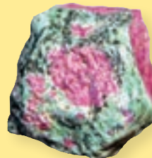
ب) کانی یاقوت