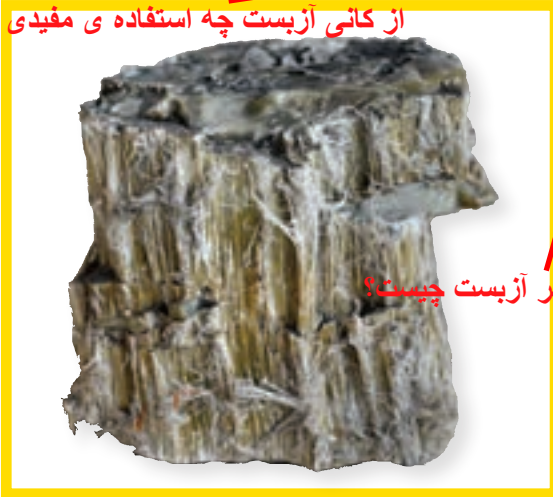
خطر آزبست چیست؟