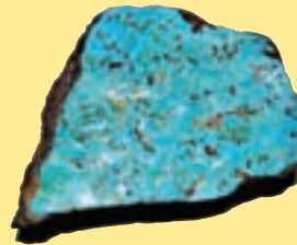
شکل ۱ الف) کانی فیروزه