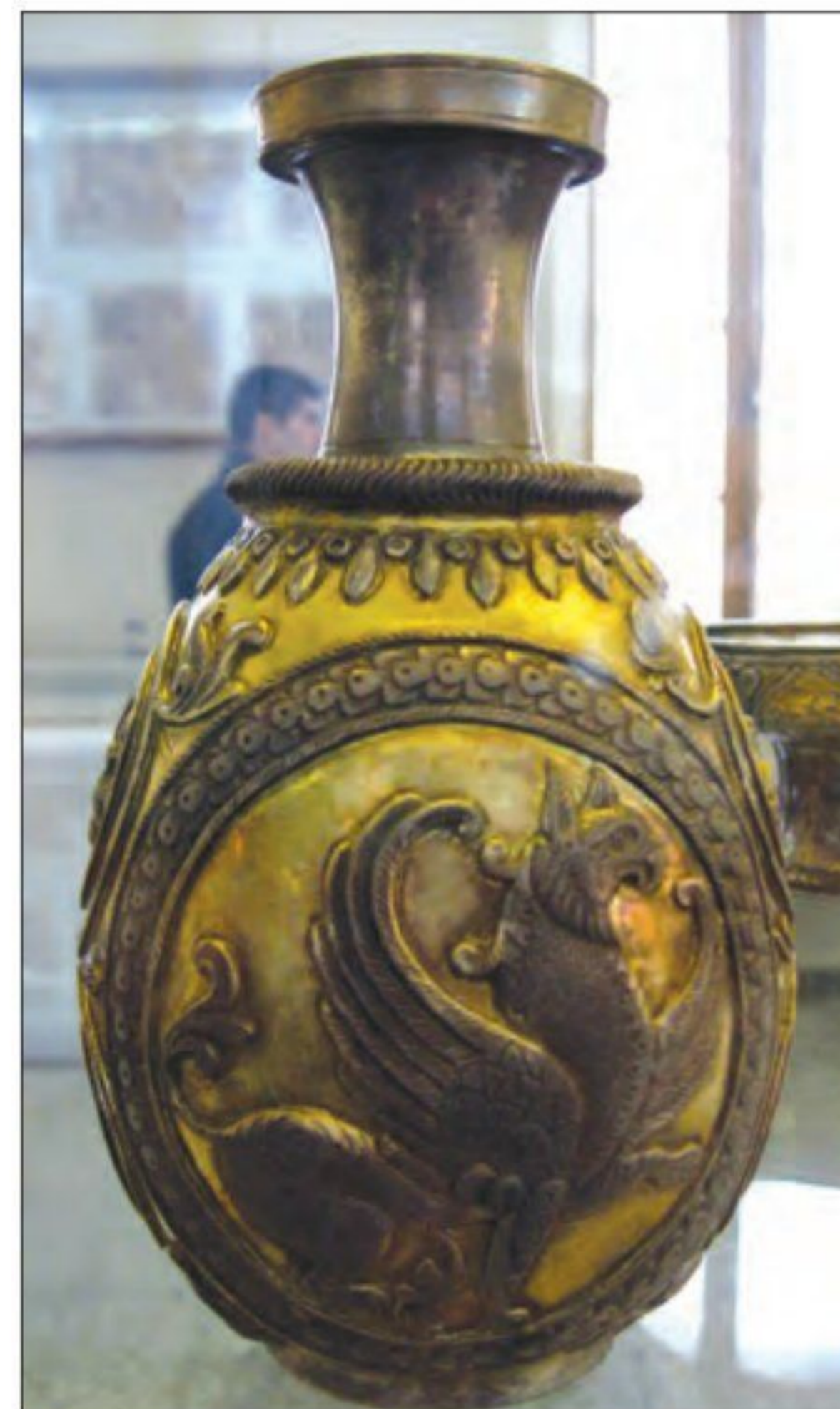
○ ظروف فلزی دوره ساسانی