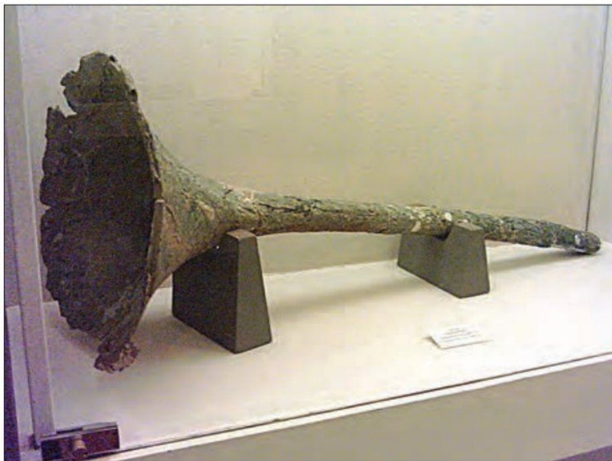
○ کرنا، یکی از سازهای موسیقی به جا مانده از دوره باستان

موسیقی 1: دوره ساسانی یکی از دوران‌های درخشان موسیقی ایران است. هنرمندان عرصه موسیقی در دوره ساسانی، بیش از پیش مورد توجه شاهان قرار گرفتند و از منزلت و امتیازات ویژه برخوردار شدند. از خوانندگان و نوازندگان آن دوره با عنوان گوسان، خنیاگر و رامشگر یاد شده است. 1