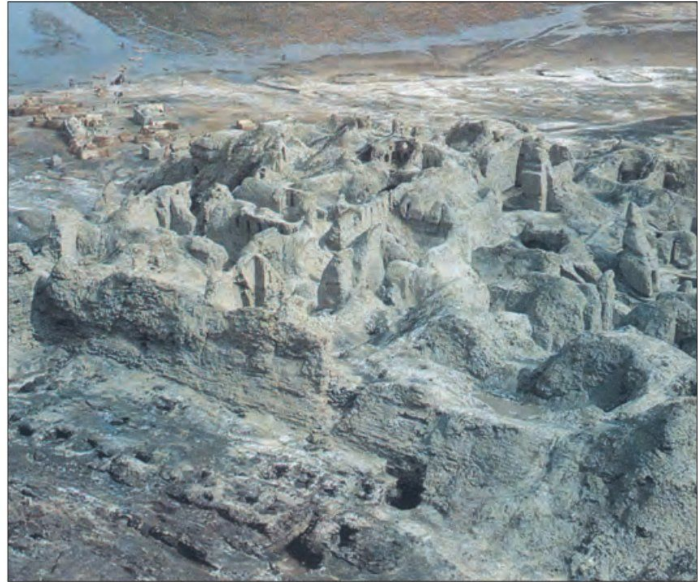
بقایای بناهای کوه خواجه و نقاشی دیواری آن - سیستان - دوره اشکانی