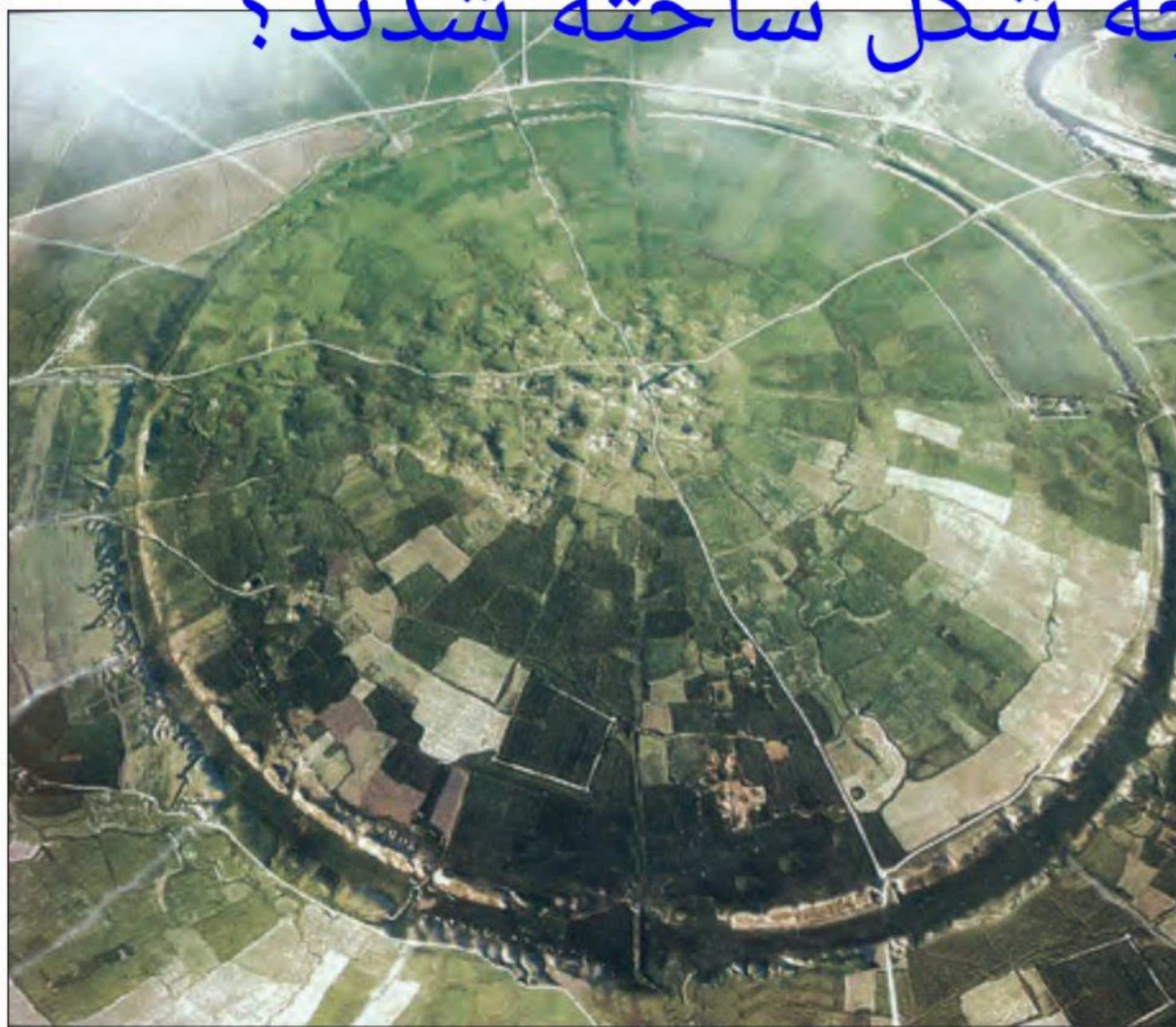
عکس هوایی از بقایای شهر فیروزآباد (گور)