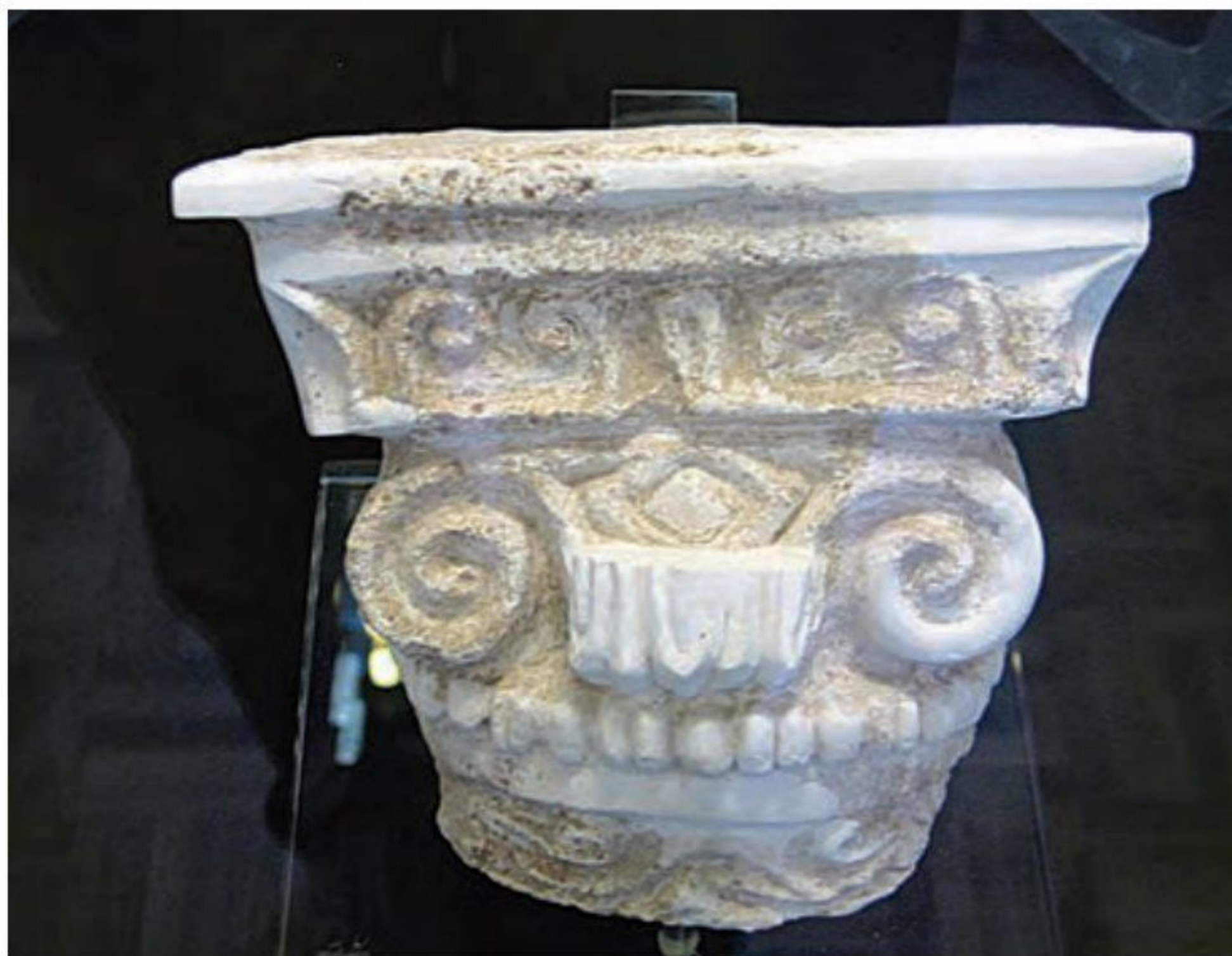
تزیینات معماری - دوره اشکانی

دوران اشکانیان به شمار می روند. در این دوره، سفالها نقش و طرح متنوع و گوناگون نداشتند، اما دارای لعابی، اغلب سبز رنگ بودند.