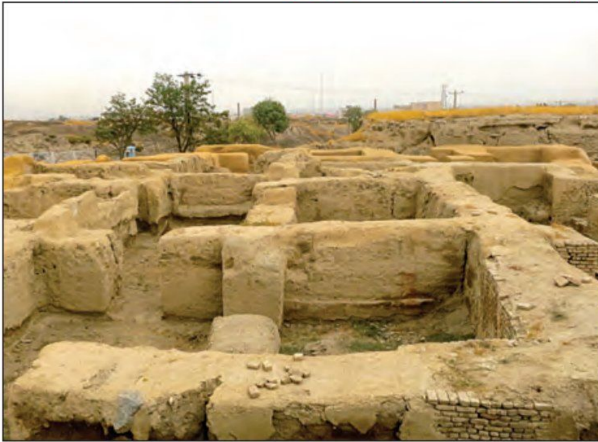
محوطه باستانی هگمتانه (همدان)

به دست آمده، امروزه زینت بخش موزه‌های ایران و جهان‌اند. یکی از ویژگی‌های مهم هنر و معماری هخامنشی، تأثیرپذیری از دستاوردهای هنری اقوام و ملت‌های تابع آن حکومت بود که پیشینه تمدنی درخشانی داشتند. پادشاهان هخامنشی به طور گسترده از مهارت و استادی هنرمندان و معماران سرزمین‌های قلمرو تحت فرمان خود استفاده می‌کردند. در این دوره، تجربه و سبک‌های هنری اقوام غیرایرانی با شیوه‌های بومی ترکیب شد و هنری به وجود آمد که کاملاً تازگی داشت و روح هنر ایرانی بر آن حاکم بود.