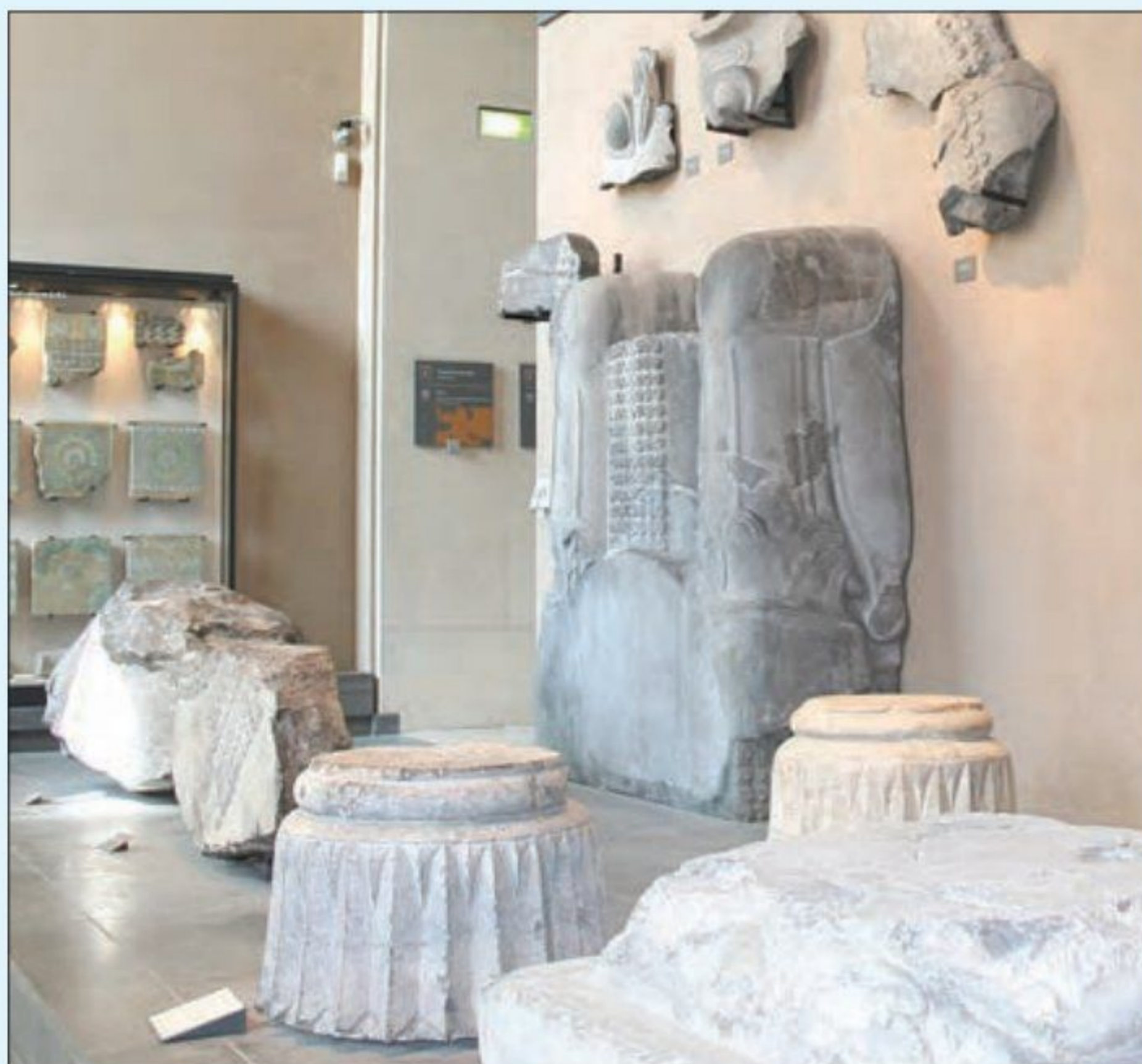
قسمت‌های باقی مانده از کاخ آپادانا - موزه لوور - پاریس