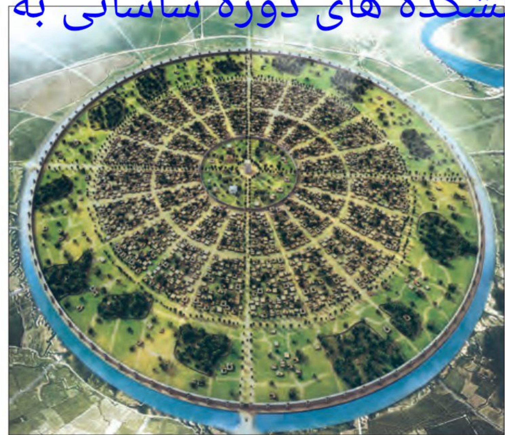
نمونه بازسازی شده تصویر سمت چپ