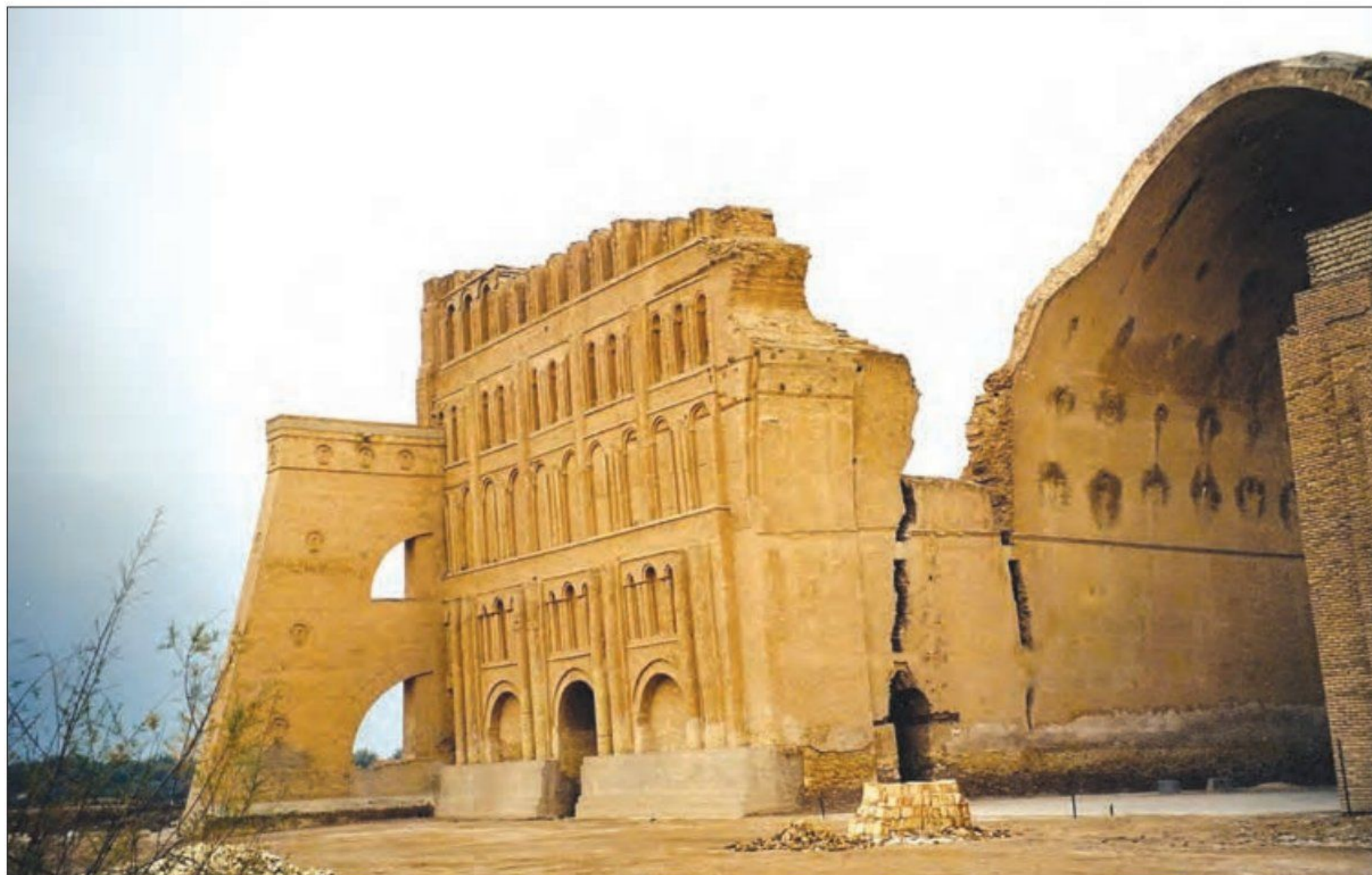
○ بقایای طاق کسری (کاخ تیسفون)

حکومت ساسانی نیز همچون حکومت‌های پیشین و بلکه بیشتر از آنها، به هنر و هنرمندان اهمیت می‌داد. 1 بر اثر توجه حکومت ساسانی به هنر و پشتیبانی آنان از هنرمندان، هنری پدید آمد که به لحاظ عظمت و شکوه، با هنر روم