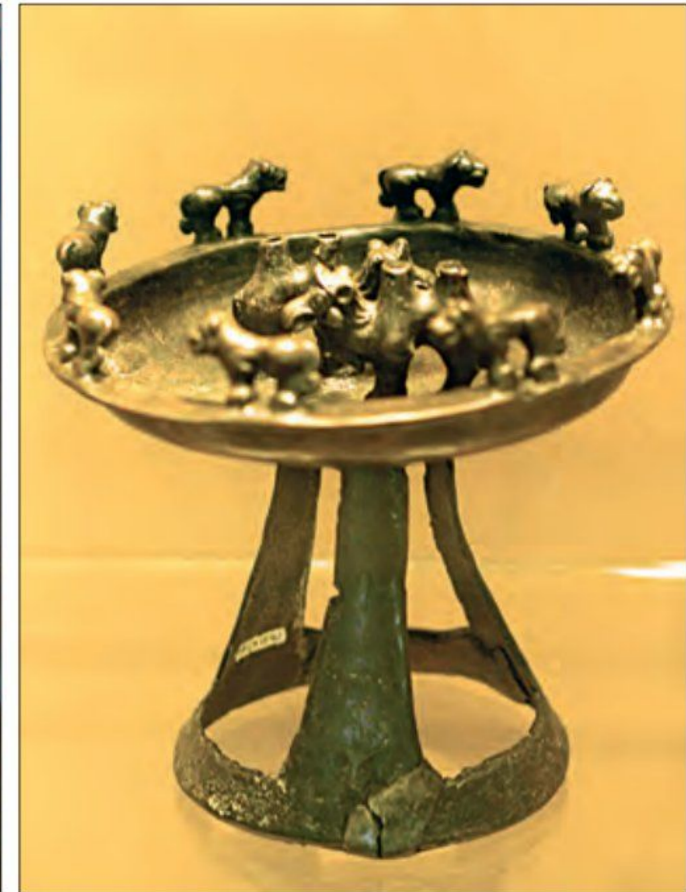
○ ظروف فلزی و سفالی دوره اشکانیان

برابری می‌کرد و گاه بر آن برتری داشت. 1 هنر ساسانی ریشه در هنرهای کهن ایران و نیز هنر دوران هخامنشی و اشکانی داشت و حتی از هنر یونانی و رومی نیز تأثیر پذیرفته بود. پس از سقوط ساسانیان و ورود اسلام به ایران، هنر اسلامی، 2 تأثیر بسزایی از هنر ساسانی پذیرفت.