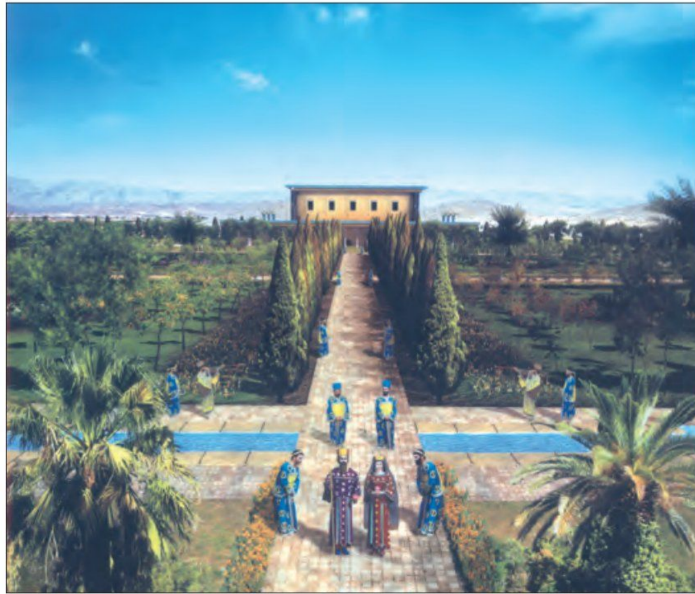
طرحی از کاخ کورش - پاسارگاد