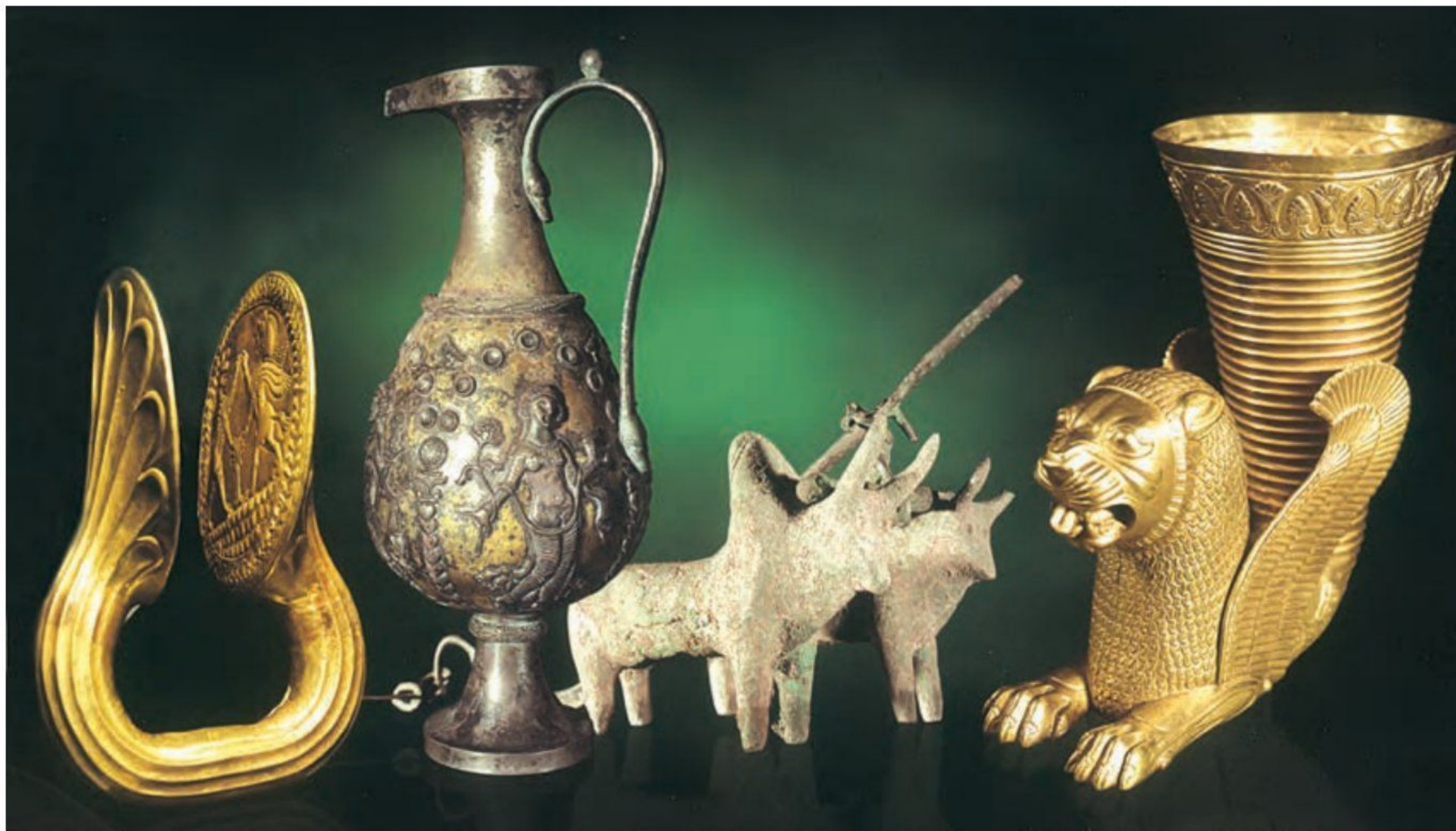
مجموعه‌ای از آثار هنری ایران از دوره ایلام تا ساسانی

فلزکاری و جواهرسازی: ظریف‌ترین آثار هنری دوران