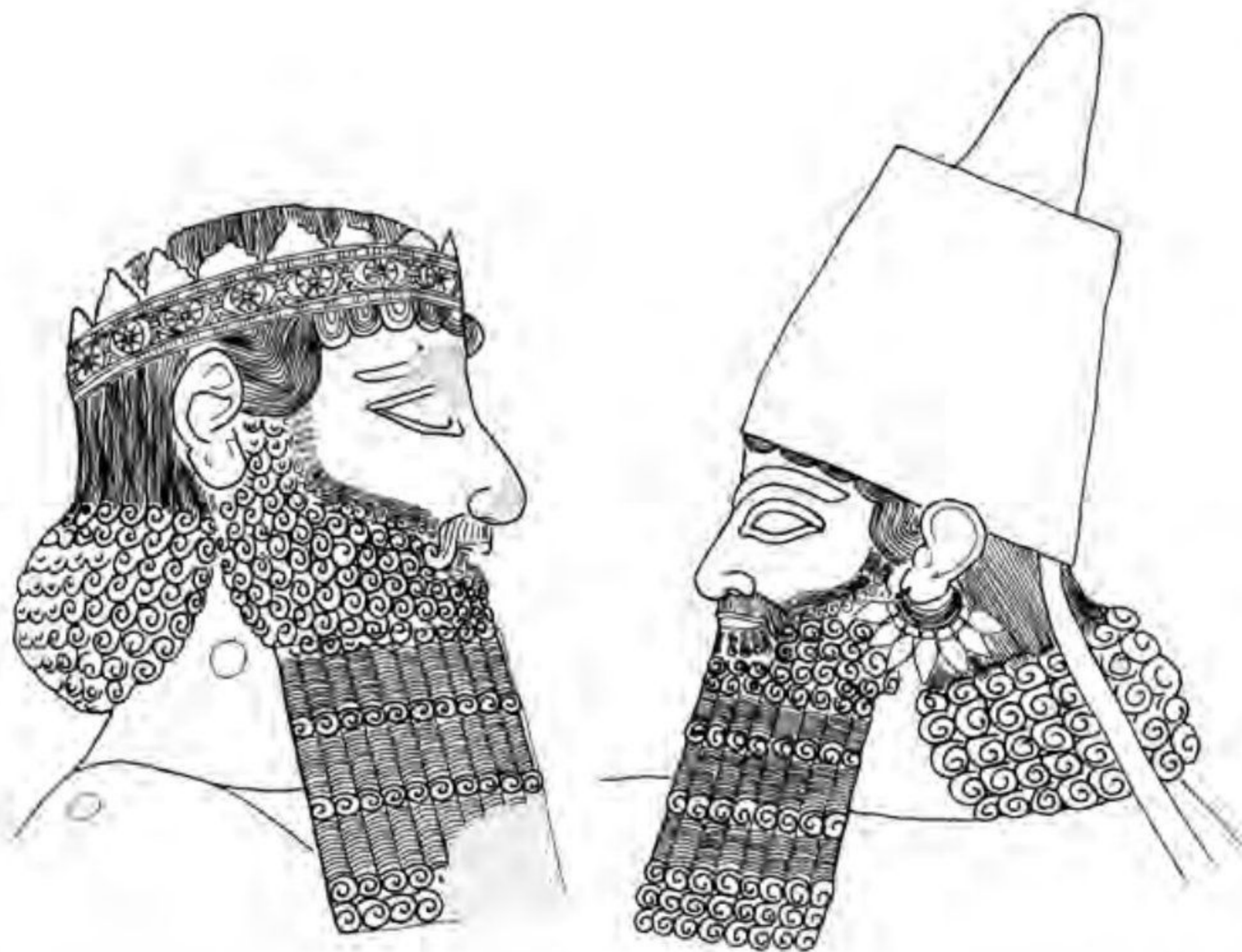
● سمت راست: سردیس آشوربانیپال ترسیم شده براساس نقش برجسته کاخ نینوا و سمت چپ: - سردیس داریوش یکم ترسیم شده براساس نقش برجسته‌های بیستون و تخت جمشید.

سنگ نگاره‌ها: تصمیم بر ایجاد بناها و به عبارت دیگر، ثبت رویدادها و اقدام‌های شاهان به وسیله کنده‌کاری نقش‌ها بر دیوارهای سنگی یا صخره‌های کوهستانی، در کشور ما پیشینه‌ای کهن دارد. از دوران هخامنشیان نقش برجسته‌های سنگی فراوانی باقی مانده که به وضوح، مهارت، ذوق و ظرافت هنرمندان سنگ تراش آن زمان را نشان می‌دهد. برخی از این نقش برجسته‌ها بر سینه صخره‌ای کوه‌ها و بسیاری دیگر از آنها بر روی دیوار بناهای حکومتی به‌ویژه کاخ‌ها و