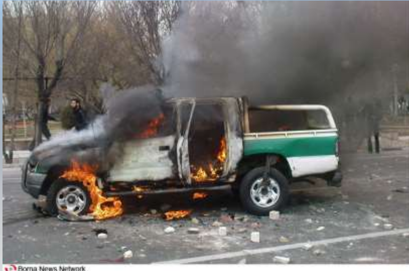
Borna News Network