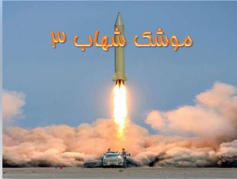
موشک شهاب ۳