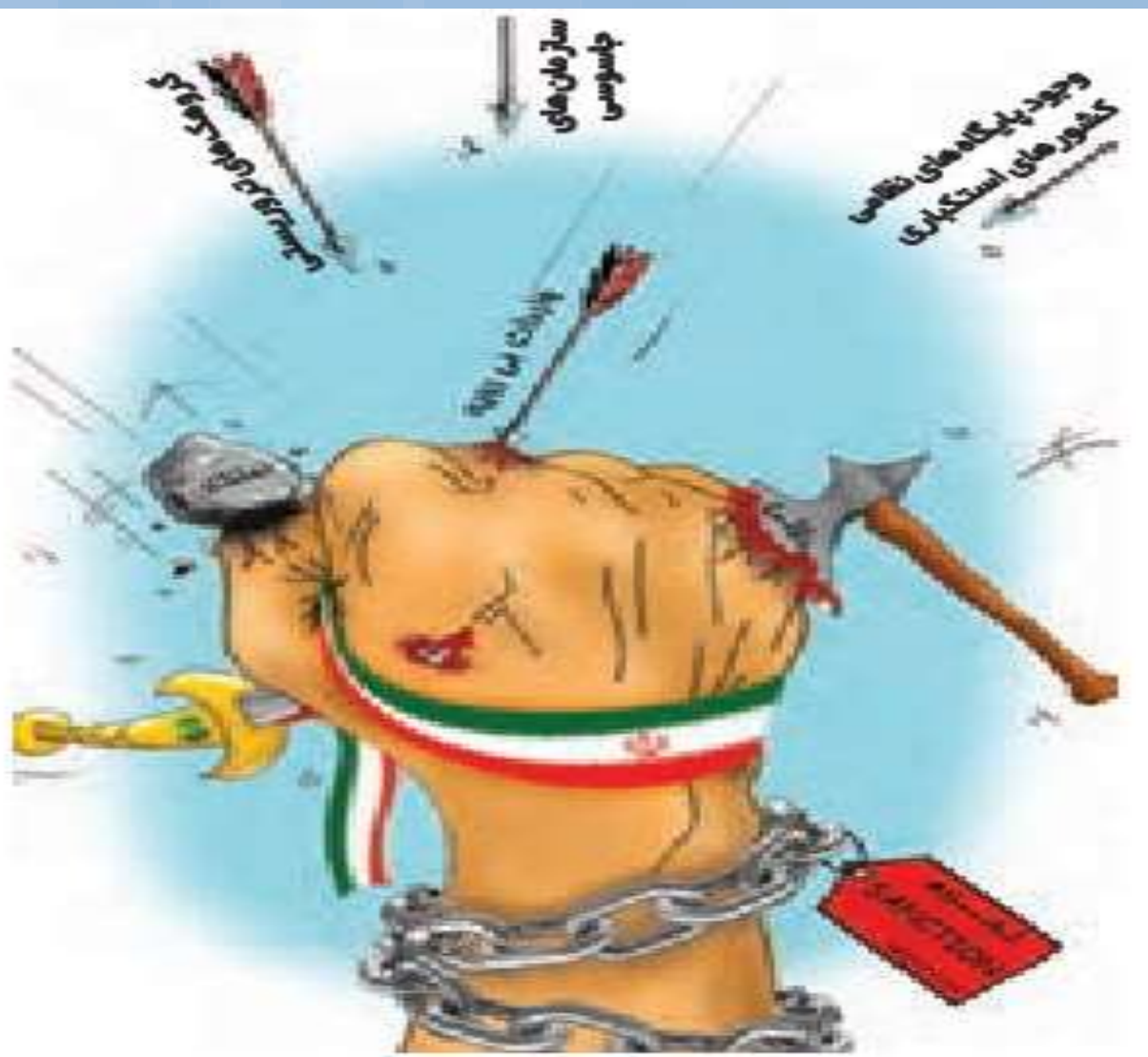
مقاومت ملت قهرمان ایران در برابر تهدیدات داخلی و خارجی