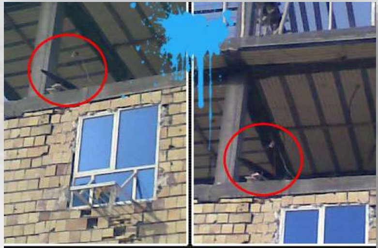
هنوز خونه آماده نشده ماهواره آمادهست عکاس: مهدسگرافیک مکان: بندر عباس WWW.BIA2BND.COM