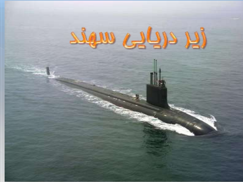
زیر دریایی سهند