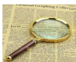
شیشه در عدسی