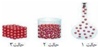
حالت ۱ حالت ۲ حالت ۳

۸- کدام ماده را می توان به مقدار زیاد متراکم کرد؟ دلیل را شرح دهید.