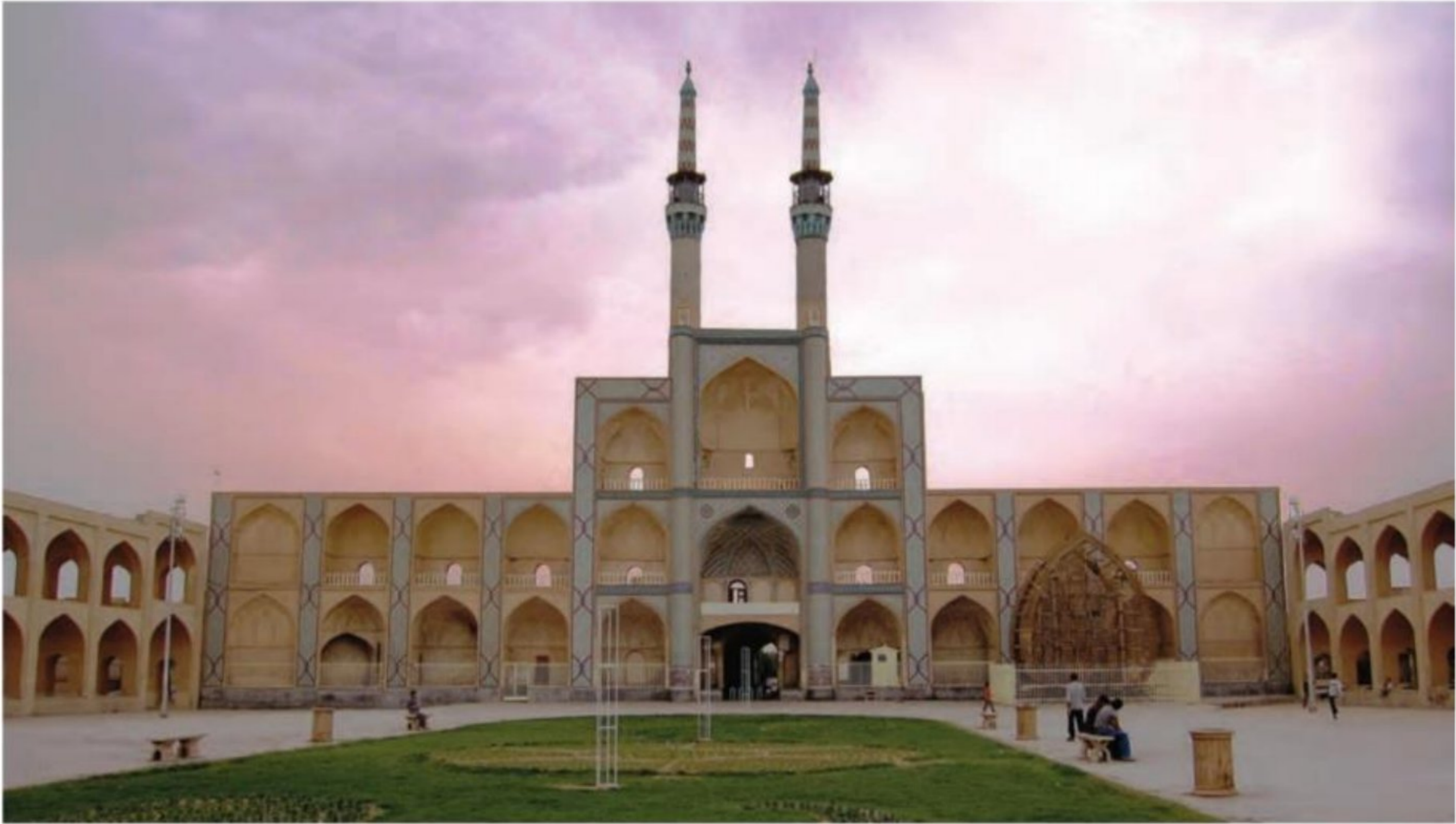
مجموعه تاریخی امیرچخماق - یزد

جانشینان تیمور سیاست جنگ و کشورگشایی او را کنار گذاشتند و به عمران و آبادی، علم، فرهنگ و هنر علاقه و توجه زیادی نشان دادند. به همین دلیل در دوره آنان شهر و شهرسازی شکوفا شد و شهرهای هرات، شیراز، مشهد و یزد رشد و رونق چشمگیری یافتند.