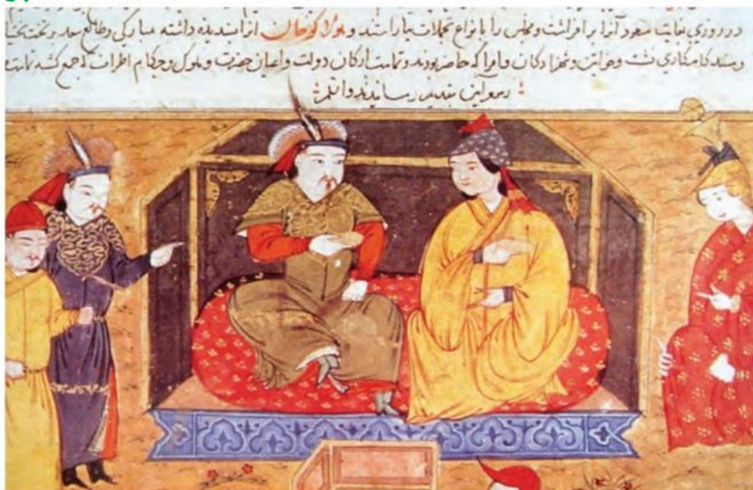
هولاکو خان و همسرش دوقوزخاتون - صفحه‌ای از کتاب جامع التواریخ