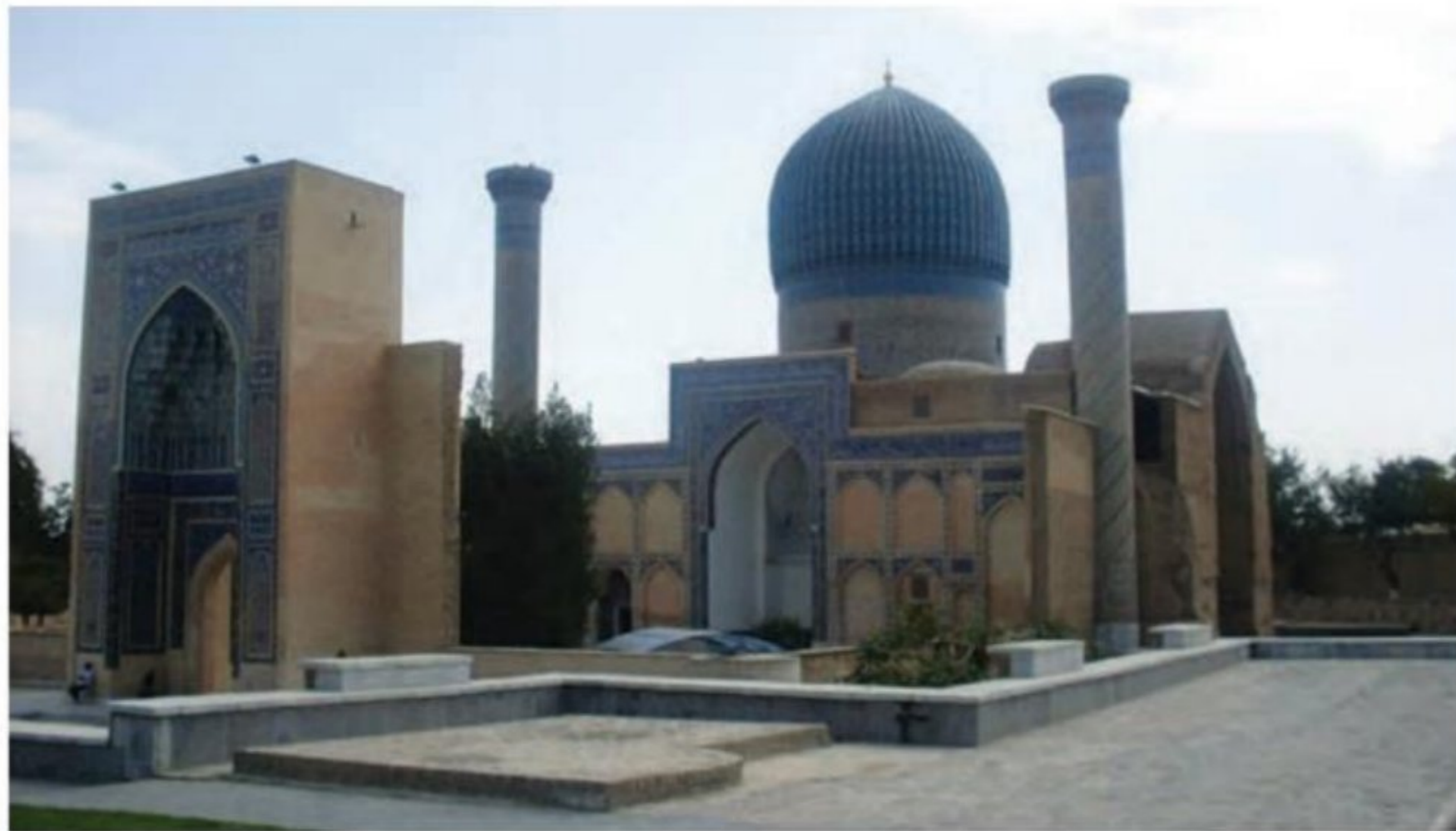
آرامگاه تیمور - سمرقند

(۱۷) شهر و شهرنشینی در عصر تیموریان برخلاف اوایل دوره مغول، دچار رکود و زوال نشد. تیمور با وجود یورش‌ها و کشتارهای زیادی که انجام داد، به شهرسازی علاقه مند بود. او هنرمندان و صنعت‌گران شهرهایی را که فتح می‌کرد به سمرقند، پایتخت خود می‌فرستاد تا در آبادانی و زیبایی آن شهر بکوشند.)