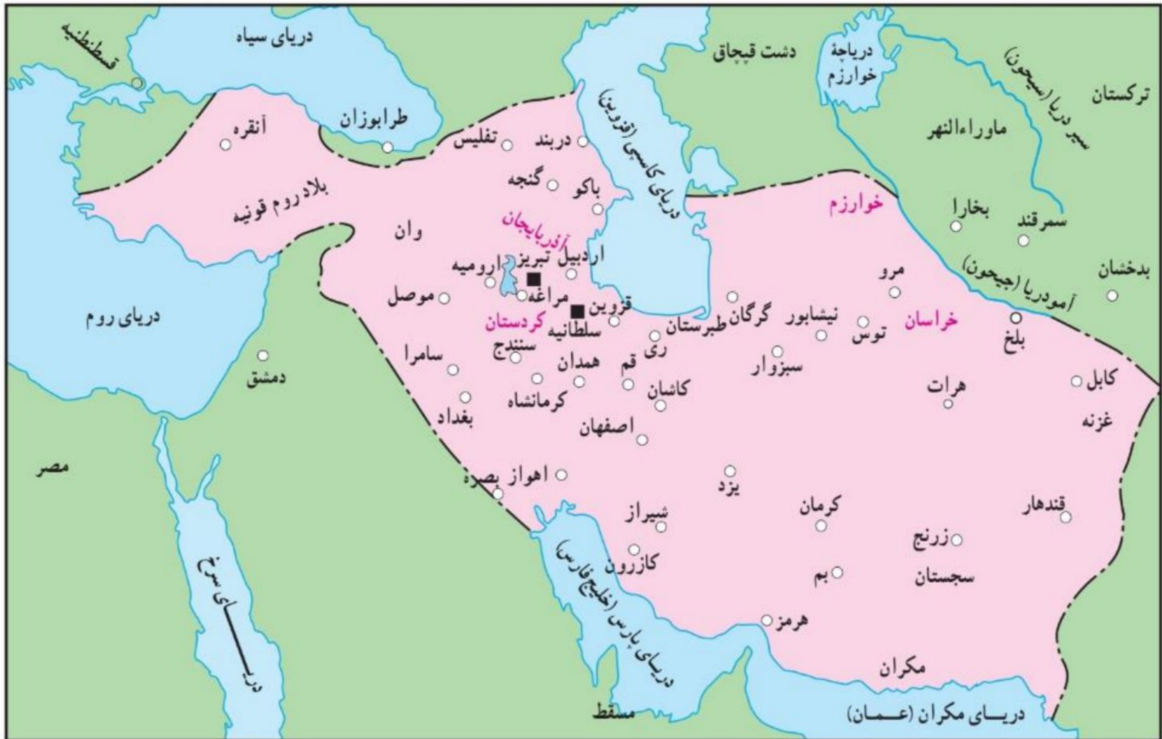
قلمرو ایلخانان در زمان غازان خان