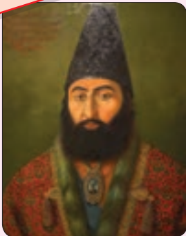
تندیس امیر کبیر

○ امیر کبیر، میرزا تقی‌خان فراهانی مشهور به امیر کبیر در روستایی در اراک به دنیا آمد. او صدراعظم یا نخست‌وزیر ناصرالدین شاه بود. امیر کبیر وقتی به این مقام رسید، آرزو داشت ایران را به کشوری مستقل و آباد تبدیل کند. در زمان او دولت‌های روس و انگلیس به شدت در امور کشور دخالت می‌کردند. امیر کبیر از دخالت شاهزادگان و درباریان در کشور جلوگیری نمود. او مدرسه‌ای تأسیس کرد تا افراد با علوم و فنون جدید آشنا شوند؛ روزنامه منتشر کرد و چندین کارخانه نیز تأسیس کرد. او از دخالت نمایندگان خارجی در امور داخلی ایران جلوگیری می‌کرد و می‌گفت: «نه به انگلیس امتیاز می‌دهیم و نه به روسیه». بیگانگان که فهمیده بودند با مردی روبه‌رو شده‌اند که نمی‌گذارد به اهدافشان برسند با بعضی از درباریان همدست شدند و آن قدر علیه او نزد شاه بدگویی کردند که شاه او را از صدراعظمی برکنار کرد و سپس با دستور ناجوانمردانه‌ی شاه، او را در فین کاشان به شهادت رساندند.