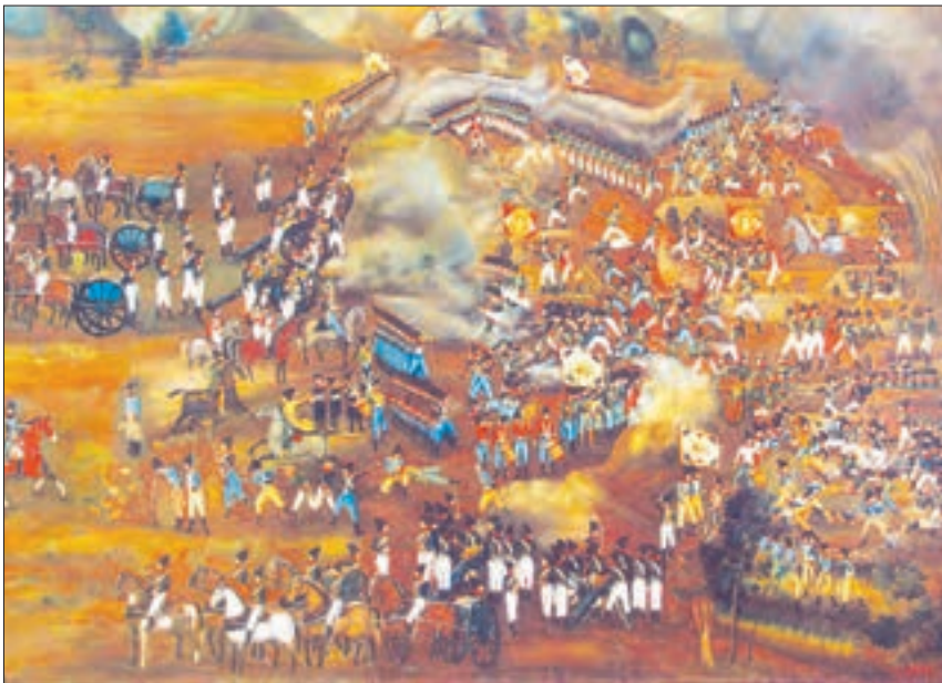
▲ تابلوی نقاشی از جنگ ایران و روس در عهد فتحعلی شاه قاجار

این بار ماشین زمان، شما را حدود صد سال به عقب برده است. شما در ایران هستید. مردم را پریشان و اندوهگین می‌بینید. با آنها گفت‌وگو می‌کنید. از سفرهای شاه و شاهزادگان به اروپا، رفت و آمد بیگانگان در دربار و دخالت آنها در امور کشور مطالبی می‌شنوید و می‌فهمید که نظامیان روسیه، شمال ایران را اشغال کرده‌اند و انگلیس‌ها از جنوب هجوم آورده‌اند. گروهی از مردم فداکار در حال مبارزه و جنگ با آنها هستند. فقر و بدبختی همه‌جا را گرفته. . . . از خود می‌پرسید چرا بیگانگان به این کشور هجوم آورده‌اند؟ آنها چه می‌خواهند؟ چرا مردم در چنین وضعیتی زندگی می‌کنند؟ چه کسانی به استعمارگران اجازه می‌دهند تا در کشور دخالت کنند؟