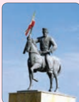
▲ مجسمه‌ی رئیس علی دلواری ▲ رئیس علی در بوشهر

○ دکتر محمد مصدق و آیت‌الله سید ابوالقاسم کاشانی از آغاز کشف و استخراج نفت در ایران، دولت انگلستان که از محصول نفت ایران درآمد زیادی کسب می‌کرد با بستن قراردادهایی منابع نفتی ما را غارت می‌کرد. دکتر محمد مصدق که در زمان حکومت پهلوی نماینده‌ی مجلس بود، شجاعانه در مقابل استعمار انگلیس ایستاد و برای ملی کردن نفت به مبارزه برخاست. در همان زمان آیت‌الله کاشانی نیز که از علمای مبارز و مخالف شدید استعمارگران بود از نهضت ملی شدن نفت ایران حمایت کرد و در این کار نقش بسیار مهمی داشت. سرانجام در اسفندماه سال ۱۳۲۹ شمسی مجلس شورای ملی قانون ملی شدن نفت را تصویب کرد تا دست بیگانگان را از نفت ایران کوتاه کند.