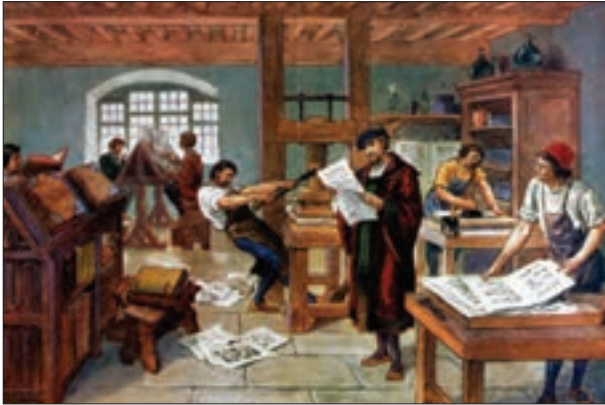
یک کارگاه چاپ در اروپا

اروپاییان در علوم و فنون پیشرفت‌هایی کردند. اختراع دستگاه چاپ به وسیله گوتنبرگ و تلسکوپ به وسیله گالیله، نمونه‌هایی از اختراعات آن دوره است.