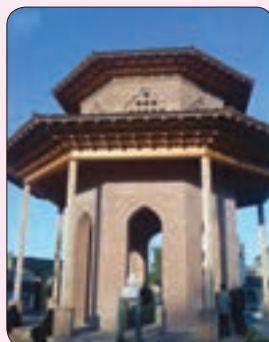
▲ آرامگاه میرزا کوچک خان ▲ میرزا کوچک خان جنگلی در رشت

○ رئیس علی دلواری : رئیس علی دلواری در اطراف شهر بوشهر چشم به جهان گشود. رئیس علی مردی شجاع بود و ایمانی قوی داشت. او در تیراندازی و سوارکاری ماهر بود. با شروع جنگ جهانی اول، انگلیسی‌ها جنوب ایران به‌ویژه بوشهر را اشغال کرده، و پرچم خودشان را در آنجا افراشته بودند. او درباری اشغال نظامی ایران به چند تن از روحانیون بوشهر نامه نوشت و آنها نیز در جواب گفتند که جنگیدن با اشغالگران واجب است. رئیس علی و هوادارانش که به آنها دلبران تنگستان می‌گفتند، قهرمانانه با انگلیسی‌ها جنگیدند اما در یکی از این نبردها، رئیس علی تیر خورد و به شهادت رسید.