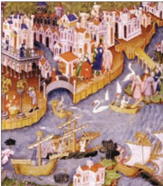
ساختن شهرها در اروپا

حدود چهار قرن پیش، تجارت و داد و ستد میان اروپاییان و مسلمانان گسترش یافته بود. اروپاییان از طریق دریای مدیترانه و شمال آفریقا، محصولات نظیر شکر، قهوه، کاغذ، قطب‌نما، داروی گیاهی و ادویه را از مسلمانان خریداری می‌کردند. در این رفت و آمدها، علوم و فنون مسلمانان مورد توجه آنها قرار می‌گرفت. اروپاییان کتاب‌های پزشکی جهان اسلام و بسیاری کتاب‌های دیگر علوم اسلامی را به زبان خودشان ترجمه کردند و توانستند از این علوم استفاده کنند. به تدریج علوم و فنون مسلمانان به شیوه‌های مختلف به اروپا انتقال یافت.