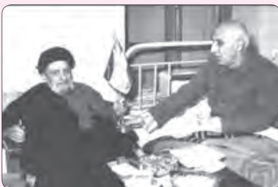
▲ دکتر مصدق و آیت‌الله کاشانی

○ دکتر محمد مصدق و آیت‌الله سید ابوالقاسم کاشانی از آغاز کشف و استخراج نفت در ایران، دولت انگلستان که از محصول نفت ایران درآمد زیادی کسب می‌کرد با بستن قراردادهایی منابع نفتی ما را غارت می‌کرد. دکتر محمد مصدق که در زمان حکومت پهلوی نماینده‌ی مجلس بود، شجاعانه در مقابل استعمار انگلیس ایستاد و برای ملی کردن نفت به مبارزه برخاست. در همان زمان آیت‌الله کاشانی نیز که از علمای مبارز و مخالف شدید استعمارگران بود از نهضت ملی شدن نفت ایران حمایت کرد و در این کار نقش بسیار مهمی داشت. سرانجام در اسفندماه سال ۱۳۲۹ شمسی مجلس شورای ملی قانون ملی شدن نفت را تصویب کرد تا دست بیگانگان را از نفت ایران کوتاه کند.