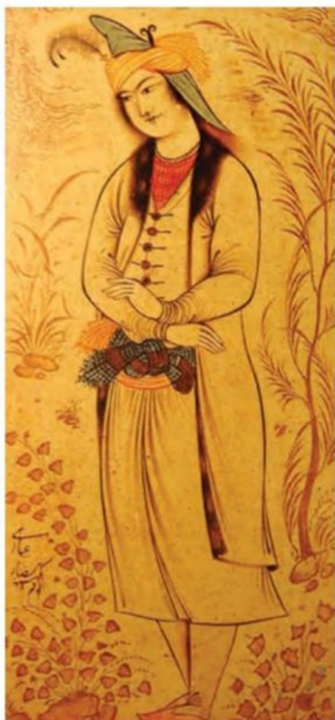
شاهزاده محمد بیگ گرجی، یکی از شاهکارهای نگارگری رضا عباسی