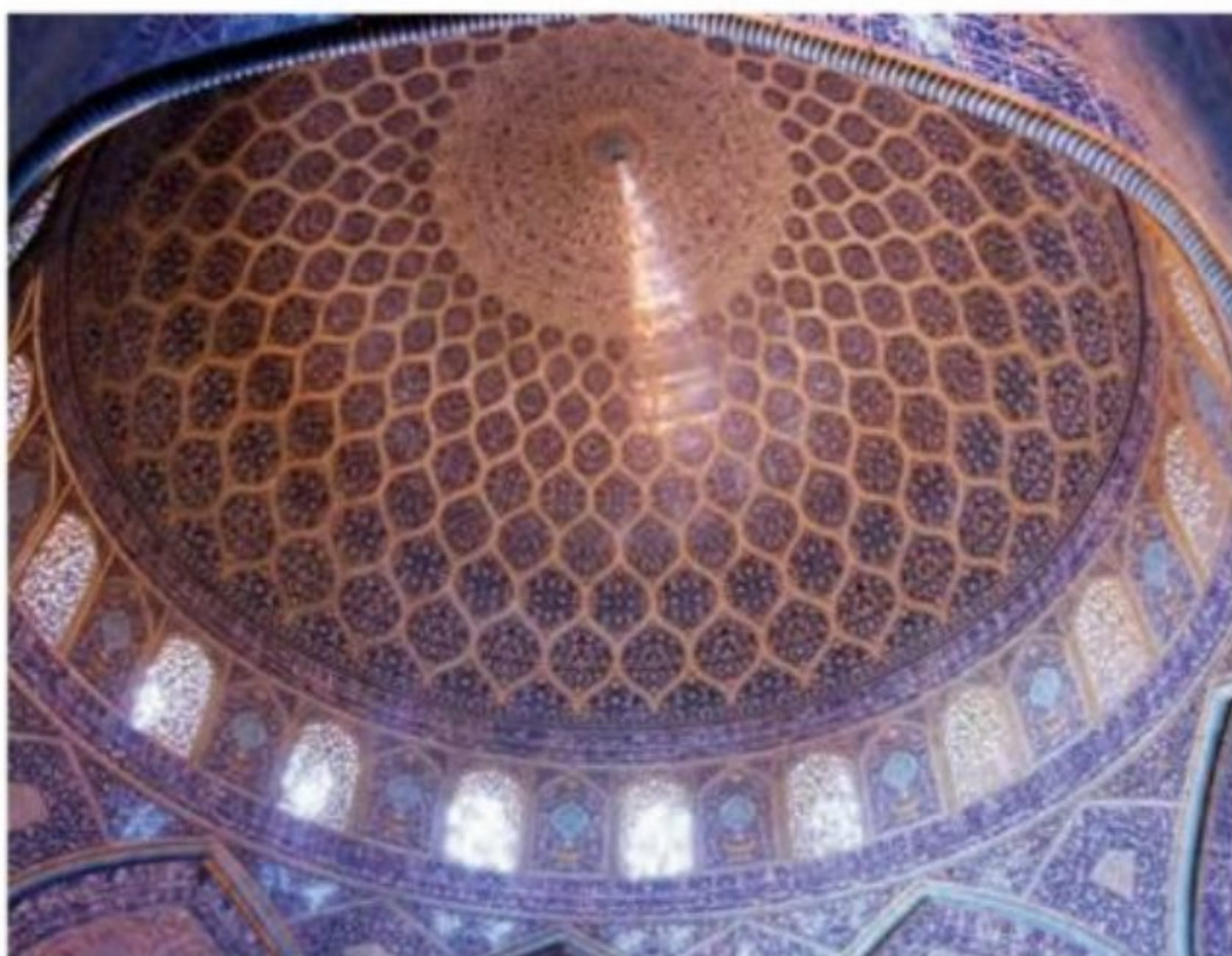
مسجد شیخ لطف الله، شاهکار هنر کاشی کاری ایران

عصر صفویان یکی از دوره‌های درخشان معماری ایران است. ۹ (معماری ایرانی در این دوره، با برخورداری از تجارب معماری فاخر عصر تیموری و نیز در سایه ثبات، امنیت و حمایت پادشاهان به ویژه شاه عباس اول، شکوفا شد.) شکوه و عظمت بناهایی که در این عصر در سرتاسر ایران به ویژه در اصفهان و قزوین ساخته شده، اعجاب آور و تحسین برانگیز است. ۹ یکی از اعضای هیئت اعزامی لوئی چهاردهم، پادشاه مقتدر فرانسه به اصفهان، پایتخت ایران را به واسطه داشتن پل‌های کم نظیر، مسجدهای فیروزه‌ای و پهناور و تناسب و ظرافت خانه‌های مجلل و کاخ‌های شاهانه ستوده است. ۱ در عصر صفوی نه تنها در اصفهان بلکه در سراسر ایران بناهای زیادی نظیر، مساجد، پل‌ها، مدارس، جاده‌ها، میدان‌ها، کاخ‌ها، باغ‌ها و کاروان‌سراها ساخته شد.