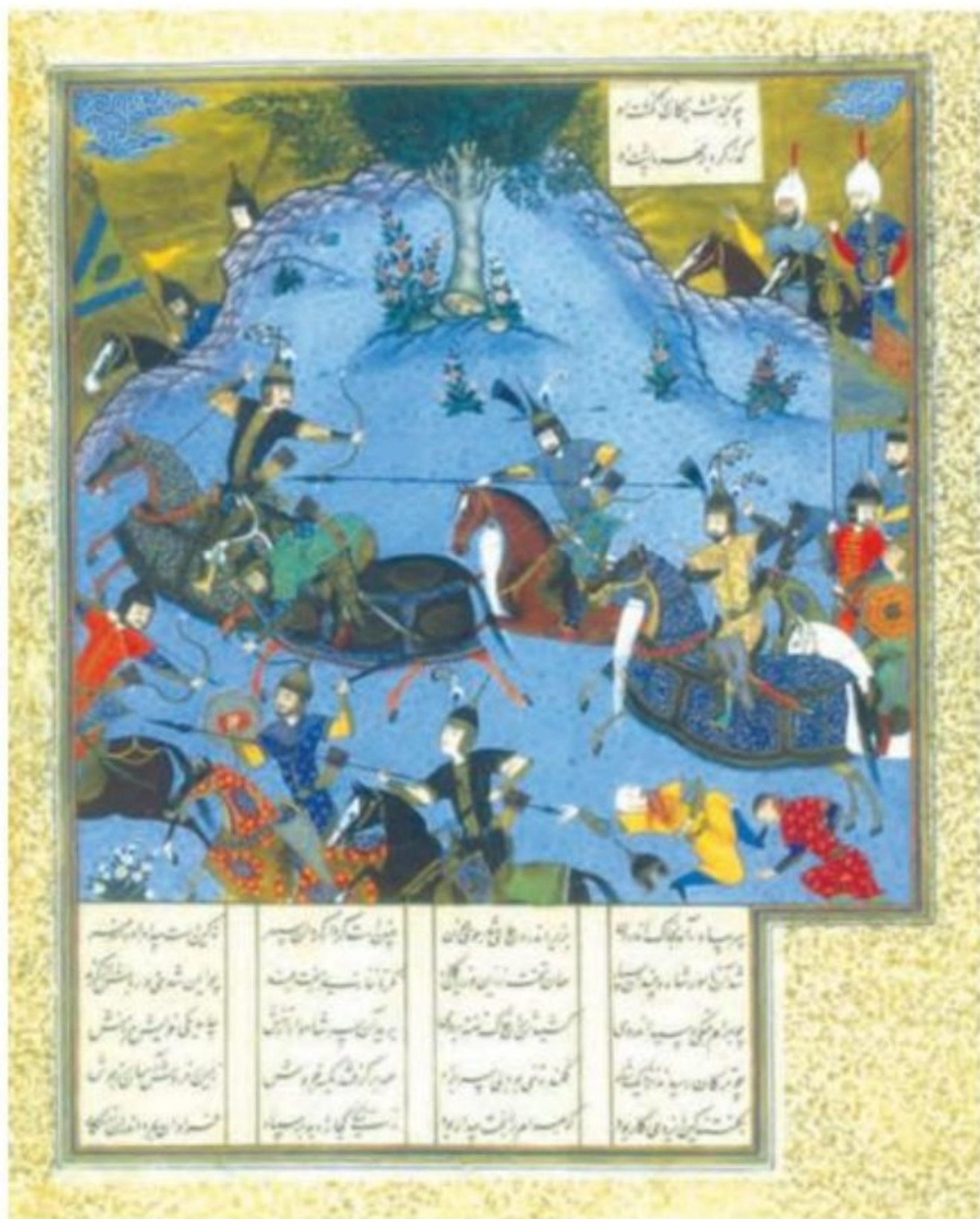
برگی از شاهنامه تهماسبی