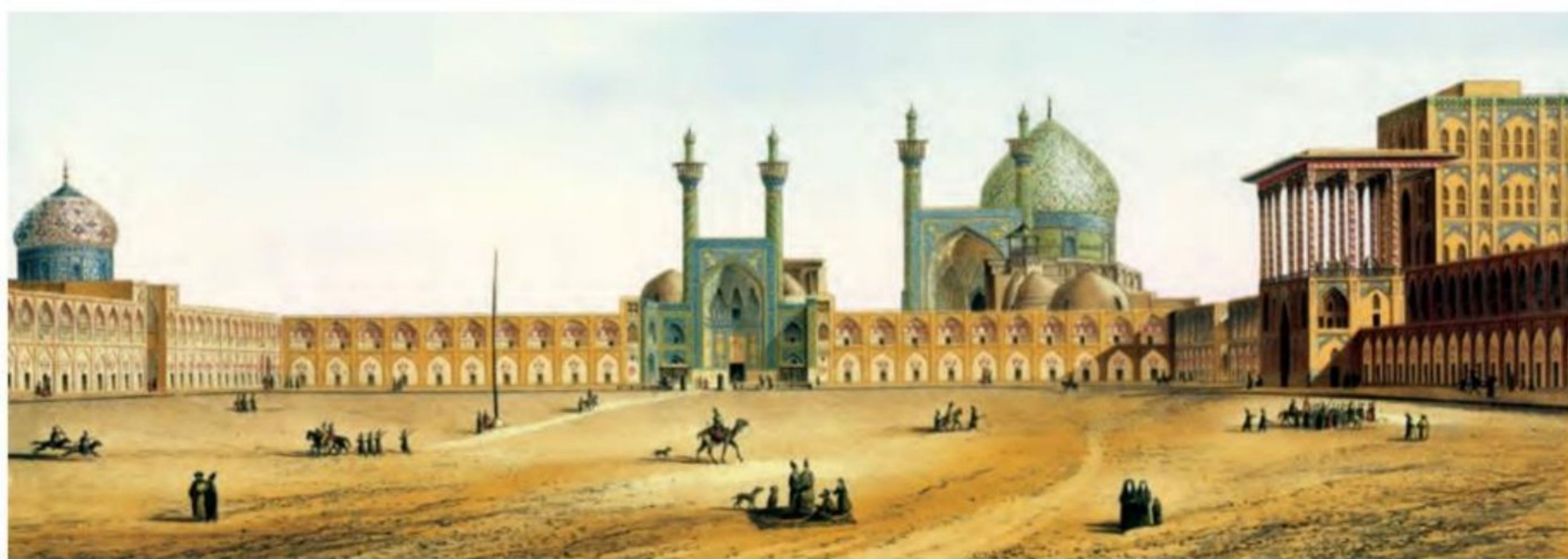
نقاشی یک معمار فرانسوی از میدان نقش جهان در حدود ۱۸۰۰م

داشت. میدان نقش جهان متعلق به دولت و مردم بود. به گزارش سیاحان غربی، در شب عید نوروز میدان نقش جهان مملو از مردم و گروه‌های موسیقی و نمایشی می‌شد. مسجد جامع عباسی (مسجد امام) یکی از زیباترین و مهم‌ترین مساجدی است که در عهد شاه عباس، به عنوان بخشی از مجموعه میدان نقش جهان طراحی و ساخته شد. هماهنگی در رنگ‌ها و نقش‌های کاشی‌ها و طراحی و معماری بی‌نظیر، این مسجد را به یکی از مجموعه‌های عالی معماری صفوی بدل کرده است. در ضلع دیگر این میدان، مسجد شیخ لطف‌الله طراحی و ساخته شده است. مسجد شیخ لطف‌الله به لحاظ وسعت و ابعاد، کوچک‌تر از مسجد جامع عباسی است، اما از نظر فن معماری و زیباشناسی از آثار بی‌نظیر معماری ایران به شمار می‌رود. از ویژگی‌های شاخص هر دو مسجد، کاشی‌کاری هنرمندانه‌ای است که تحسین و شگفتی هر بیننده‌ای را برمی‌انگیزد.