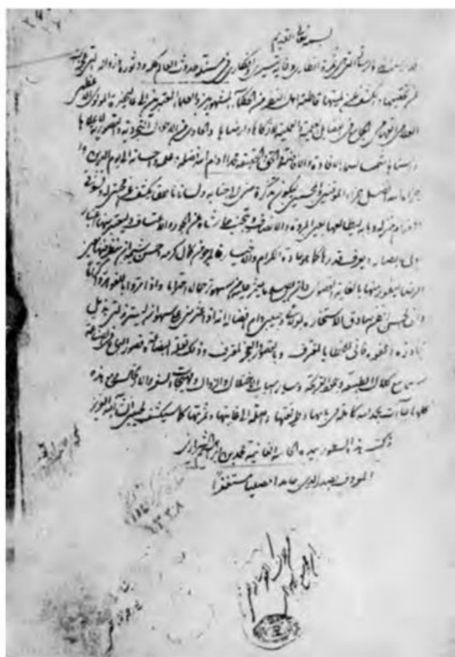
دستخط ملاصدرا - نامه او به ملاشمسای گیلانی، کتابخانه دانشگاه تهران، شماره ۲۶۰۲

در عصر صفوی در علمی چون فقه، کلام و تفسیر، علمای بزرگی پا به عرصه نهادند. دانشمندانی چون محمدتقی مجلسی (۱۰۰۳-۱۰۷۰ق)، فقیه، محدث و مؤلف کتاب‌های مهمی در حدیث و فقه و فرزند دانشمندش محمدباقر مجلسی (۱۰۳۷-۱۱۱۰ق)، صاحب دائرةالمعارف بزرگ حدیثی به نام بحار الانوار، از بزرگان عصر خود محسوب می شدند. در حوزه فلسفه و عرفان، میرداماد (۹۶۹-۱۰۴۰ق)، از بنیان گذاران مکتب فلسفی اصفهان، صاحب تألیفات ارزشمند و شهرتی بسیار است. یکی از برجسته ترین علمای ایران در عصر صفوی، بهاءالدین محمدبن حسین عاملی (۹۵۳-۱۰۳۰ق) معروف به شیخ بهایی است که در همه علوم دینی و عقلی و طبیعی عصر صاحب نظر بود. از او تألیفات ارزشمندی به جا مانده است. شاخص ترین چهره فلسفی عصر صفوی و دوران بعد تا زمان ما، صدرالدین محمدبن قوام شیرازی (۹۷۹-۱۰۵۰ق)، معروف به صدرالمتهلین و ملاصدرا بود. او که از شاگردان شیخ بهایی و میرداماد بود در فلسفه مؤسس مکتب فلسفی، «حکمت متعالیه» است. ملاصدرا میراث گران قدر چهار جریان فکری بزرگ