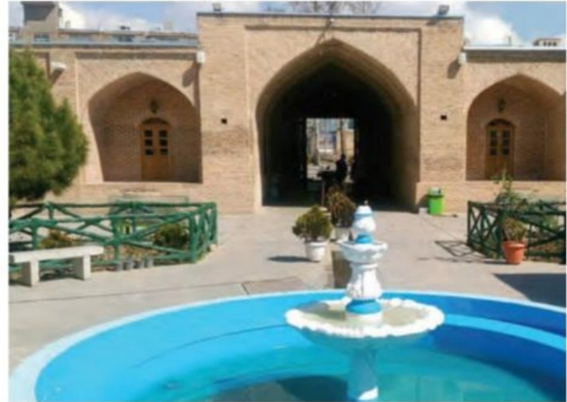
کاروان سرای شاه عباسی - کرج