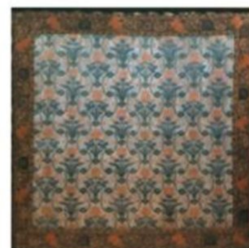
نمونه ای از پارچه های متعلق به دوره صفویه