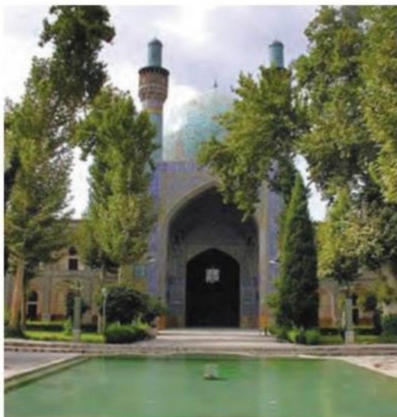
مدرسه چهارباغ - اصفهان

مدرسه: مدرسه در عصر صفوی مرکزی برای آموزش معارف دینی و دیگر علوم بود. ۶ مدارس توسط مقام های حکومتی، شخصیت های مذهبی و برخی از ثروتمندان خیر ساخته و حمایت می شد. بیشتر مدارس دارای موقوفاتی بودند که درآمد آن صرف مخارج این گونه مدارس می شد. پاره ای از وقف نامه های عصر صفوی نشان می دهند که زنان ثروتمند، بخش زیادی از ثروت خود را وقف اداره مدارس اصفهان کرده بودند. ۶ از مدارس معروف عصر صفوی در اصفهان می توان به مدرسه چهارباغ، مشهور به مدرسه مادر شاه و مدرسه شیخ لطف الله اشاره کرد. به معلمان مدارس، مدرس می گفتند. مدرسان دستیارانی داشتند که به آنها خلیفه (مبصر) یا معید گفته می شد و استاد را در امر آموزش کمک می کردند. محیط مدارس از نظر طراحی معماری، فضایی آرام و بانشاط