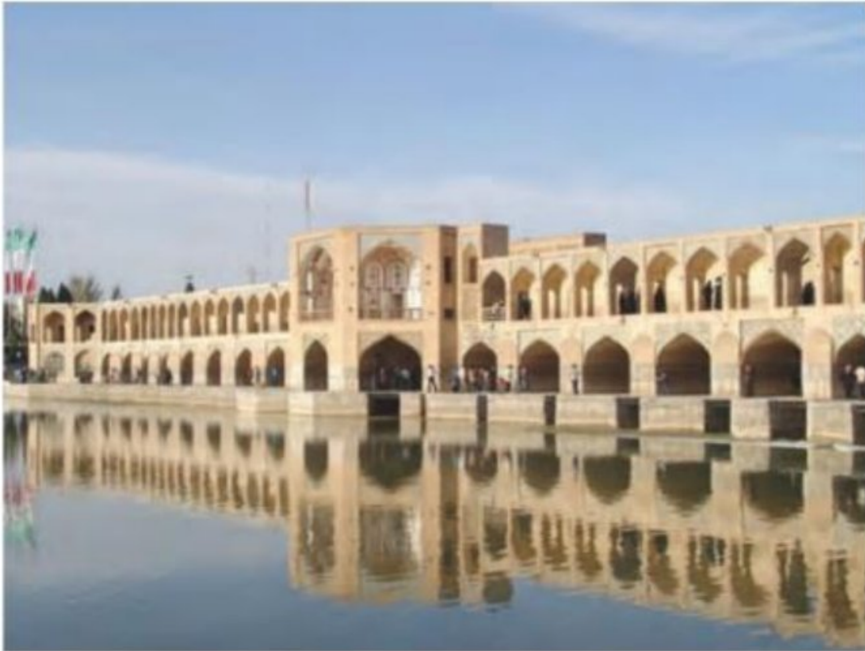
پل خواجه - اصفهان