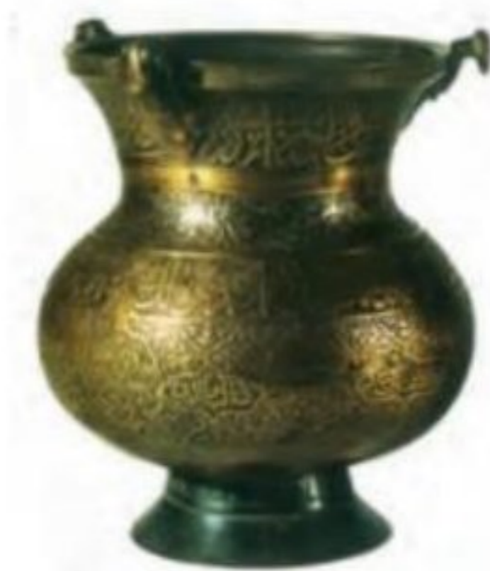
نمونه‌ای از آثار فلزی دوره صفوی