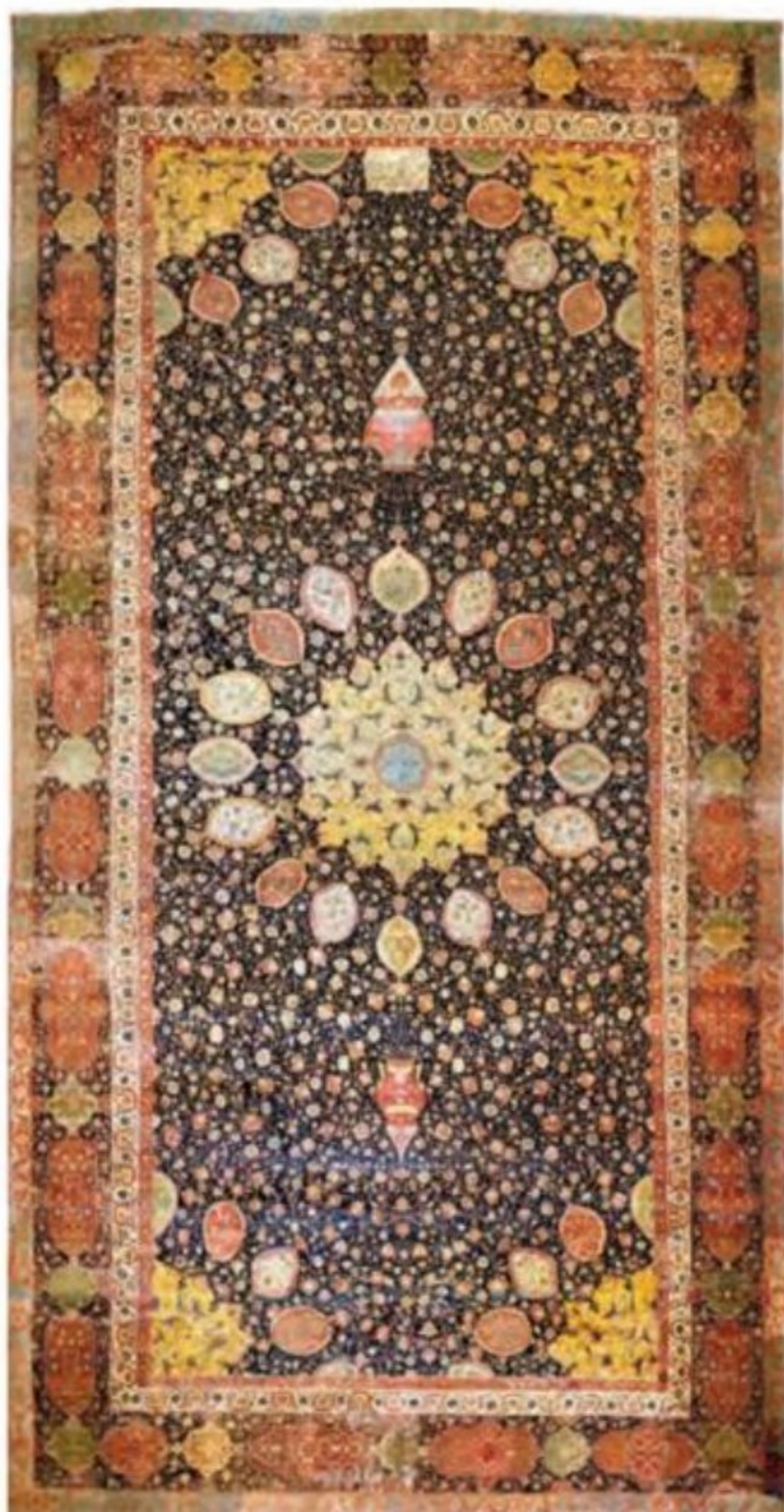
فرش اردبیل - موزه ویکتوریا و آلبرت لندن

در دوره صفوی هنر خوشنویسی در کنار هنر نگارگری به اوج شکوفایی رسید و هنرمندانی چون میرعلی هروی و میرعماد حسنی قزوینی آن را به کمال رسانیدند.