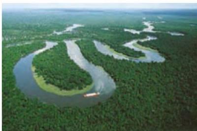
رود آمازون، آمریکای جنوبی

رود آمازون پر آب ترین رودخانه جهان در جنگل های استوایی در آمریکای جنوبی جریان دارد.