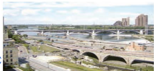
رود می سی سی پی، ایالات متحده آمریکا

رود می سی سی پی در آمریکای شمالی به خلیج مکزیک می ریزد، این رود نقش مهمی در حمل و نقل کالا، منابع و تجارت از طریق کشتیرانی دارد.