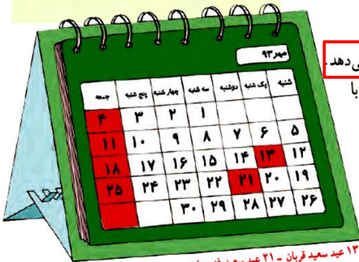
۱۳ عید سعید قربان - ۲۱ عید سعید غدیر خم

آیا تاکنون از تقویم استفاده کرده‌اید؟ تقویم روزها و ماه‌های سال را نشان می‌دهد. معمولاً روزهای تعطیل هفته در تقویم با رنگ قرمز نشان داده می‌شود.