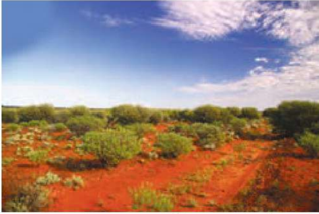
○ بیابان ویکتوریا، حدود ۳۵۰/۰۰۰ کیلومتر مربع وسعت دارد و در آن تپه‌های ماسه‌ای فراوان دیده می‌شود. در این منطقه، بومیان استرالیا از قبایل مختلف زندگی می‌کنند.