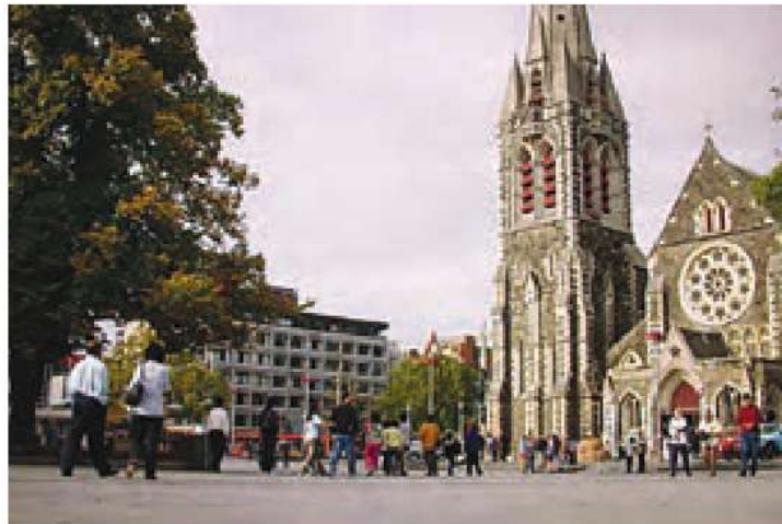
○ کریست چرچ، میدان کلیسا، نیوزیلند

اکنون به نقشه کشور نیوزیلند (زلاندنو) توجه کنید. نیوزیلند، کشوری کوهستانی است رشته‌کوه‌های آلپ جنوبی را در این کشور، نشان دهید. بلندترین قله نیوزیلند چه نام دارد؟ کوک