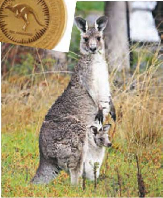
○ کانگورو، نماد کشور استرالیا است و حدود ۶۳ گونه این جانور کیسه‌دار در کشور استرالیا زندگی می‌کنند.