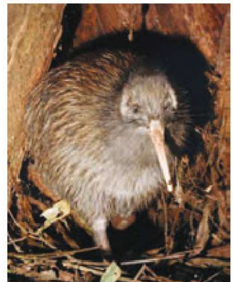
○ کیوی، مرغ نوک‌درازی است که پرواز نمی‌کند. این مرغ، نشانه و نماد کشور نیوزیلند است و تصویر آن را می‌توان روی سکه‌ها و تمبرهای این کشور دید.