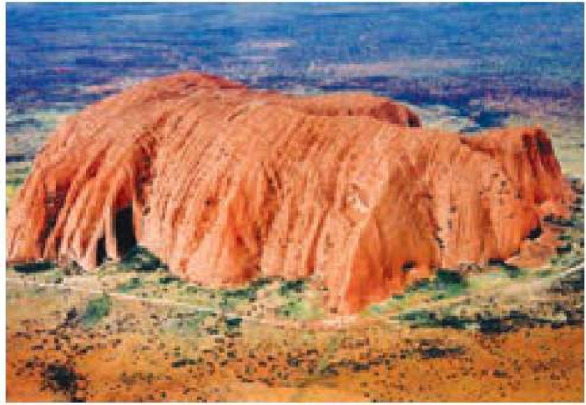
○ آیرز راک (عقیق سرخ)