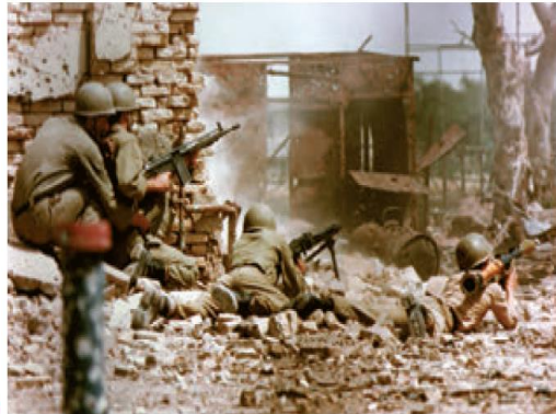
صحنه‌هایی از دفاع رزمندگان