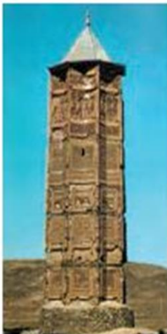
مناره‌ی دوری غزنویان غزنین، افغانستان