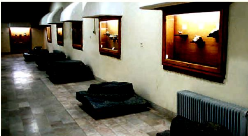
▲ پایه‌های به‌جامانده از ستون‌های کاخ‌ها