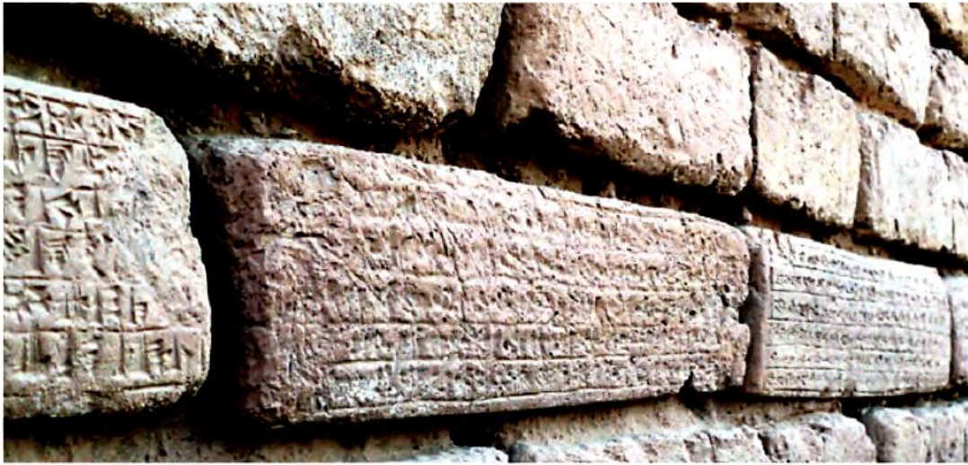
بخشی از دیوار جفازنبیل که روی آجرهای آن خط ایلامی‌ها دیده می‌شود.

از لوح‌های گلی به‌جا مانده از آن روزگار می‌توان پی برد که ایلامی‌ها از خط میخی استفاده می‌کرده‌اند. البته پیش از اختراع خط میخی، ایلامی‌ها از خط تصویری استفاده می‌کردند. در خط تصویری برای نوشتن هر چیز شکل آن را می‌کشیدند.