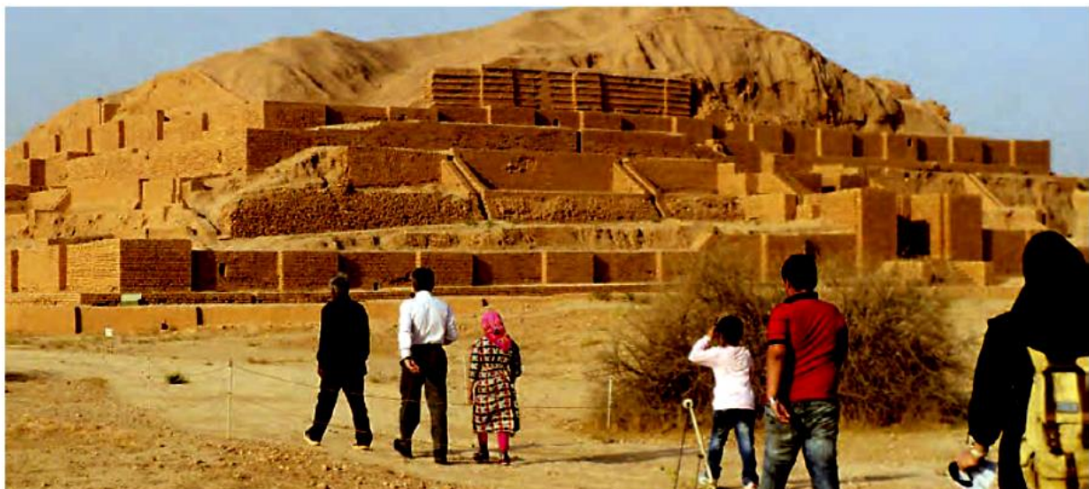
گردشگران در حال بازدید از معبد چغازنبیل که از دوره‌ی تمدن ایلام به جا مانده است. (استان خوزستان)

در سرزمین ایلام پرستش‌گاه‌های (معابد) بزرگی ساخته شده بود که مردم در آنجا خدایان ایلامی را عبادت می‌کردند. در آن دوره پرستش‌گاه‌ها را به صورت بناهایی عظیم در مکان‌های بلند می‌ساختند. پرستش‌گاه مشهور عظیم چغازنبیل یکی از این بناهاست که امروزه می‌توان باقی‌مانده‌ی آن را در نزدیکی شهر شوش دید.