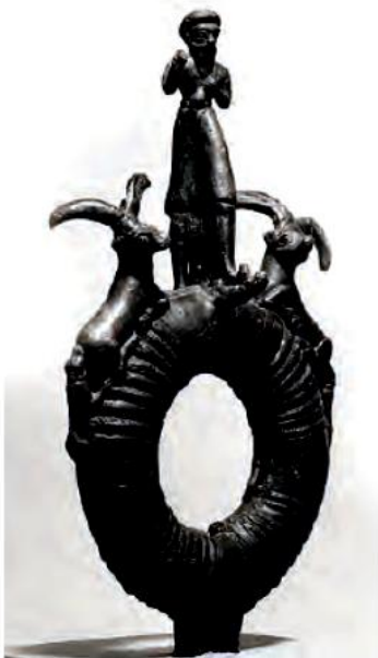
این تصویر سر باقیمانده از یک برجم ایلامی از جنس برنز است.

مردم ایلام به کشاورزی، دامداری، فلزکاری، سفالگری، نجاری، مجسمه‌سازی، تجارت و... مشغول بودند.