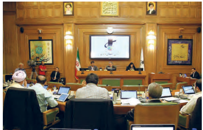
شورای اسلامی شهر تهران