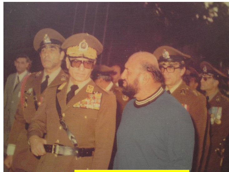
شعبان جعفری و رضا شاه

همزمان با این اقدامات عوامل نظامی کودتا مناطق حساس از جمله ستاد ارتش، ایستگاه رادیو، مراکز پلیس و ژاندارمری، مرکز تلفن و تلگراف و خانه دکتر مصدق و یارانش را تصرف کردند. زاهدی سوار بر تانک به نخست‌وزیری رفت و واحدهای انتظامی و نظامی طرفدار دکتر مصدق اقدام مؤثری علیه کودتا نکردند.