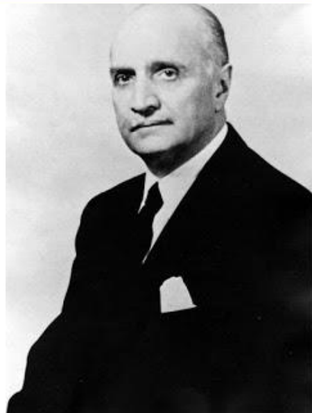
لوئی هندرسون سفیر آمریکا

لویی هندرسن سفیر آمریکا که نقش مهمی در روزهای حساس کودتای ۲۸ مرداد ۳۲ برعهده داشت، او به دکتر مصدق تکلیف کرد که از پست خود کناره گیری کند ولی دکتر مصدق با عتاب او را از خانه اش بیرون کرد.