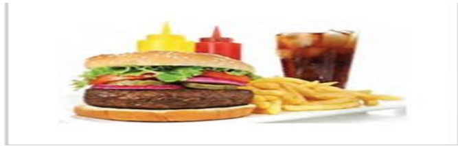
رواج غذاهای آماده و نوشیدنی‌های گازدار ناسالم