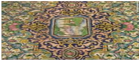
کلیه‌ای کوچک به سبک نقاشی‌های اروپایی روی کاشی‌های ایرانی (کاخ گلستان)

خودباختگی جوامع غیرغربی در برابر جهان غرب را « غرب زدگی » می نامند.