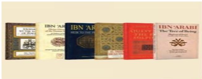
■ نمونه ای از کتاب های منتشر شده این عربی در غرب

جهان غرب طی جنگ های صلیبی، پس از رویارویی با فرهنگ اسلامی و پذیرش برخی لایه های آن، بدون اینکه به جهان اسلام بپیوندد، تحولات هویتی پیدا کرد، با عبور از عقاید و ارزش های مسیحیت قرون وسطی ، به عقاید و ارزش های دنیوی و سکولار روی آورد و هویت جدیدی پیدا کرد .