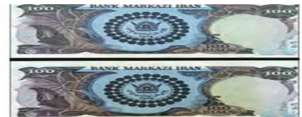
در تاریخ ۲۵ اسفند ۱۳۵۴ خورشیدی، با تصویب مجلس شورای ملی و مجلس سنا، گادشماری شاهنشاهی، تقویم رسمی کشور شد. در این مصوبه مبدأ تقویم خورشیدی از هجرت پیامبر اسلام به تاریخ تقویمی تاج‌گذاری کوروش تغییر یافت.

۱۸- معانی از خودبیگانگی فرهنگی را نام ببرید.