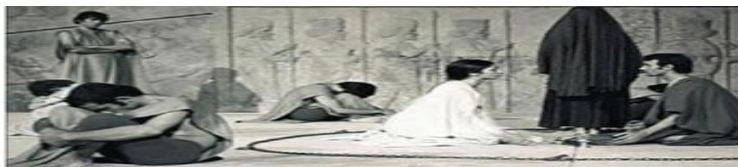
چشم هنر شیراز. مراسمی خارج از معیارهای اخلاقی بود که از سال ۱۳۴۶ در شیراز و به ریاست فرح بهلوی برگزار می‌شد و یکی از نشانه‌های ابتذال رژیم پهلوی و ترویج سیاست‌های غرب‌گرایانه بود. سفیر وقت انگلستان در ایران در خاطرات خود آورده است که به شاه گفتم که اگر چنین نمایشی در شهر منجستر اجرا می‌شد، کارگردانان و هنرپیشگان جان سالم به‌در نمی‌بردند. شاه مدتی خندید و چیزی نگفت. (خاطرات دو سفیر، ویلیام سولیوان و سر آنتونی پارسونز)

«از خودبیگانگی» - «از خودبیگانگی فرهنگی»