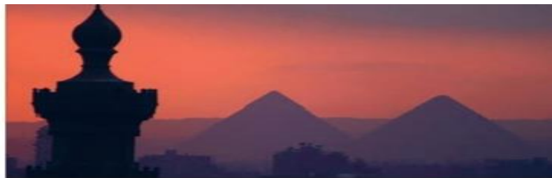
■ مصر در تعامل با جهان اسلام و پذیرش عقاید و ارزش های توحیدی آن، دچار تحولات هویتی شد.

۱۰- چگونگی تحولات هویتی غرب، طی جنگ های صلیبی، پس از رویارویی با فرهنگ اسلامی را توضیح دهید.