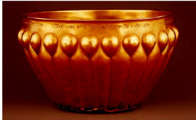
ظرف فلزی برای نگهداری مواد غذایی و آب