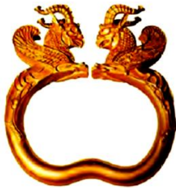
دستیند یا بازوبند

به تصویرها نگاه کنید و حدس بزنید که این وسایل چیستند؟ ایرانیان باستان از هر کدام از این وسایل چه استفاده‌ای می‌کرده‌اند؟