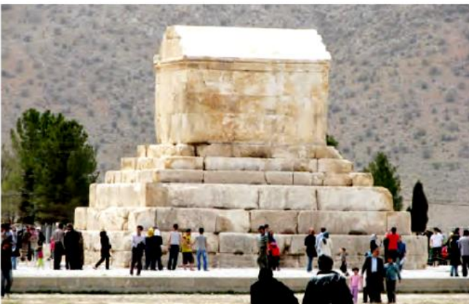
مقبره‌ی کوروش - پاسارگاد