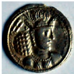
سکه برای خرید و فروش