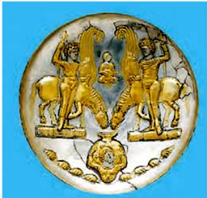
لوح سنگی یا سکه