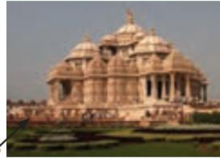
آکشاردام - بزرگ ترین معبد هندوها