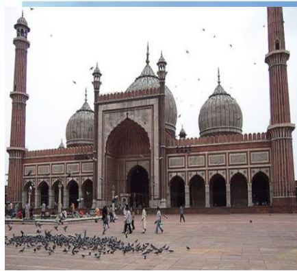
مسجد جامع دهلی، یکی از بزرگ ترین مساجد جهان