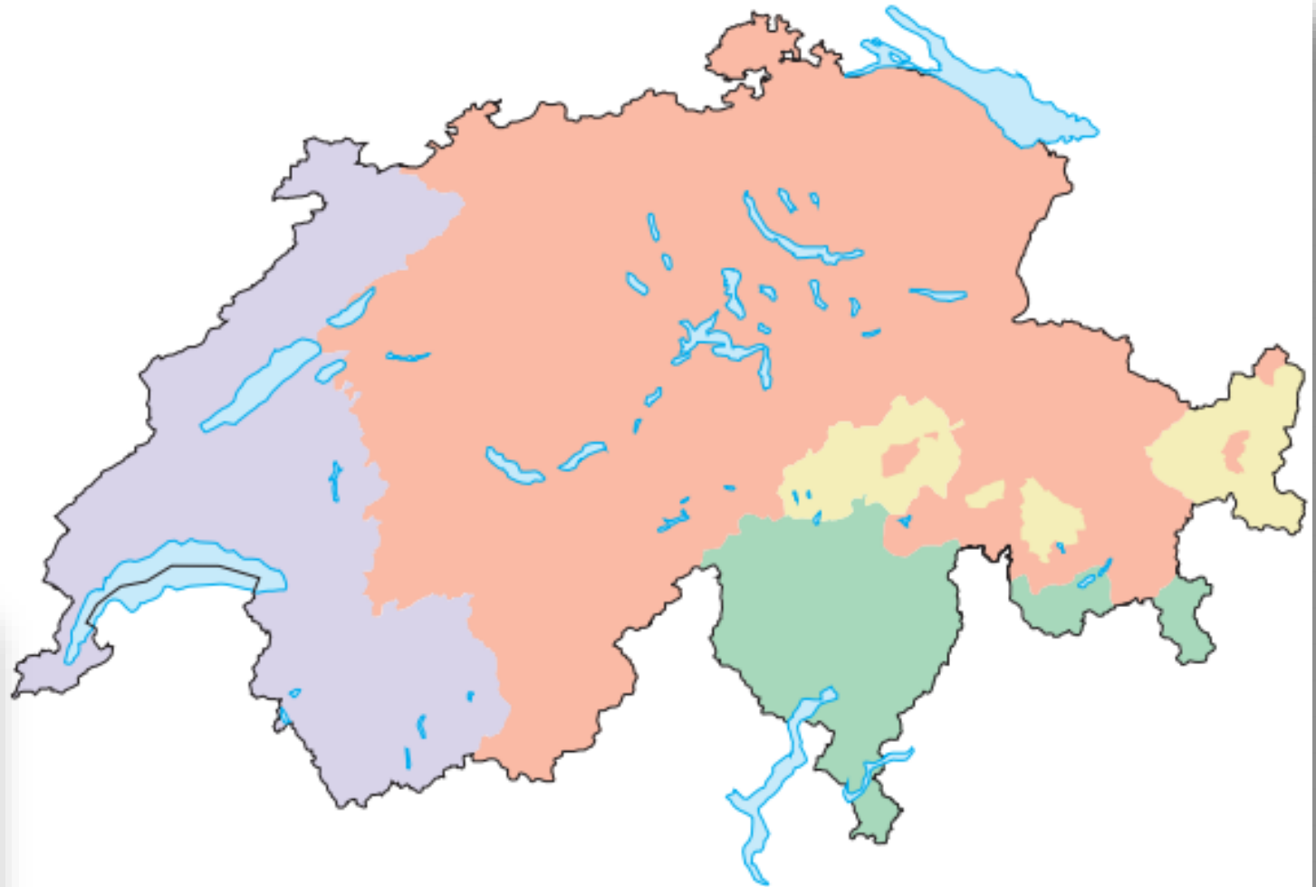
نقشه ۵- پراکندگی نواحی زبانی اصلی در سوئیس

به نقشه شماره ۵ توجه کنید. در کشور سوئیس چهار زبان رسمی وجود دارد.