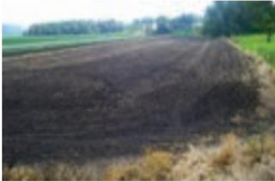
خاک چرنوزوم (خاک حاصلخیز غنی از مواد آلی و ریشه علفزارها)