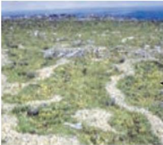
خاک کریوزول (خاک یخ بسته نواحی توندرا)

در نقشه ۲ پراکندگی خاک ها در کانادا را مشاهده می کنید. نوع خاک، ناحیه هایی متمایز از یکدیگر به وجود می آورد و بر نوع پوشش گیاهی و کشت و... نیز اثر می گذارد.