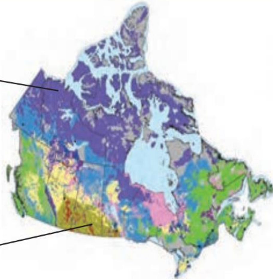
نقشه ۲- نواحی خاک کانادا