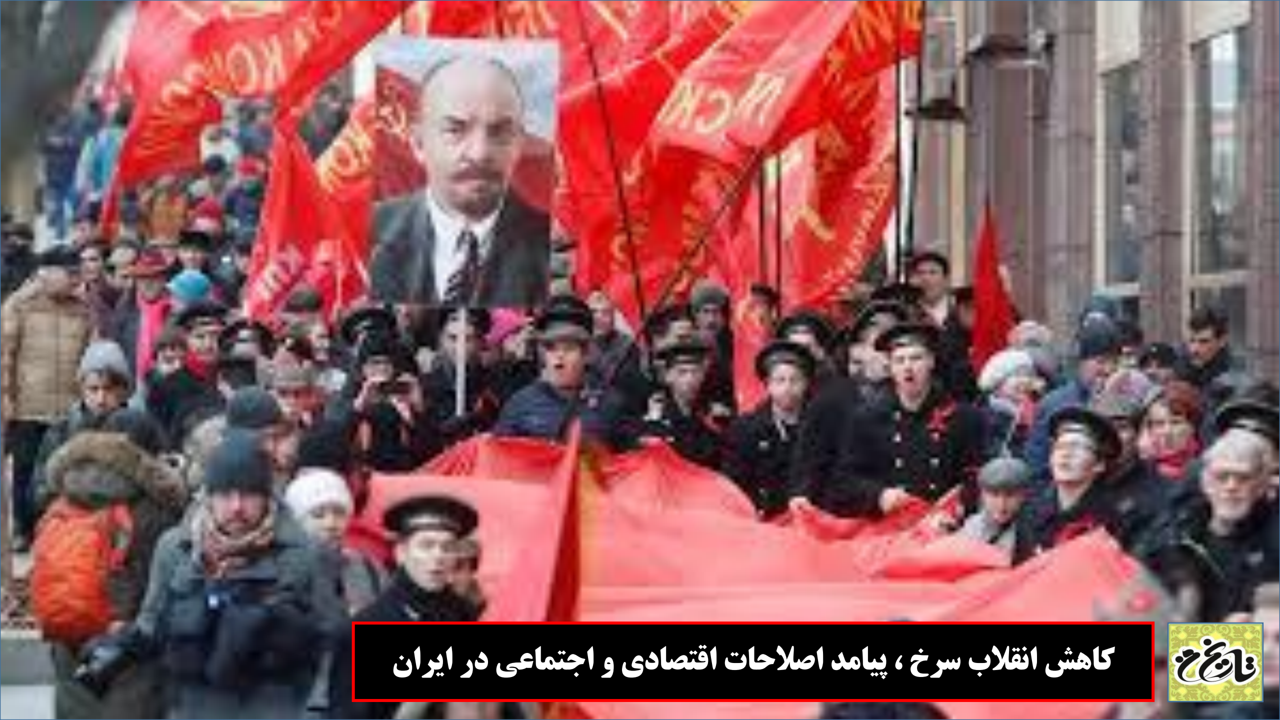
کاهش انقلاب سرخ ، پیامد اصلاحات اقتصادی و اجتماعی در ایران