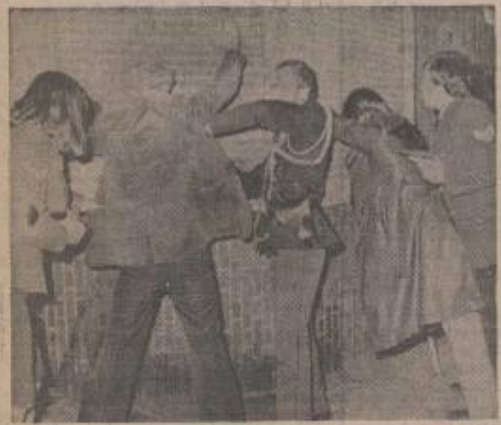
گروهی از جوانان مستعجبی

ر بایند گان هو اپیمای آلمانی گذر نامه جعلی ایرانی داشتند