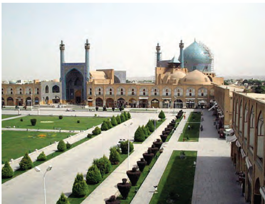
اصفهان، میدان امام

۴ کسی که معتقد است تنها شهود وحیانی قابل اعتبار است.