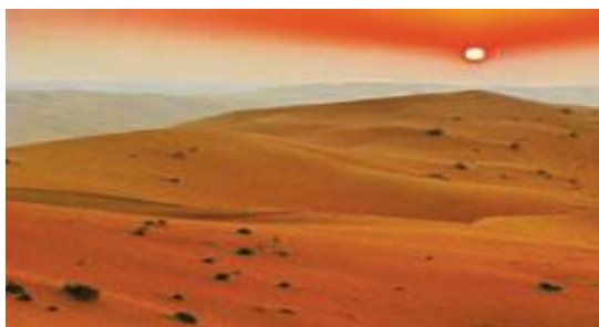
بیابان ربع الخالی ، عربستان