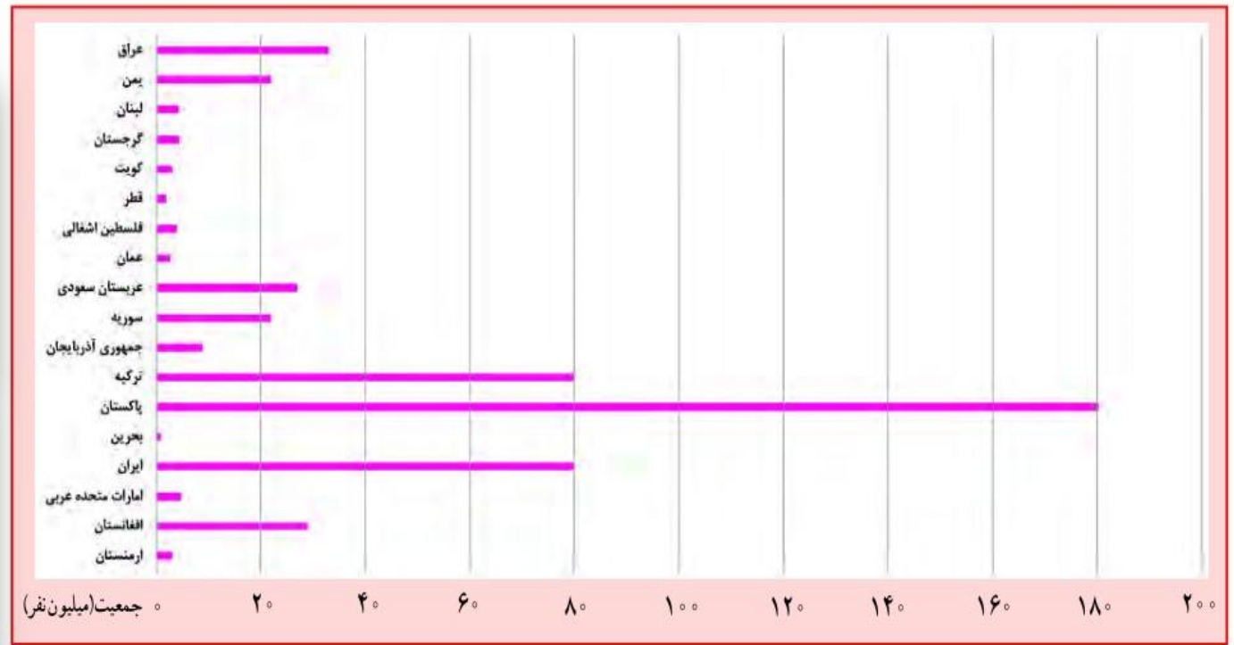
مقایسه جمعیت کشورهای آسیای جنوب غربی