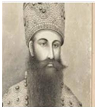
عباس میرزا، نخستین اصلاح طلب

عباس میرزا، ولیعهد فتحعلی شاه و فرمانده لشکر ایران در جریان جنگ با روسیه، متوجه تأثیر علم و صنعت بر پیشرفت های نظامی آن کشور شد و به این نتیجه رسید که تعداد زیاد سپاهیان ایران و دلاوری و فداکاری های آن ها، برای پیروزی کافی نیست. از این رو به فکر نوسازی و اصلاح امور کشور افتاد.