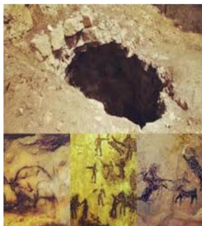
غار دوشه خرم آباد