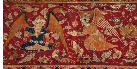
هنر فرشبافی عصر صفوی

برخی از محققان، دوره صفوی را عصر طلایی پارچه بافی در ایران می دانند.