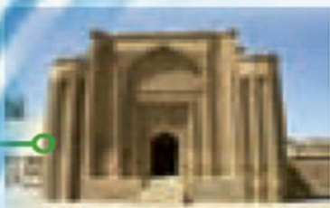
آغاز حکومت خوارزمشاهیان

از اواخر قرن چهارم تا اوایل قرن هفتم هجری، سه سلسله ترک تبار در ایران حکومت کردند.