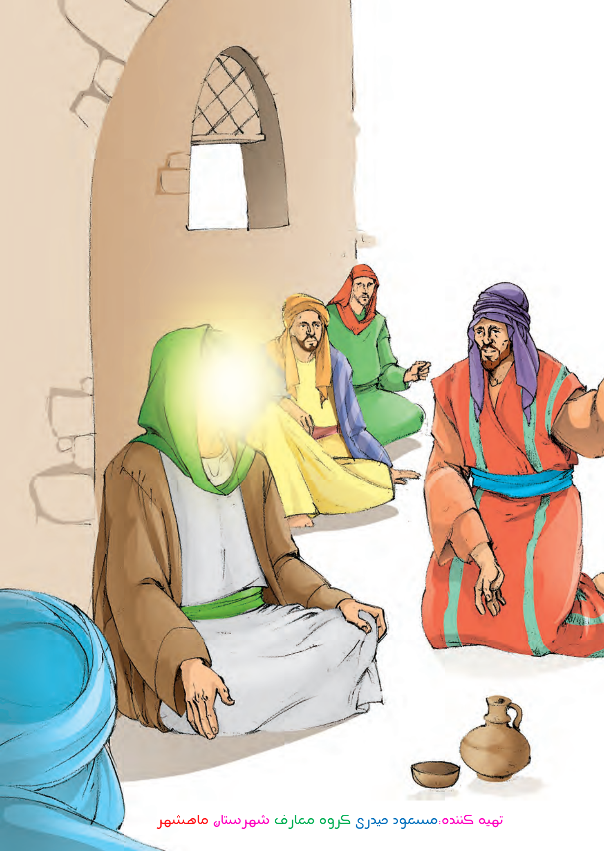
تهیه کننده: مسعود صیدری گروه معارف شهرستان ماهشهر