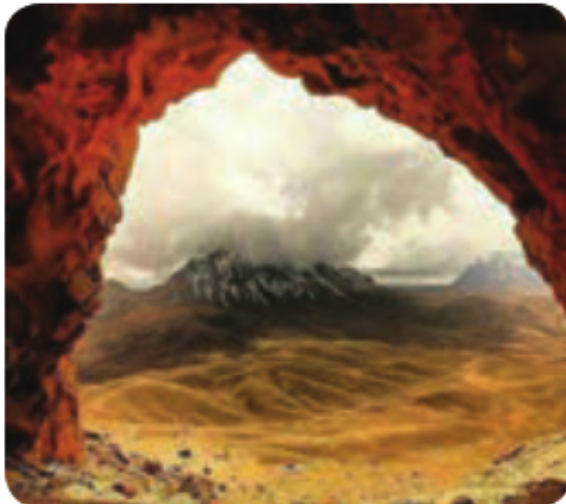
غارها، سکونتگاه انسان‌های نخستین

امنیت در زبان فارسی به معنای در امان بودن از آسیب‌ها، امن بودن، در پناه بودن، نداشتن دلهره، نگرانی و ترس و... آمده است. در ساده‌ترین تعریف، امنیت یعنی دور بودن از خطراتی که علیه منافع مادی (جان، مال، سرزمین و...) و ارزش‌های معنوی (دین، فرهنگ، اعتقادات و...) ما وجود دارد.