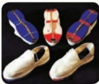
کلاش (گیوهی کرمانشاهی)