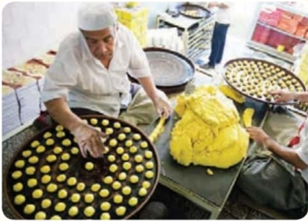
تهیه و بخت نان برنجی