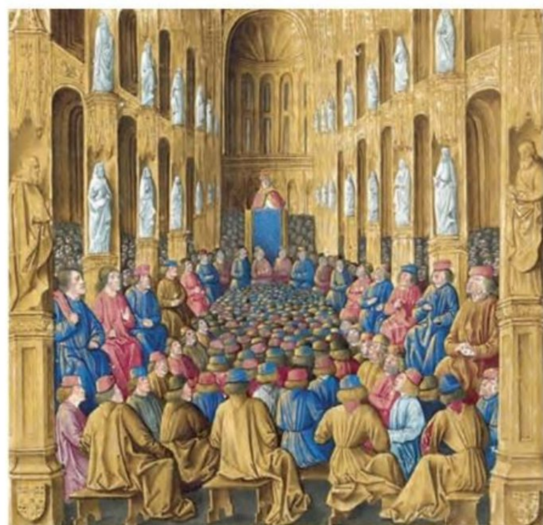
پاپ اوربان دوم هنگام موعظه و تشویق مسیحیان برای شرکت در جنگ‌های صلیبی - اثر جین کلمبو نقاش فرانسوی قرن ۱۵م

علل و عوامل جنگ‌های صلیبی: مجموعه‌ای از علل و عوامل مختلف دینی، اقتصادی، اجتماعی و سیاسی در بروز جنگ‌های صلیبی نقش داشت.