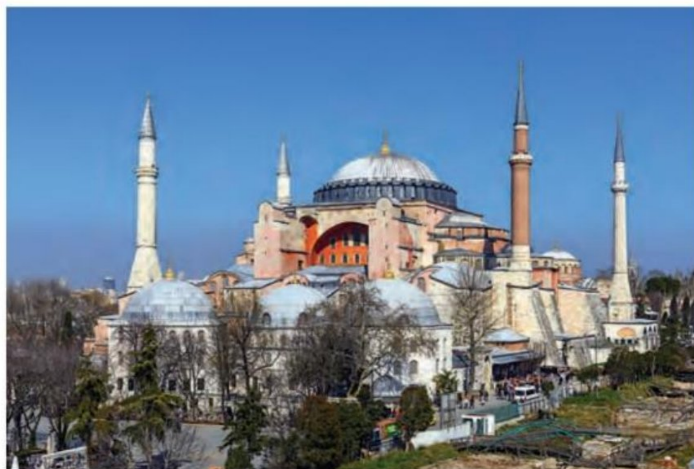
کلیسای ایاصوفیه، شاهکار معماری دوران بیزانس - استانبول

۲ (در قرن ۴م، امپراتوری روم بر اثر مشکلات اداری و ۴ (قسطنطنیه، پایتخت امپراتوری بیزانس، به سبب برخورداری اقتصادی به دو بخش شرقی و غربی تقسیم شد.) امپراتوری روم شرقی یا بیزانس که از اقتصاد و ارتش و به خصوص نیروی دریایی نسبتاً نیرومندی برخوردار بود، در برابر حملات پیاپی سپاهیان مسلمان، با وجود از دست دادن ۵ (امپراتوری روم شرقی، سرانجام با فتح قسطنطنیه (۴۵۳م/۸۵۷ق) توسط ترکان مسلمان عثمانی متلاشی شد.) ۵