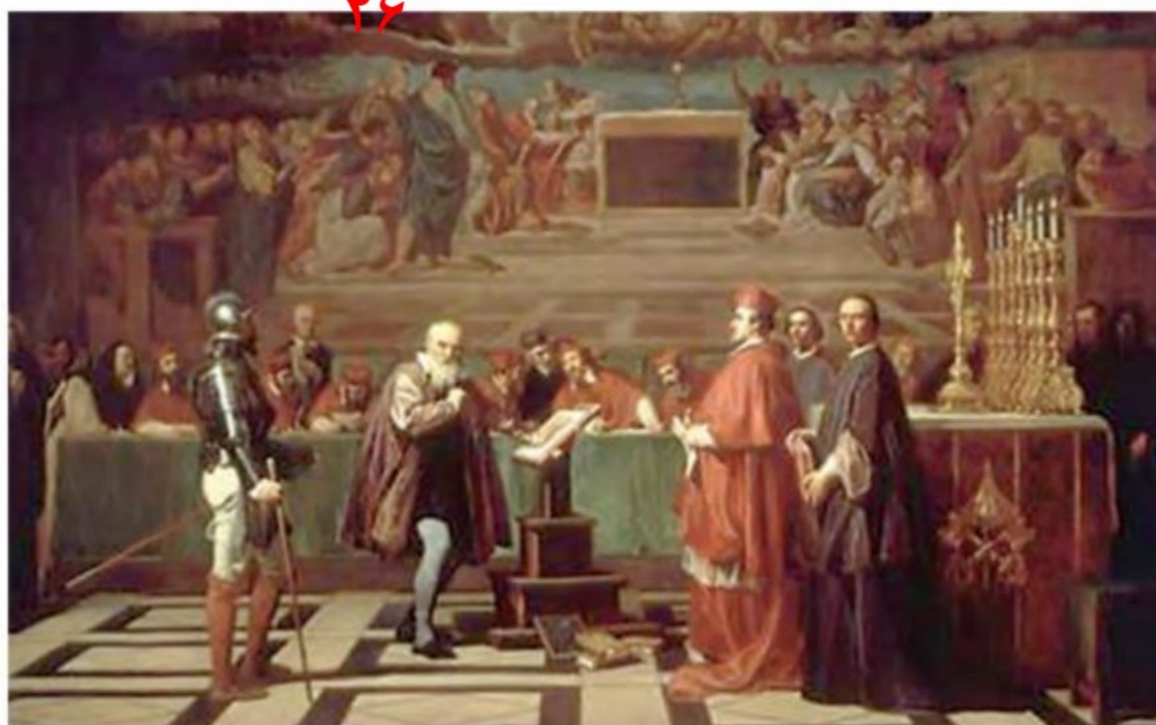
تابلوی گالیله در دادگاه تفتیش عقاید؛ او برای حفظ جان خود ناچار شد از عقاید علمی خود عقب نشینی نماید.

۲۶) کلیسا در قرون وسطا برای مقابله با بی دینی و بدعت گذاری ۱ و جلوگیری از اندیشه های مخالفان خود، از حربۀ تفتیش عقاید یا انکیزیسیون ۲ استفاده می کرد. متهمان به بی دینی و بدعت گذاری از کلیسا اخراج و به سختی مجازات می شدند. تبعید، مصادره دارایی، به چوب بستن و سوزاندن از جمله مجازات های این گونه متهمان بود. (۴ پرسش)