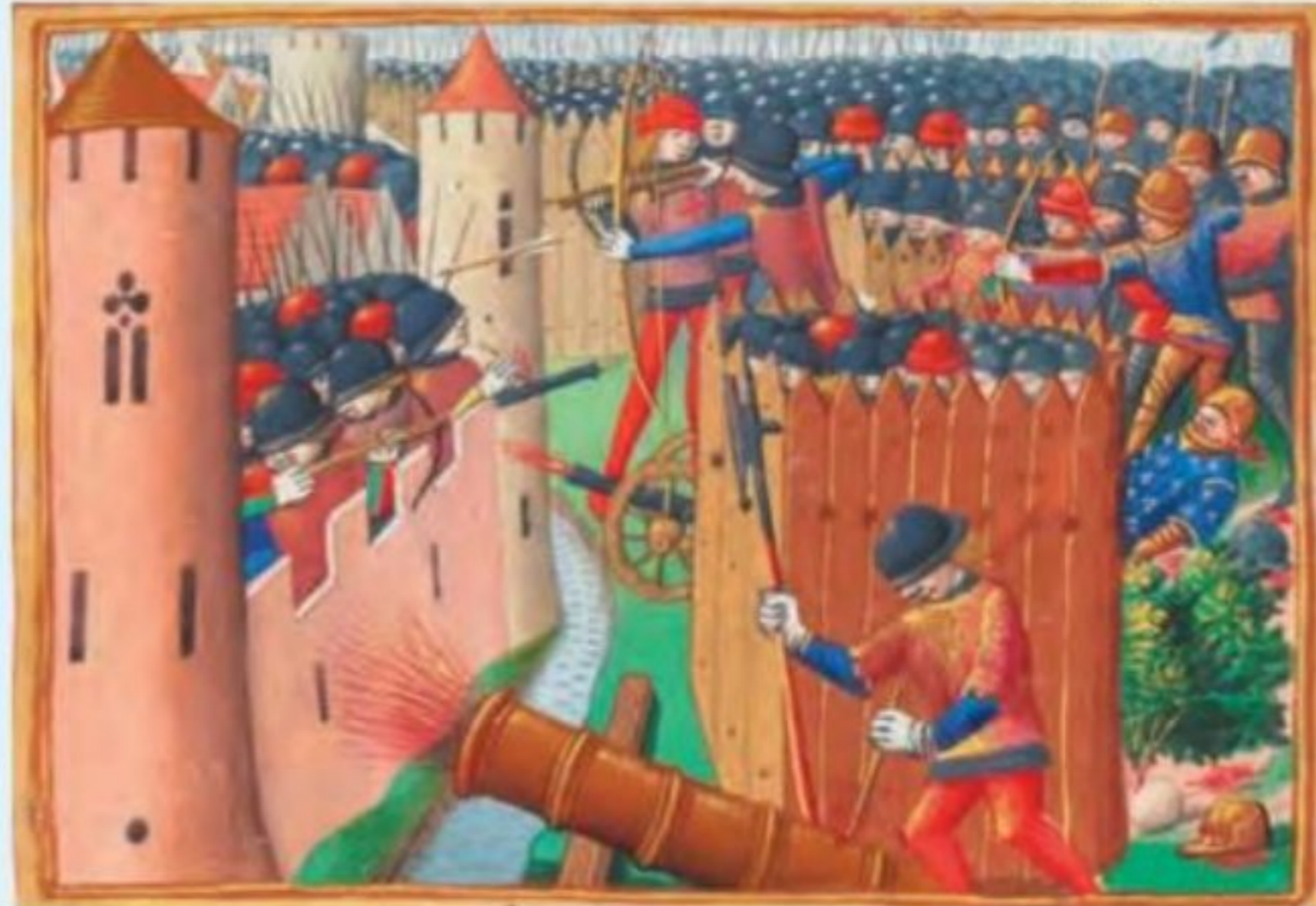
تابلوی جنگ های صدساله - محاصره اورلئان