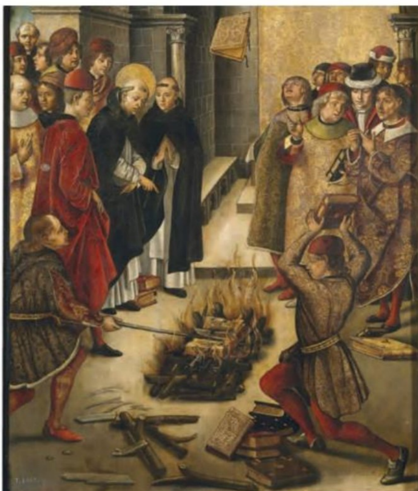
تابلوی قدیس سن دومینیک در حال نظارت بر سوزاندن کتاب های بدعت آمیز

خود تعلیم می دادند. آنان تفسیر کتاب مقدس را حق انحصاری خود می شمردند و اجازه نمی دادند که این کتاب جز به زبان لاتین به زبان های دیگری ترجمه و منتشر شود. کلیسا همچنین در قرون وسطا موفقیت زیادی در گسترش مسیحیت در میان ژرمن ها و سایر اقوام مهاجم به اروپا کسب کرد. علاوه بر اینها، کلیسا دارای املاک و زمین های بسیاری در سرتاسر اروپا و به خصوص ایتالیا بود.