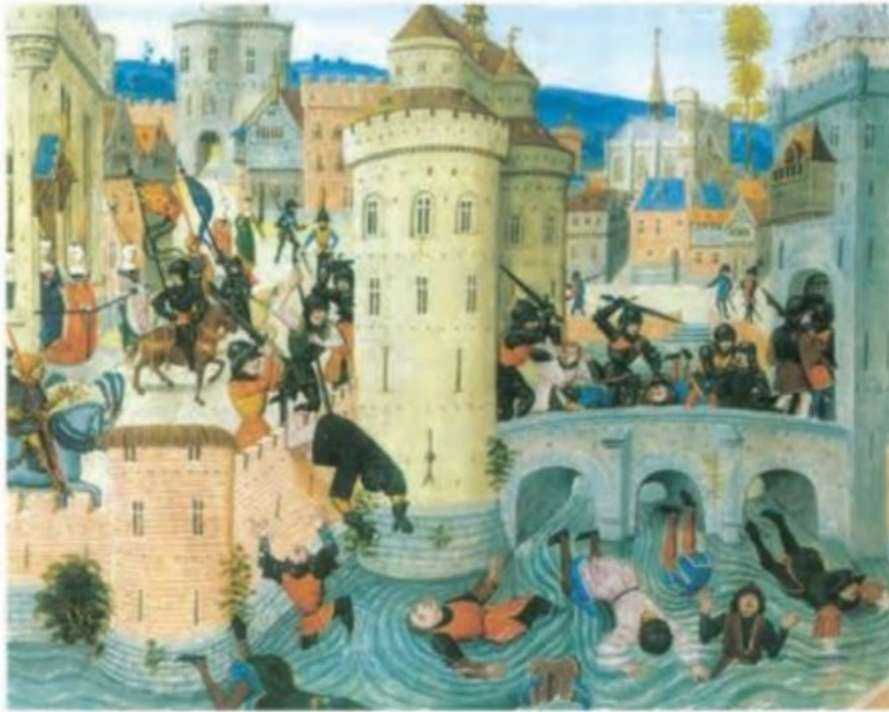
تابلوی سرکوب شورش کشاورزان توسط اربابان در قرن ۱۴م - انگلستان

وضعیت و موقعیت سرفها ۱۲ در قرون وسطا کار بر روی زمینهای اربابان (فئودالها) به عهدهٔ میلیونها کشاورز وابسته به زمین بود که به آنها سرف می گفتند ۱۳ گروهی از سرفها، کشاورزان آزادی بودند که به علت بدهکاری سرف شدند. همچنین عدهای از کشاورزان به خاطر ناامنی و هرج و مرج زمین خود را به فرد نیرومندی واگذار کردند و در عوض، از حمایت او برخوردار شدند. سرفها در پایینترین مرتبهٔ اجتماعی نظام فئودالی قرار داشتند. سرف اجازه نداشت که ملک ارباب خود را ترک کند، اما در عین حال مانند برده نیز نبود که قابل خرید و فروش باشد ۱۳