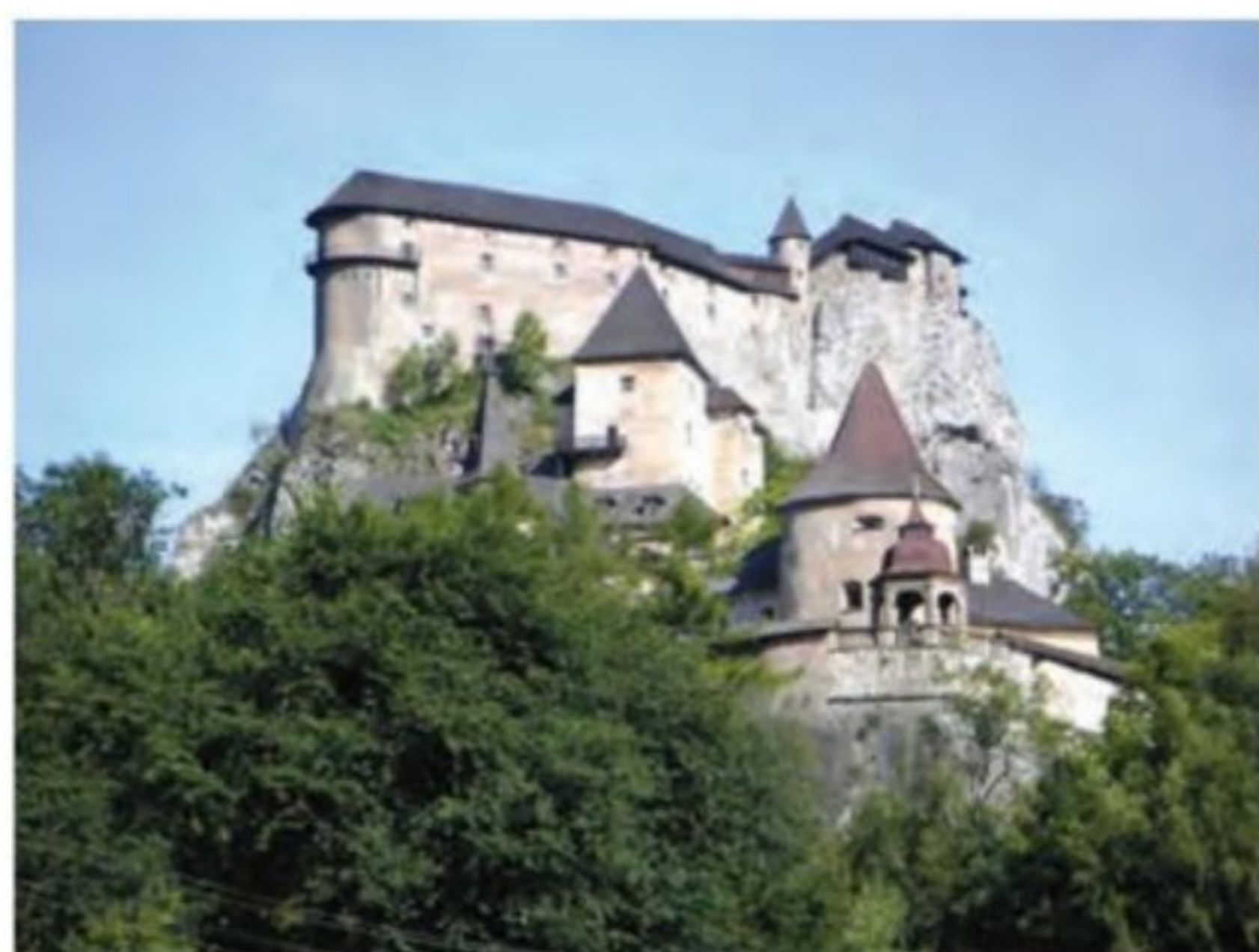
قلعه اوراوا - اسلواکی

املاک خود را در برابر دریافت خدمات نظامی و غیرنظامی به زبردستان و یا اشراف درجه دوم واگذار کنند. اشراف درجه دوم هم به نوبه خود همین کار را با زبردستان خود کردند و سلسله مراتبی از ارباب یا فئودال و باجگزار یا واسال ۹ به وجود آمد. (واسال به ارباب خود سوگند وفاداری یاد می کرد و موظف بود که هنگام جنگ او را یاری دهد، از کاخ و کوشک او حفاظت نماید و به او عوارض و مالیات پردازد.) ۹