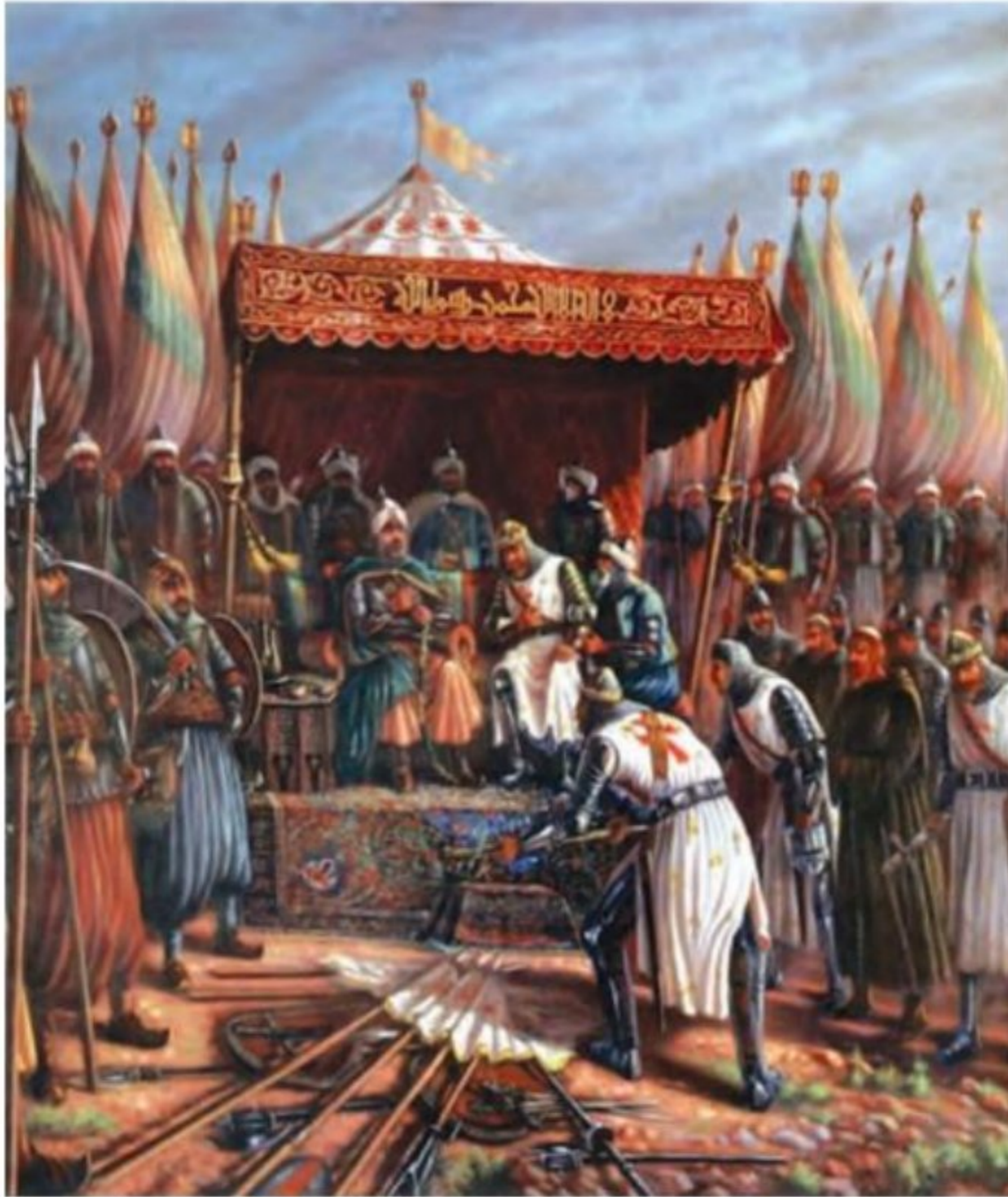
تابلوی فرمانده شکست خورده صلیبیون در برابر صلاح الدین

۲۱- جنگهای صلیبی چه پیامدهای برای سرزمین های اسلامی داشت؟