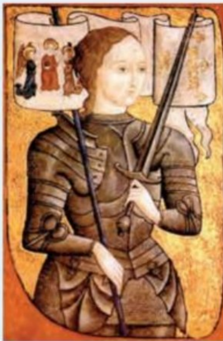
تابلوی ژاندارک قهرمان ملی فرانسه

جنگ های صدساله به اعتبار و اهمیت شوالیه ها در اروپا آسیب جدی وارد آورد؛ زیرا در طول این جنگ ها، روش های جنگ تغییر کرد. سواره نظام سنگین اسلحه یا شهبازان اهمیت خود را در جنگ ها از دست دادند و پیاده نظام مجهز به تفنگ و برخوردار از پشتیبانی توپخانه به نیروی کارآمد میدان نبرد تبدیل شد. استفاده از باروت که از چین به اروپا وارد شده بود، نقش زیادی در ساخت سلاح های آتشین (تفنگ و توپ) توسط اروپاییان داشت.