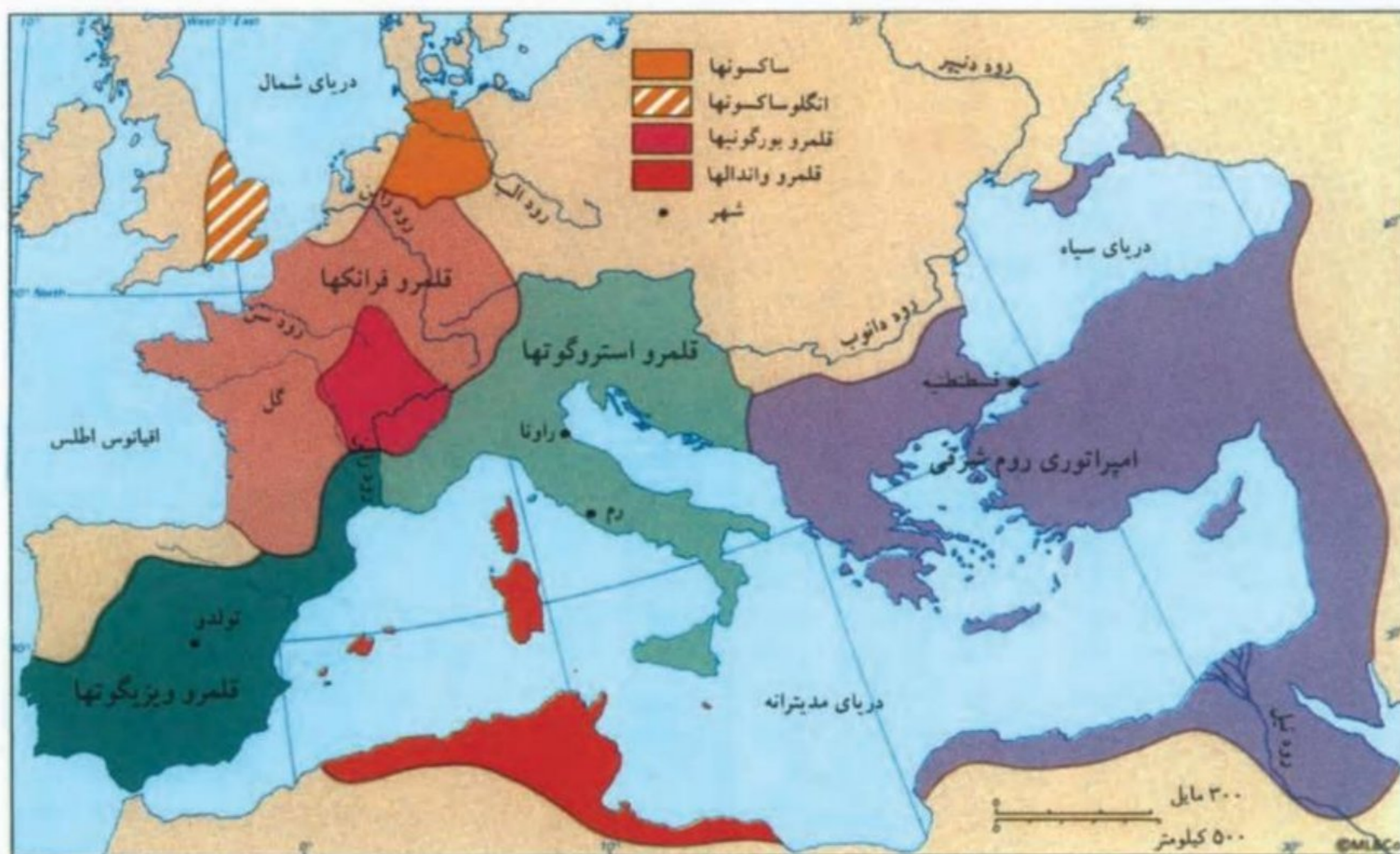
نقشه سیاسی اروپا در سال ۵۲۶ م