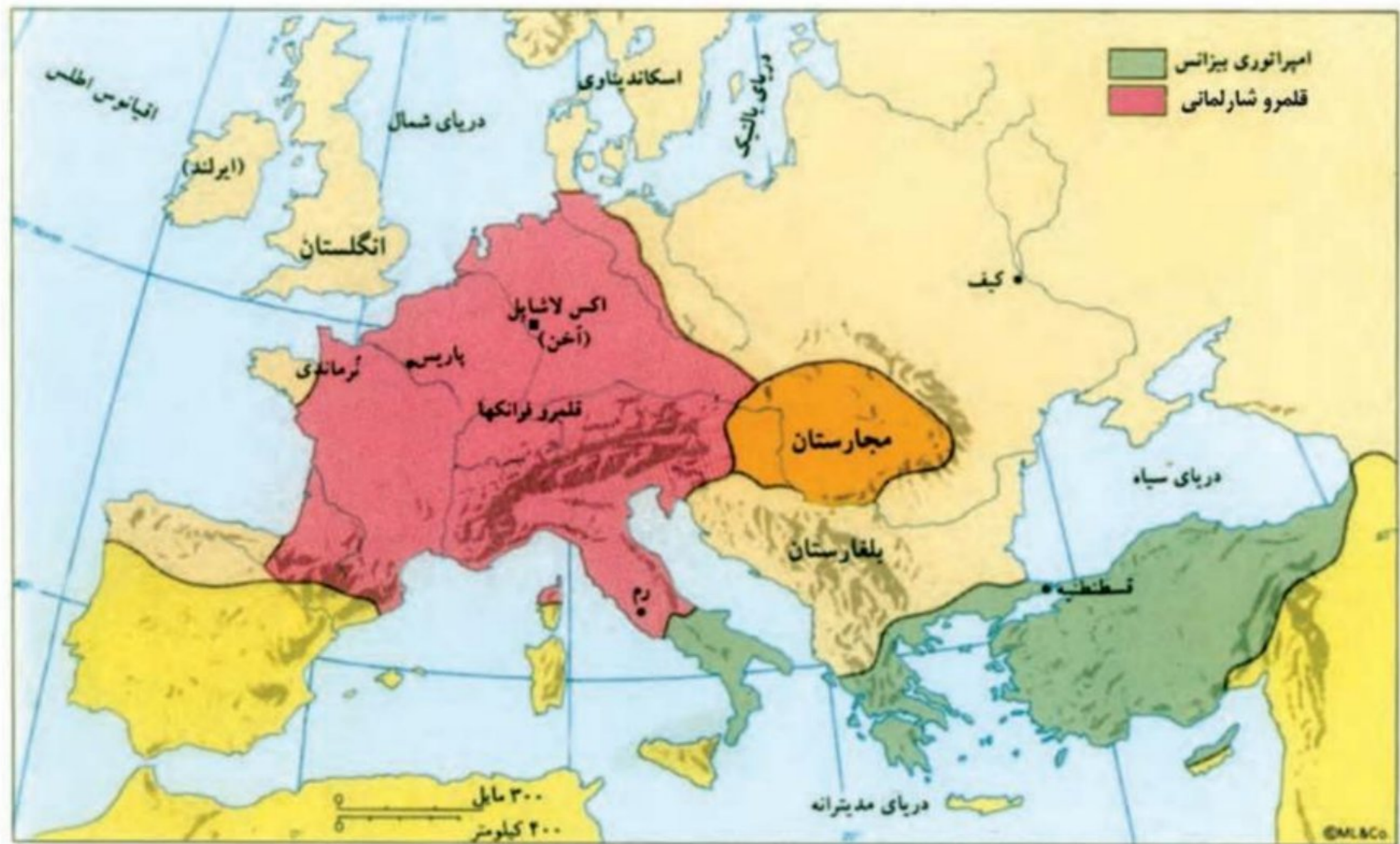
نقشه سیاسی اروپا در قرن ۸ م