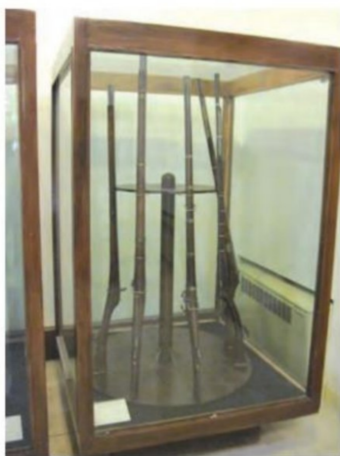
نمونه‌ای از سلاح‌های دوره صفوی