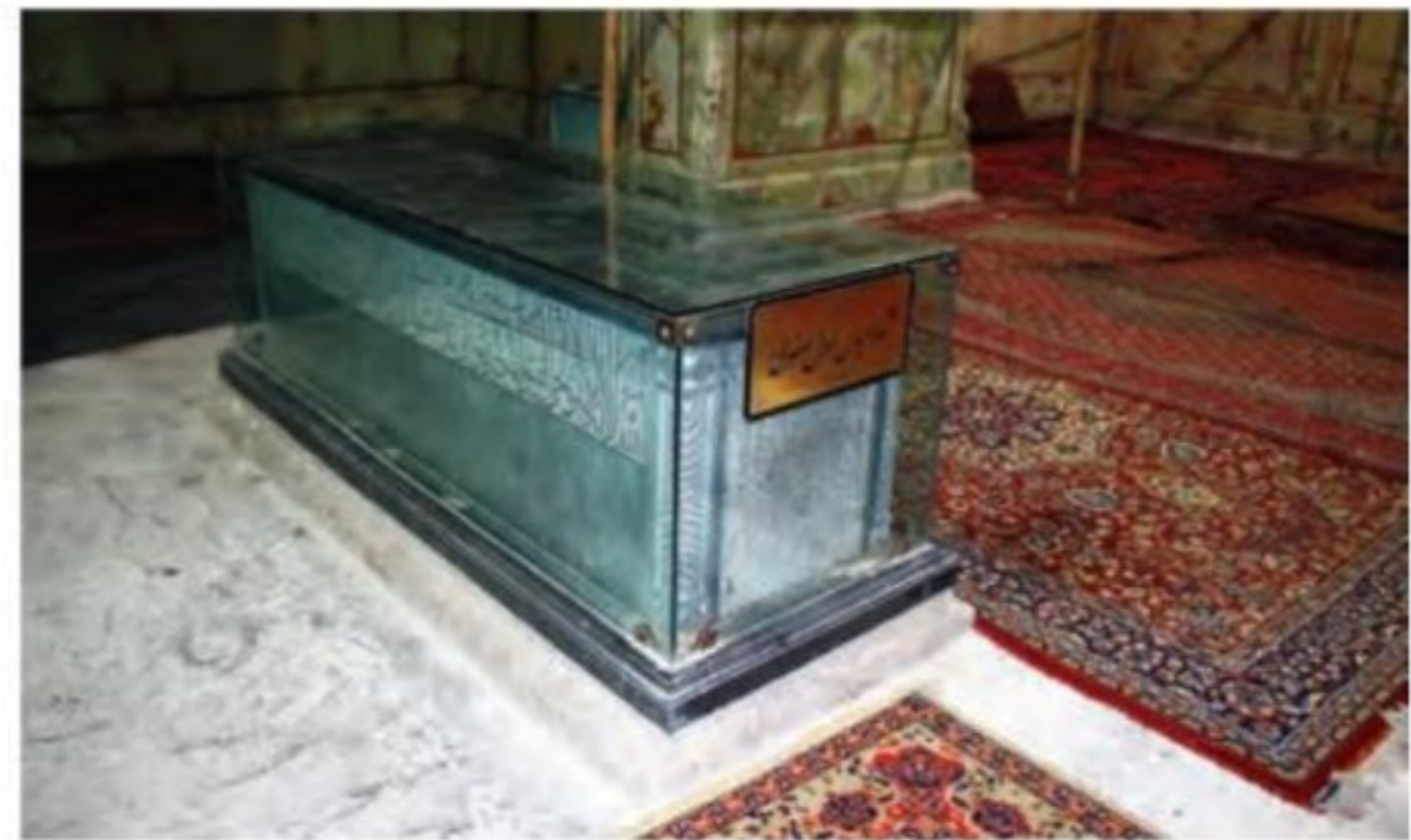
سنگ قبر منسوب به شاه عباس اول - آرامگاه حبیب بن موسی - کاشان

۳- توسعه اقتصادی، اجتماعی و فرهنگی ۱۷ : شاه عباس اول به منظور بهبود وضع مردم و رفاه و آسایش عمومی، اصلاحات زیادی انجام داد. انجام کارهای عمرانی بزرگ مانند ایجاد کارگاه‌های بافندگی، جاده‌سازی و ساخت بناهای مختلف از قبیل پل‌ها، مسجدها، کاروان‌سراها، مدرسه‌ها، سدها و قنات‌ها، گسترش مناسبات اقتصادی با کشورهای اروپایی و همسایگان و توسعه تجارت خارجی از جمله این اقدامات بودند. (۱۷)