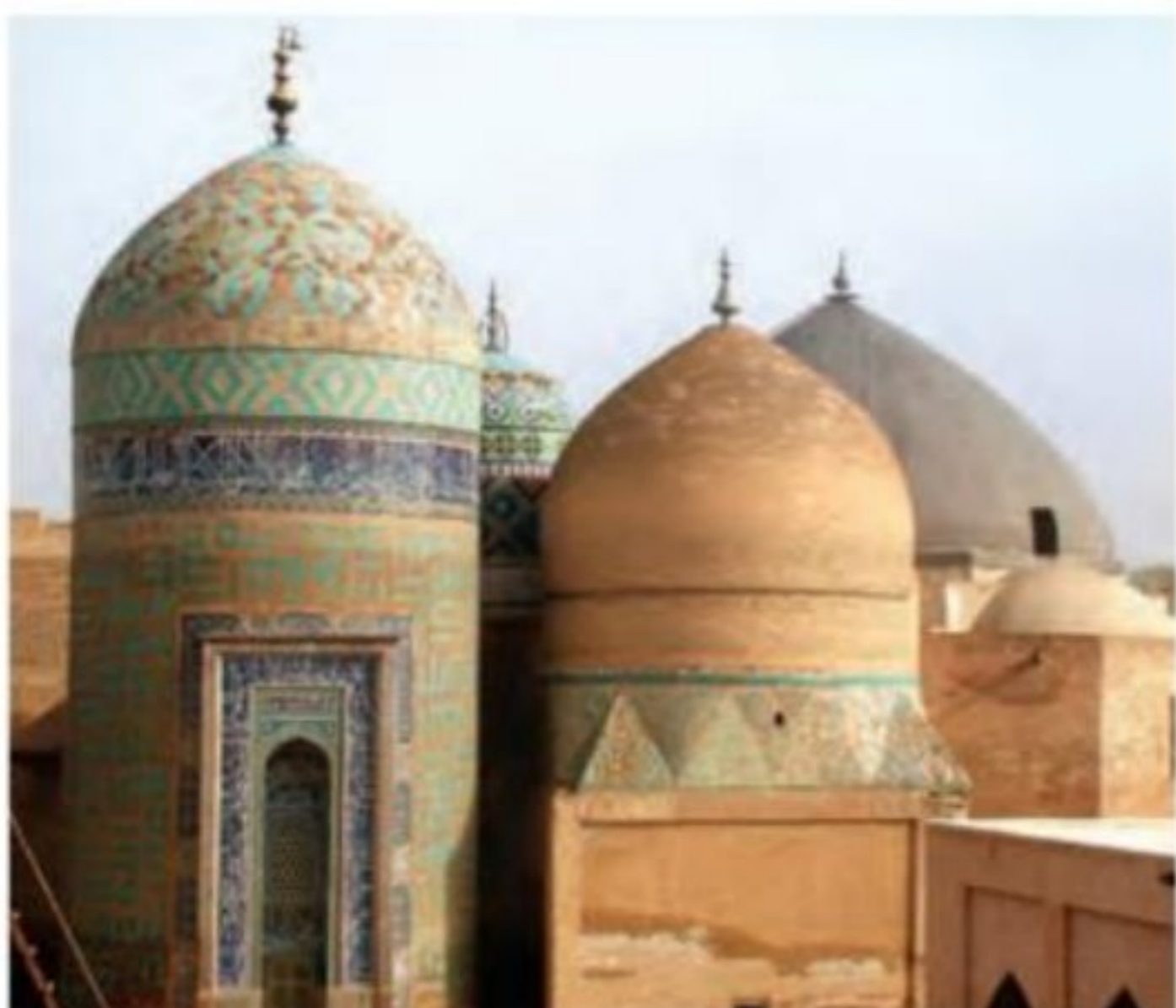
بقعه شیخ صفی‌الدین اردبیلی - اردبیل مشایخ طریقت صفوی از آغاز تا تشکیل حکومت