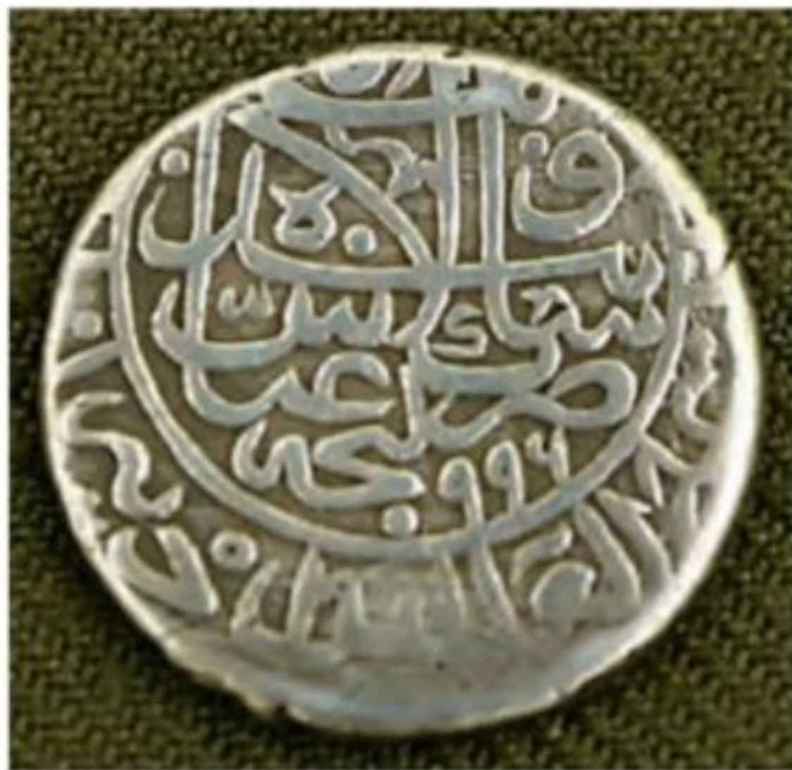
سکه ضرب شده به نام شاه عباس اول

۴- انتقال پایتخت از قزوین به اصفهان ۱۸ ! شاه عباس اول به دلایل سیاسی، نظامی و اقتصادی، پایتخت را از قزوین به اصفهان منتقل کرد و با استفاده از اصول مهندسی و شهرسازی، این شهر را به یکی از زیباترین و آبادترین شهرهای جهان تبدیل کرد. افزون بر این، وی گروهی از آرامنه را در اصفهان مستقر کرد و از دانش‌ها و تجارب فنی، اقتصادی و تجاری آنها به نفع کشور بهره برد ۱۸