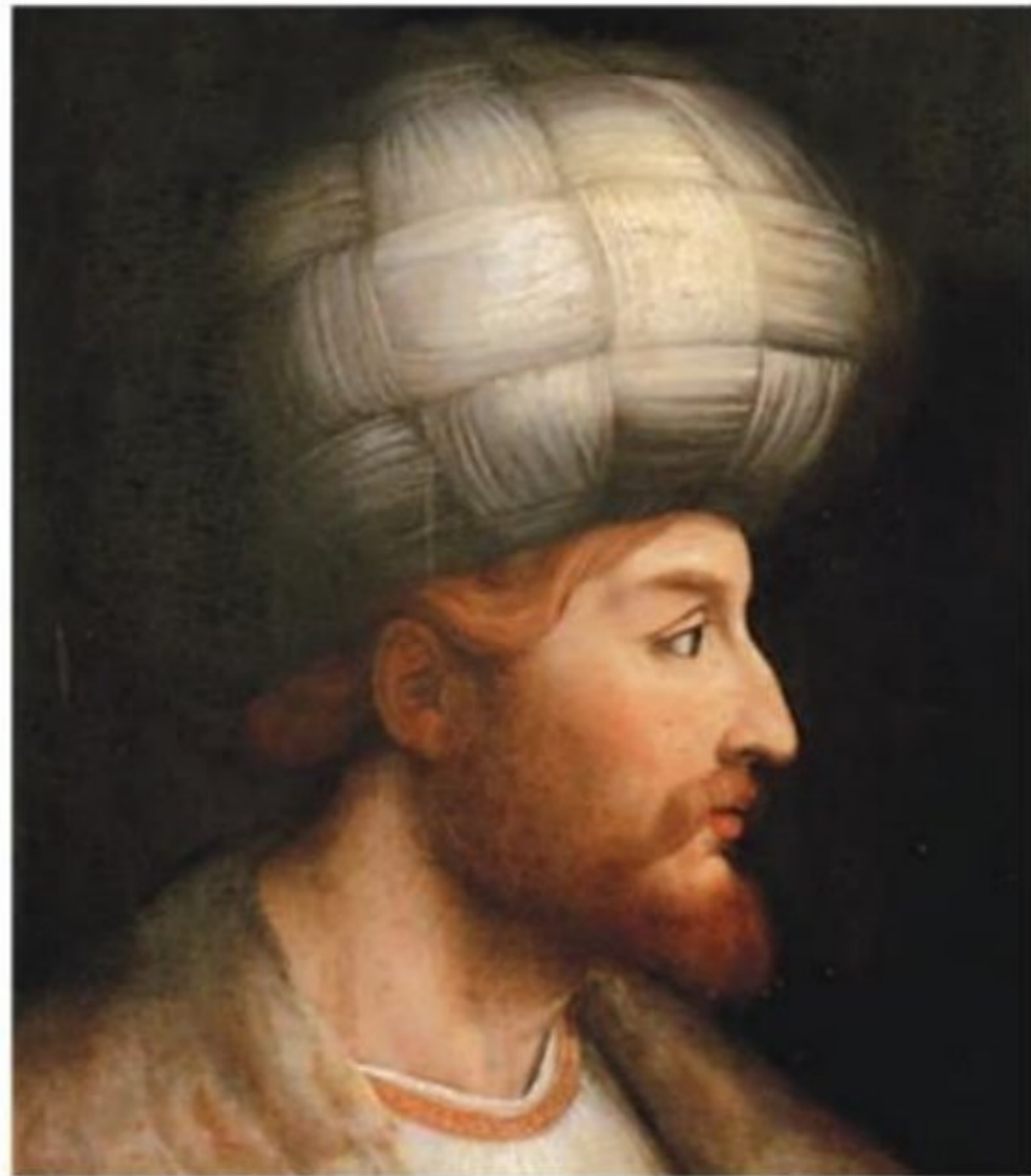
شاه اسماعیل اول

۶) مهم‌ترین اقدام شاه اسماعیل صفوی، پس از نشستن بر تخت شاهی، رسمی کردن مذهب شیعه دوازده امامی بود. این اقدام دو پیامد مهم داشت: نخست، اینکه بسیاری از شیعیان در