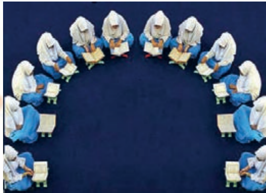
انس با قرآن کریم در کشور مالزی