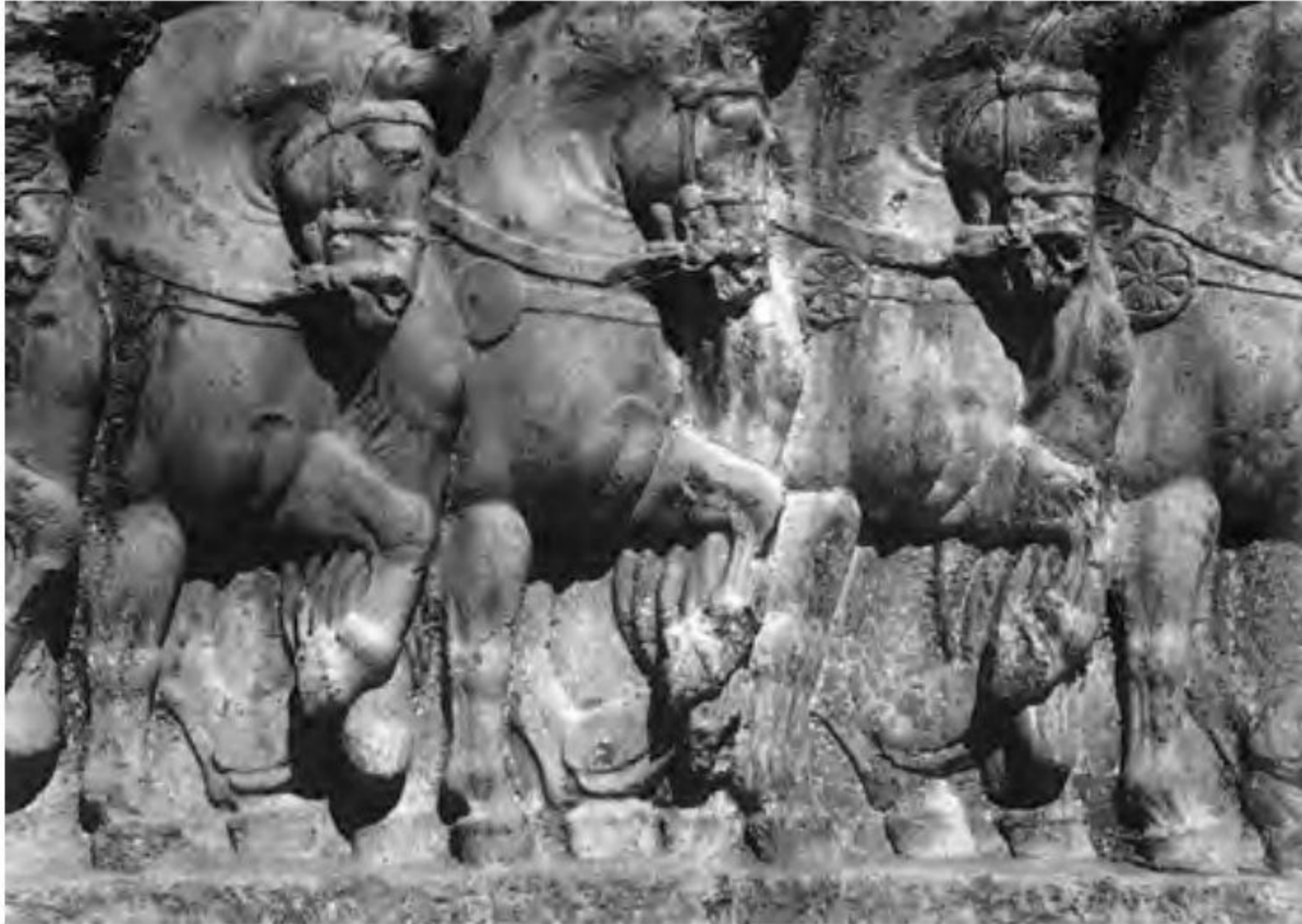
○ سنگ نگاره سواره نظام ساسانی - بیشاپور، استان فارس

1) در دوران ساسانی، مدارس به نام ارتشتارستان وجود داشت که افراد ارتش در آنجا آموزش می‌دیدند (1) برخی شواهد نشان می‌دهد که در آن زمان، کتابچه‌هایی با موضوع‌های تخصصی درباره آموزش‌های نظامی از قبیل تشکیلات قشون، فنون جنگ، تیراندازی با کمان، تغذیه سپاهیان و مراقبت از اسبان وجود داشته که مربیان از آنها برای آموزش سربازان استفاده می‌کرده‌اند.