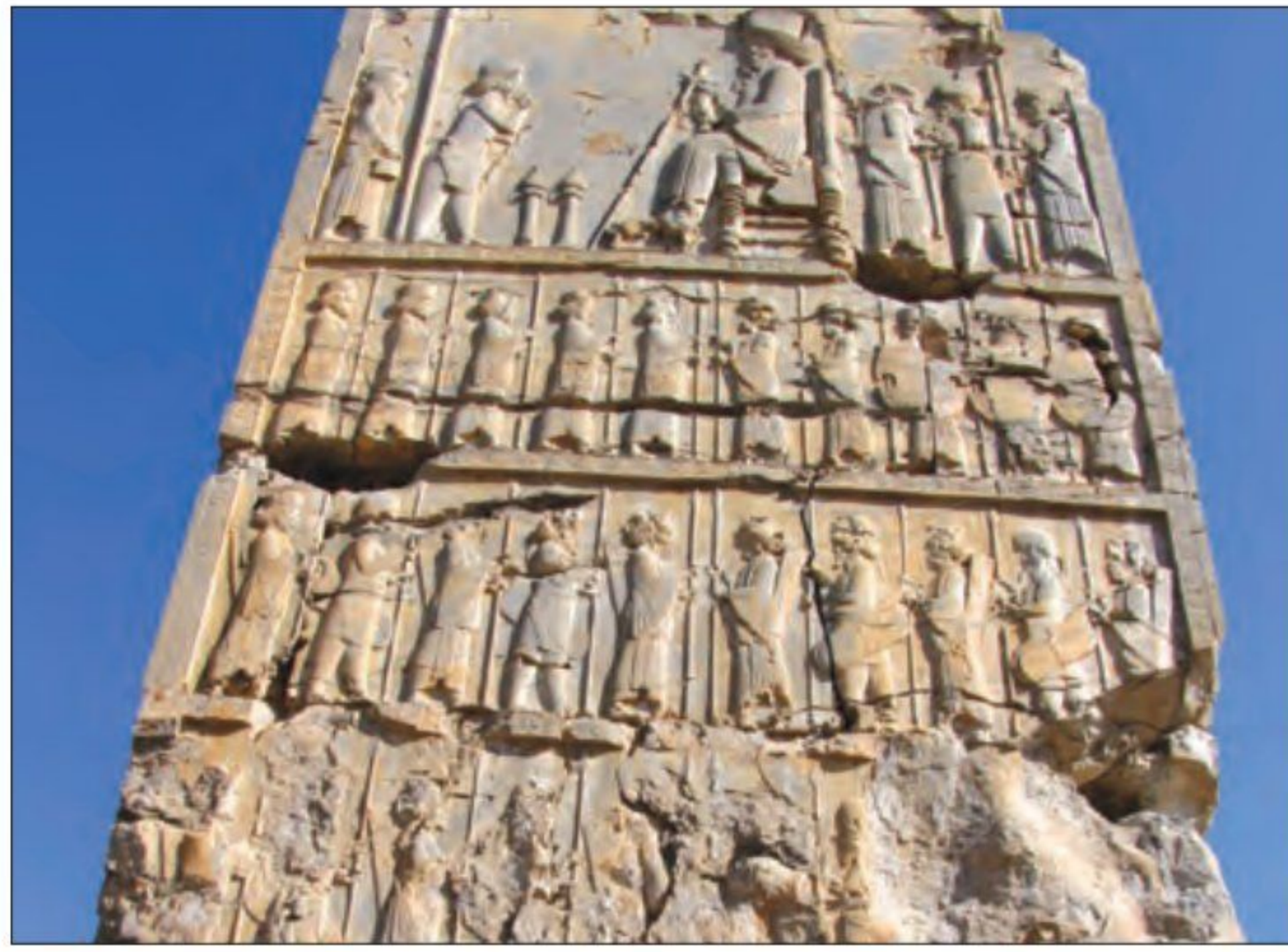
○ سنگ‌نگاره داریوش یکم و درباریان - تخت جمشید

در این درس، شما با استفاده از شواهد و مدارک معتبر تاریخی و باستان‌شناختی، نظام حکومتی ایران باستان را مطالعه و بررسی کرده، شیوه‌های مدیریتی، تشکیلات اداری و نظامی آن دوره و کارکرد آنها را ارزیابی می کنید.