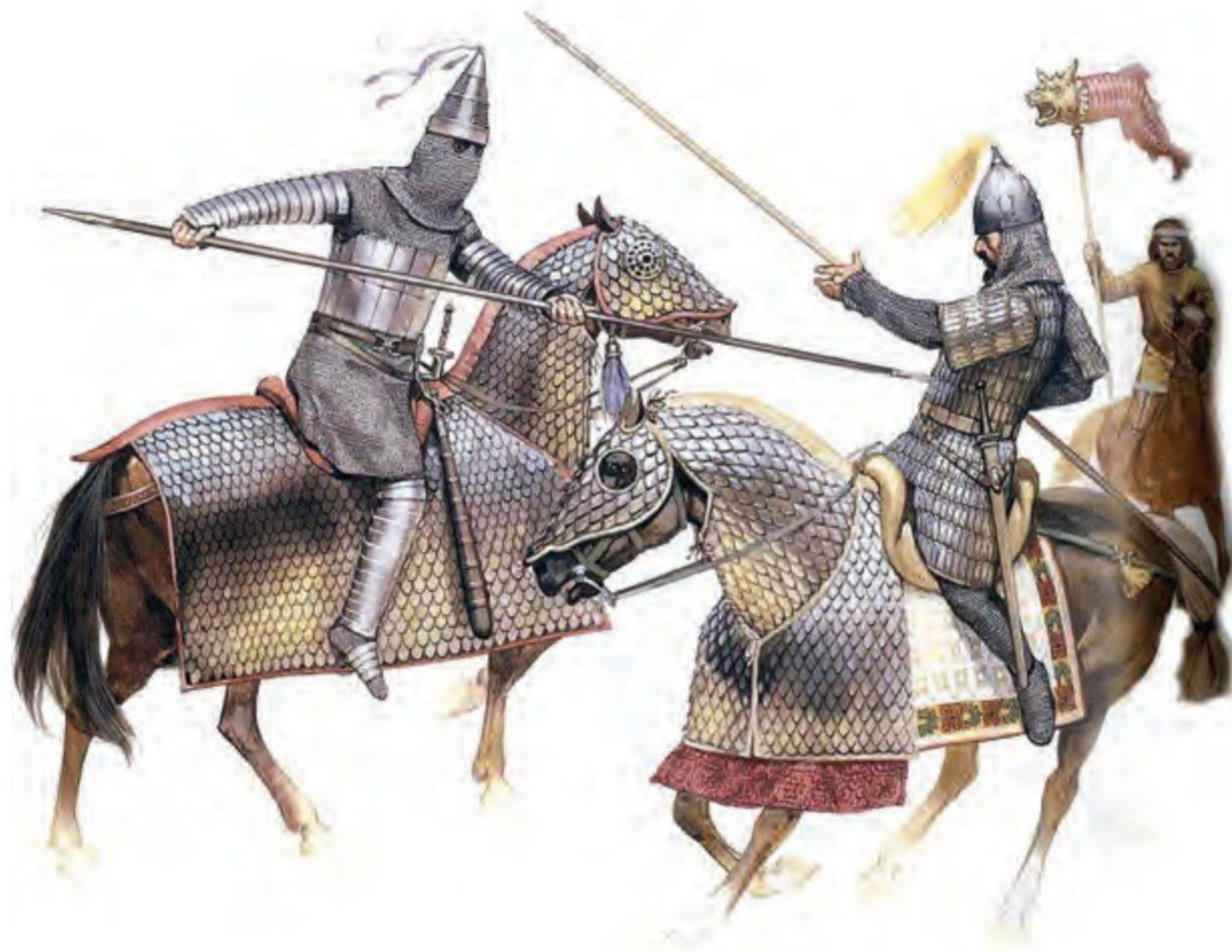
● سواره نظام سنگین اسلحه اشکانی

سپاه، تیر و کمان و نیزه بود. دلیل توانمندی سواره نظام اشکانی، پیشینه صحرانوردی‌شان بود که به آنان توانایی جنگیدن و تحمل مشقت را داده بود. اشکانیان به تدریج، سواره نظام دارای سلاح سنگین نیز تشکیل دادند که مجهز به زره و کلاه خود بود. استفاده از صدای طبل نیز در آغاز حملات سپاه اشکانی معمولاً وحشت بسیاری در لشکر دشمن ایجاد می‌کرد و نظم آنها