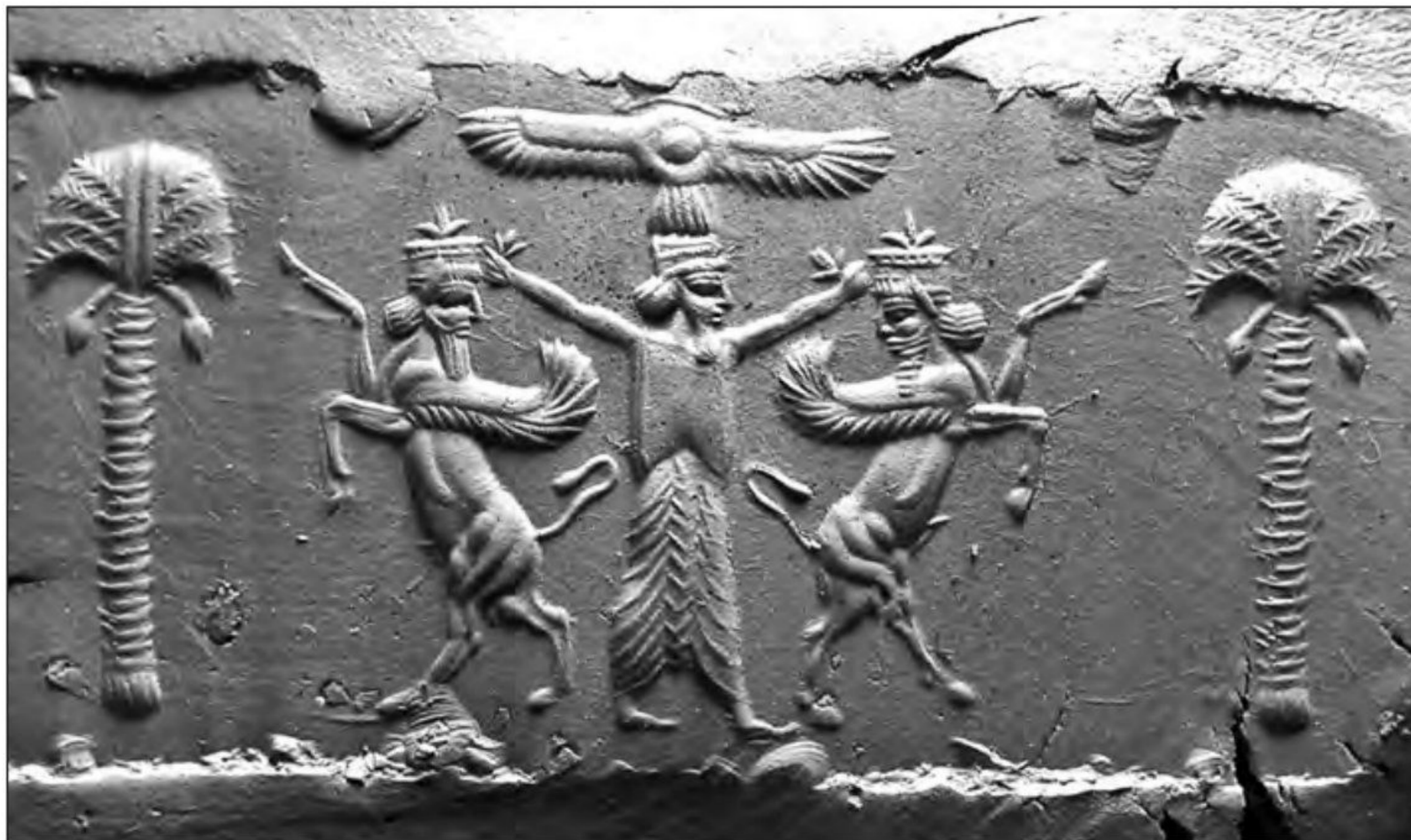
● مهر دوره هخامنشی؛ نامه های اداری هخامنشیان به خط و زبان آرامی نگارش یافته و مهر می شد. منصب مَهر داری، یکی از مناصب دیوان شاهی بود.

خود، نظام اداری منظم و کارآمدی را پدید آورد. از این رو،