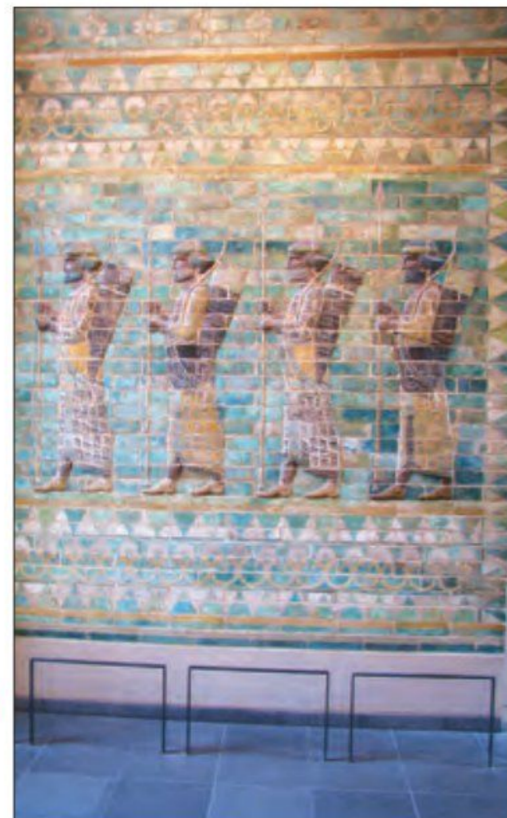
● نگاره کمان داران هخامنشی - کاخ آپادانای شوش

در سپاه هخامنشی سواره نظام جایگاه مهمی داشت. سلاح اصلی آن نیزه بود. پس از سواره نظام، خیل عظیم پیاده نظام بود. در ارتش هخامنشی به جز پارسی ها، دیگر اقوام ایرانی و غیرایرانی نیز حضور داشتند. هر یک از این اقوام، لباس جنگی و جنگ افزارهای مخصوص خود را داشتند.