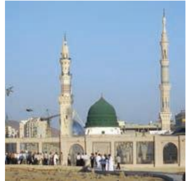
مسجد النبی، نمای بیرونی

زمان زیادی از شب گذشته بود اما بچه ها همچنان با اشتیاق به حرفهای پدر و مادرشان گوش می دادند. مادر به آن ها گفت: «بچه ها، خیلی از وقت خوابتان گذشته است».