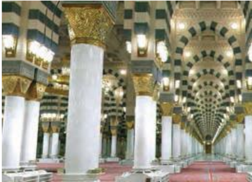
مسجد النبی، نمای داخلی