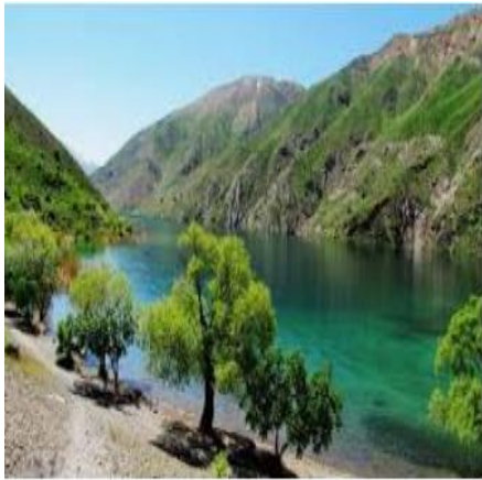
دریاچه کهر (دورود)