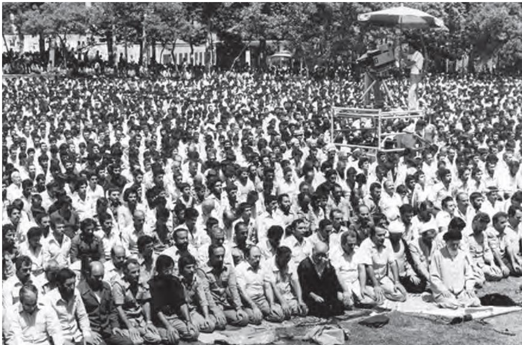
اقامة نخستين نماز جمعه تهران به امامت آيت الله طالقاني در دانشگاه تهران