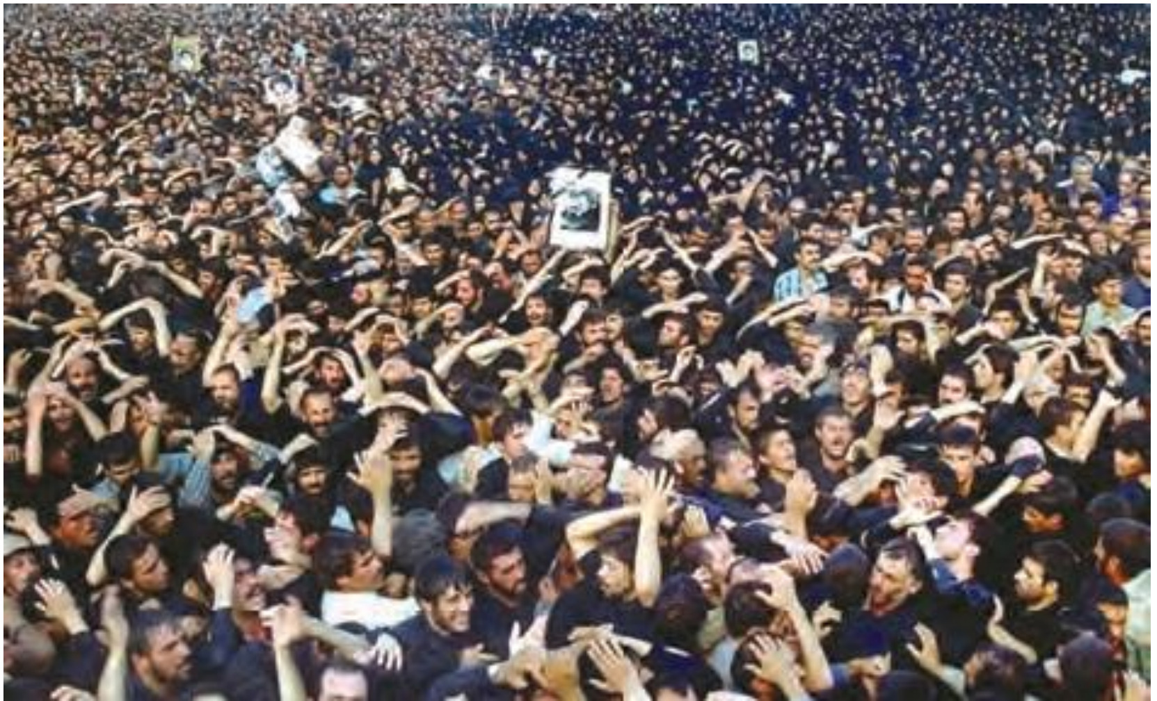
نمایی از تشییع جنازه میلیونی امام خمینی