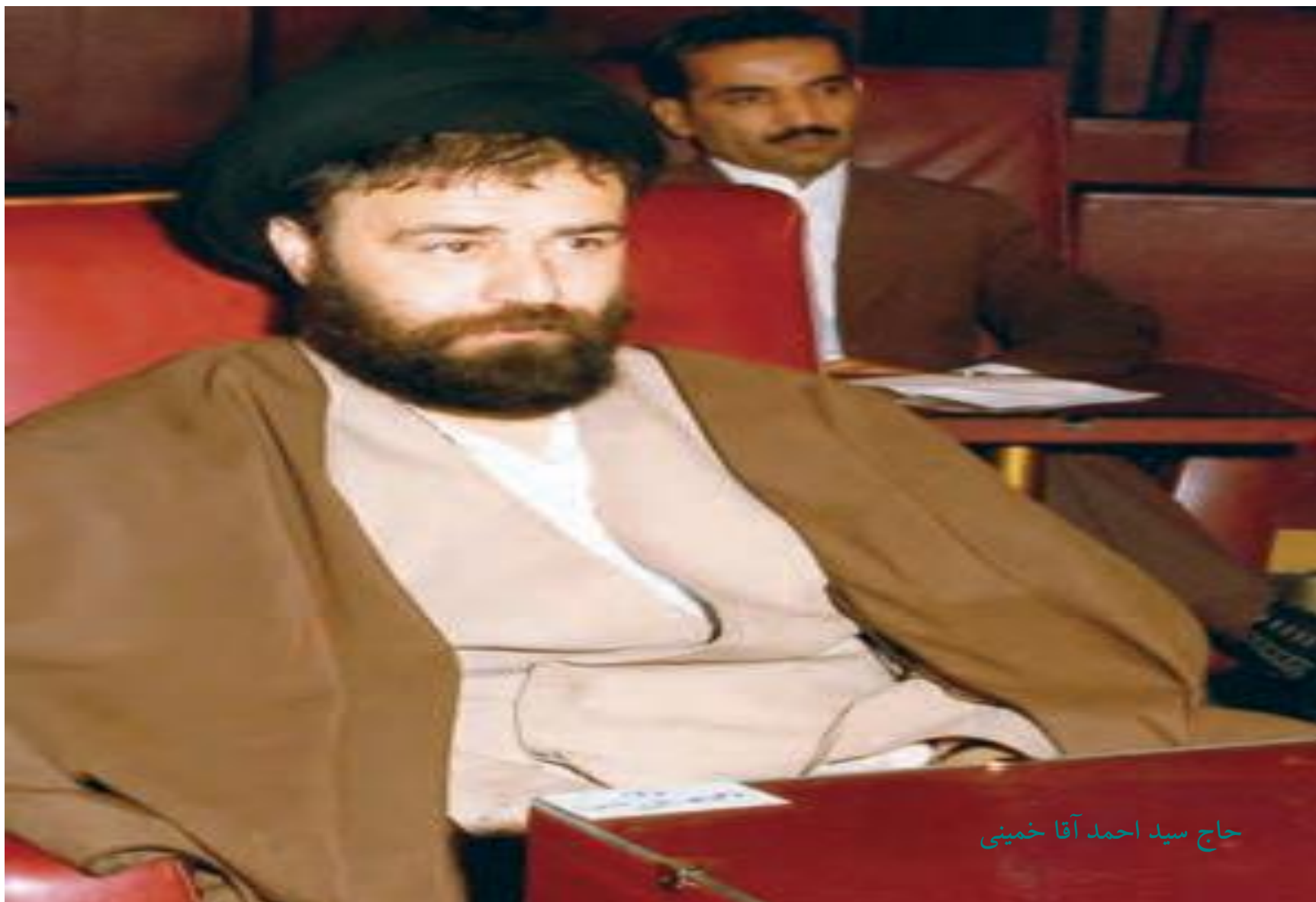
حاج سيد احمد آقا خميني