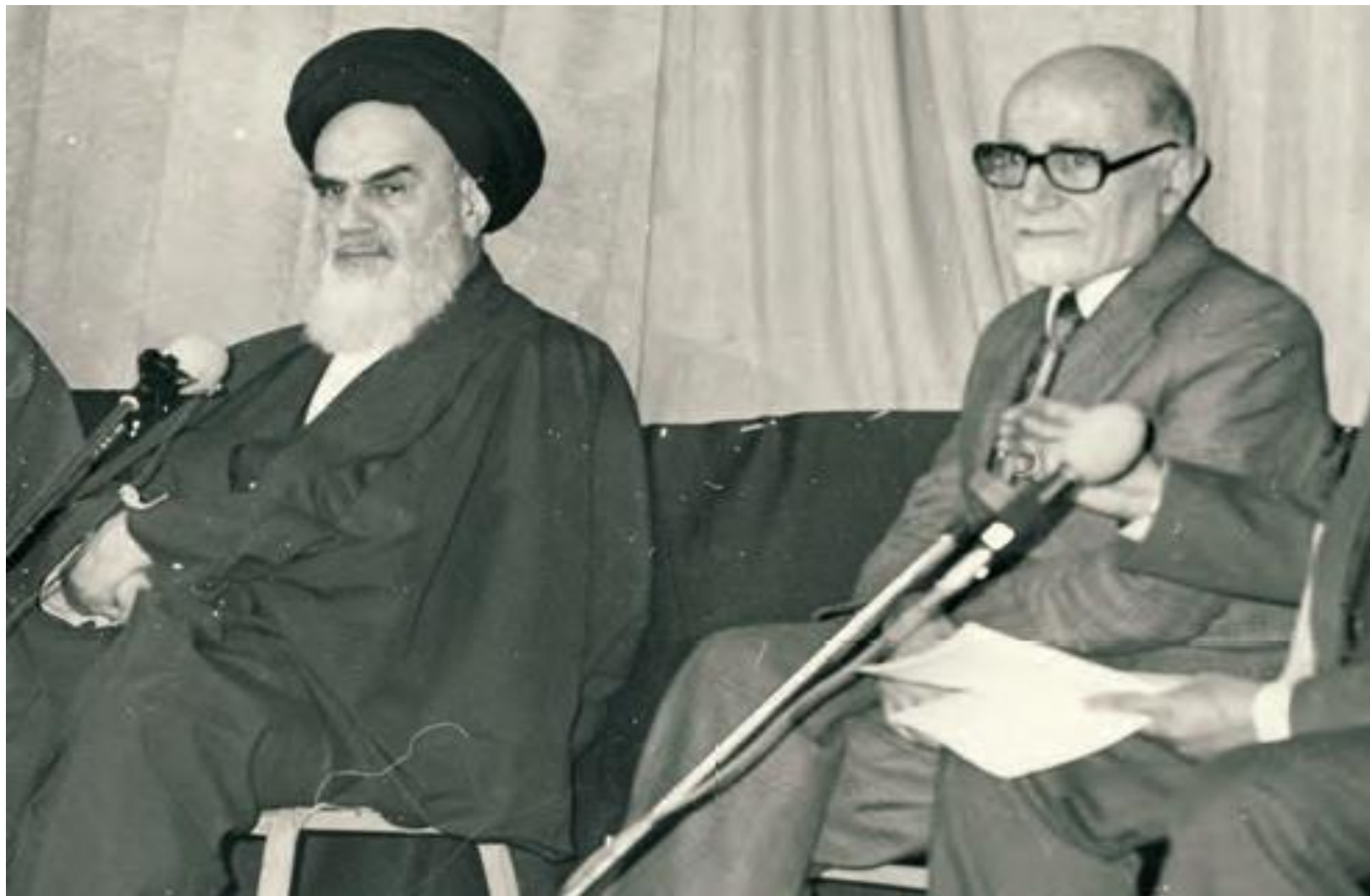
مهندس مهدی بازرگان، رئیس دولت موقت انقلاب، در کنار امام خمینی(ره)