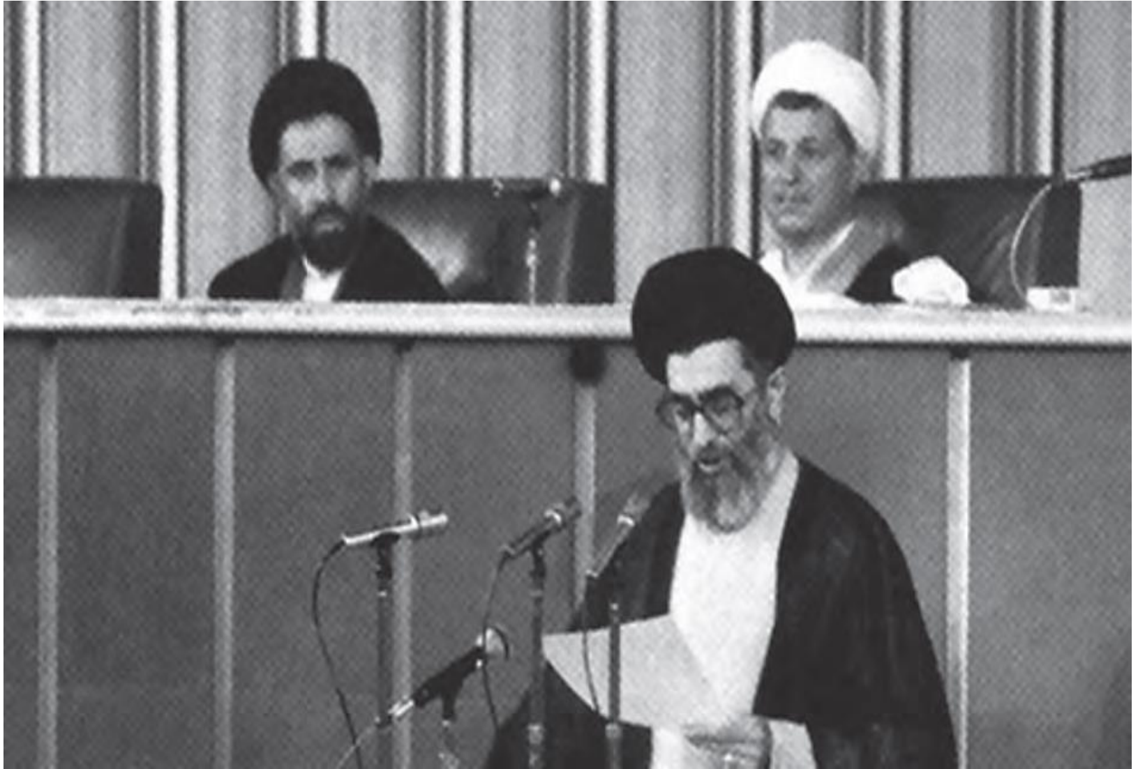
خامنه ای هنگام خواندن وصیت نامه حضرت امام در مجلس خبرگان