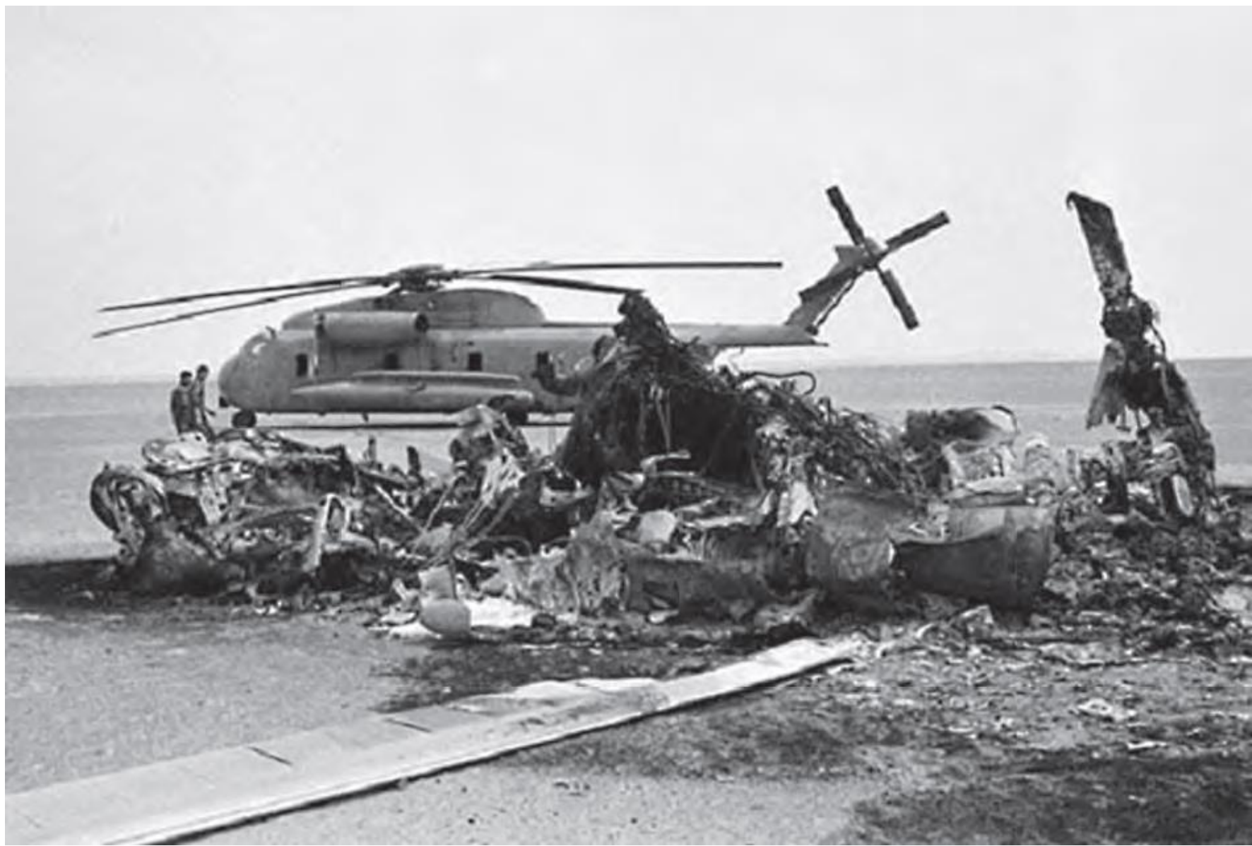
بقایای لاشه هواپیماها و بالگردهای آمریکایی در طبس