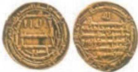
ضرب سمرقند سال ۲۰۲ ق