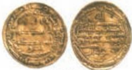
ضرب محمدیه‌آری سال ۲۰۲ ق