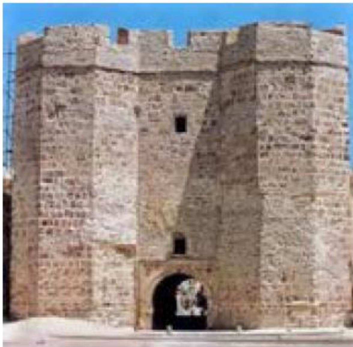
بقایای دروازه مهدیه نخستین پایتخت فاطمیان در تونس امروزی