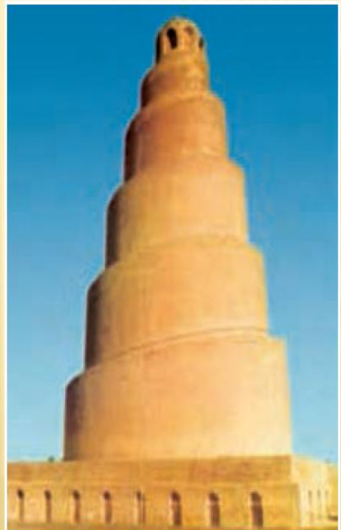
برج ملویه سامرا از آثار معماری دوران خلافت عباسی

سکه‌هایی که در زمان ولایتعهدی امام رضا علیه السلام به نام ایشان در شهرهای معتلف ضرب شده است.