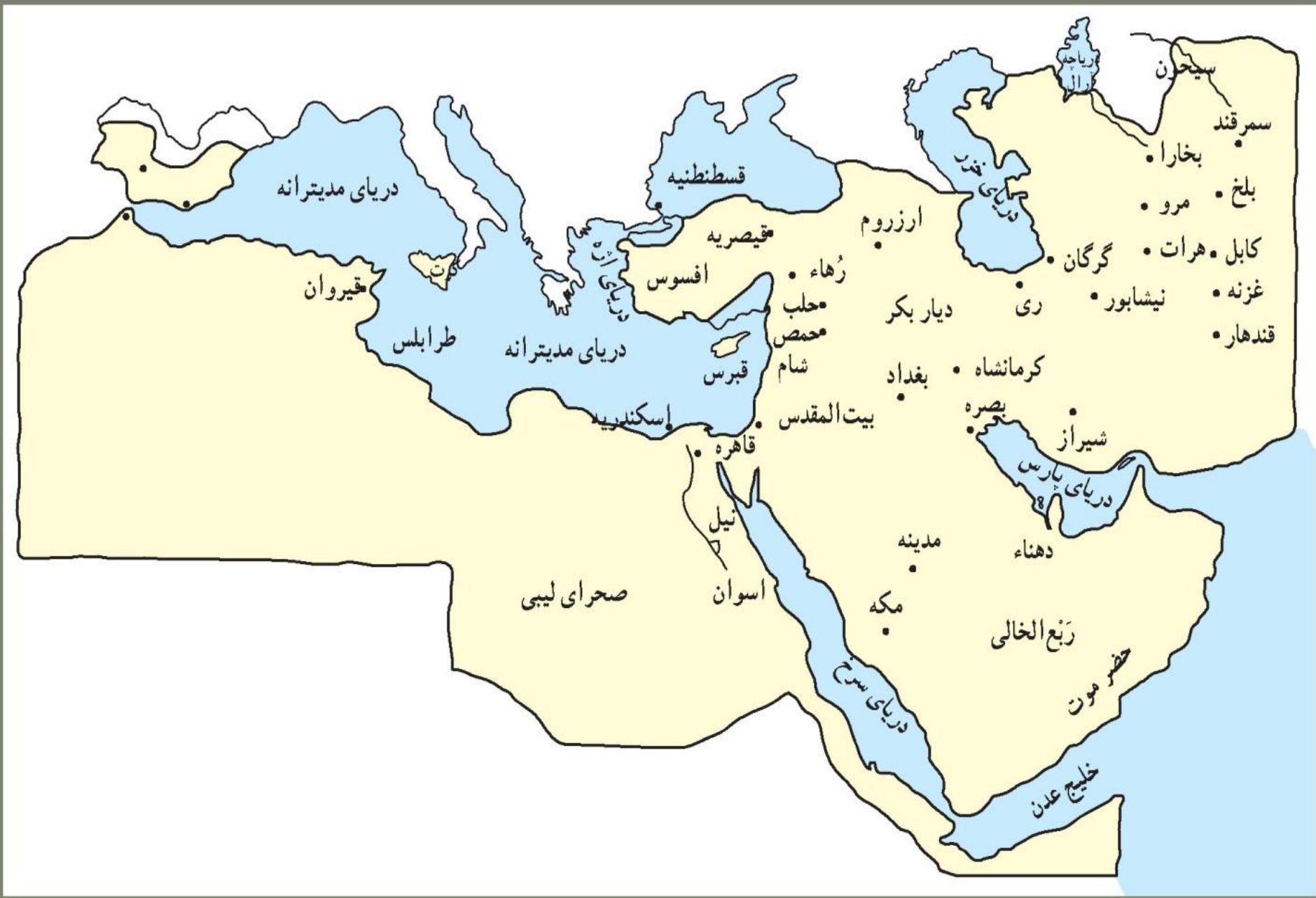
قلمرو مسلمانان در دوره بنی عباس