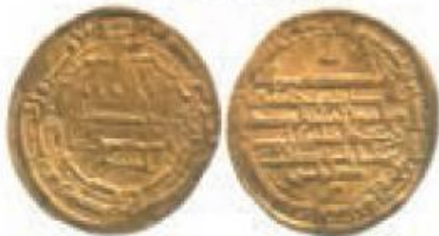
ضرب اصفهان سال ۲۰۴ ق

سکه‌هایی که در زمان ولایتعهدی امام رضا علیه السلام به نام ایشان در شهرهای معتلف ضرب شده است.