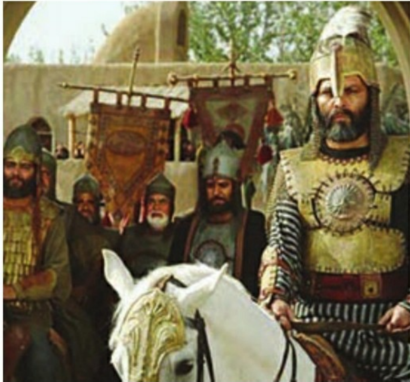
○ صحنه ای از مجموعهٔ تلویزیونی تاریخی به نام مختارنامه؛ آیا شما این مجموعه را دیده اید؟

منصور عباسی ناجوانمردانه ابو مسلم خراسانی را به قتل رساند. ۹)