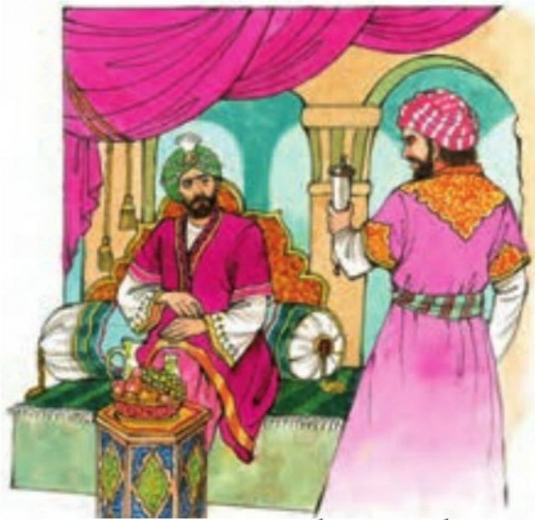
○ جعفر برمکی پسر یحیی برمکی

برمکیان نیز که از خاندان‌های مشهور ایرانی بودند، به سرنوشت ابومسلم دچار شدند. (این خاندان در زمان خلافت هارون، عهده‌دار وزارت و حکومت ولایات شدند و نفوذ و قدرت فراوان کسب کردند. خلیفه ناگهان بر آنان خشم گرفت و دستور داد آنها را از قدرت برکنار و زندانی کنند و به قتل برسانند.) ۱۰