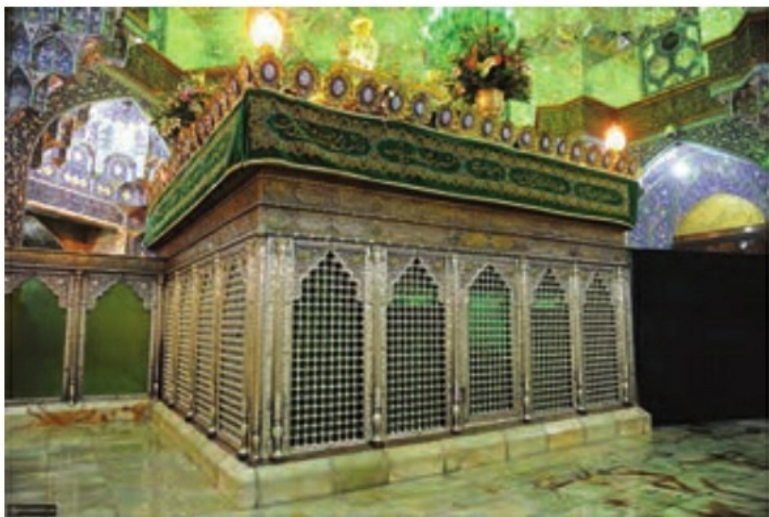
○ ضریح حرم حضرت معصومه (علیها السلام)

۱۵- دلایل گرایش ایرانیان به دین اسلام چه بود؟ ۲ مورد