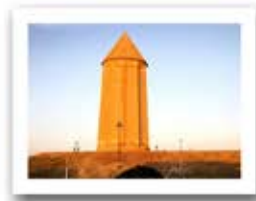
گنبد قابوس استان گلستان