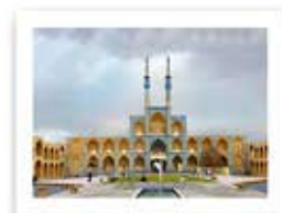
امیر چقماق استان یزد