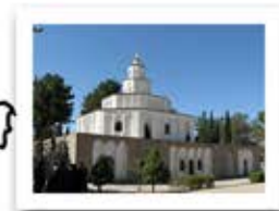
ارگ کلاه فرنگی استان خراسان جنوبی