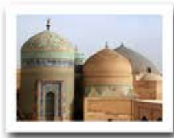
بقعه شیخ صفی الدین استان اردبیل