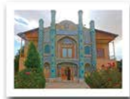
آینه خانه مفخم استان خراسان شمالی