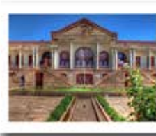
موزه قاجار استان آذربایجان شرقی