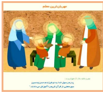
داستان تصویر صفحه‌ی ۴۴ جهت راهنمایی اولیا

فرزندم؛ به تصویر رو به رو با دقت نگاه کن و داستان آن را برای بزرگ‌ترها تعریف کن.