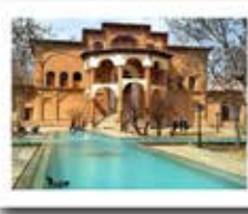
عمارت خسروآباد استان کردستان