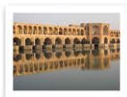
سی و سه پل استان اصفهان