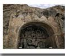
طاق بستان استان کرمانشاه