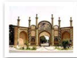
دروازه ارگ استان سمنان