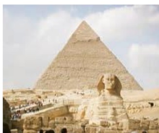
اهرام مصر و مجسمه ابوالهول