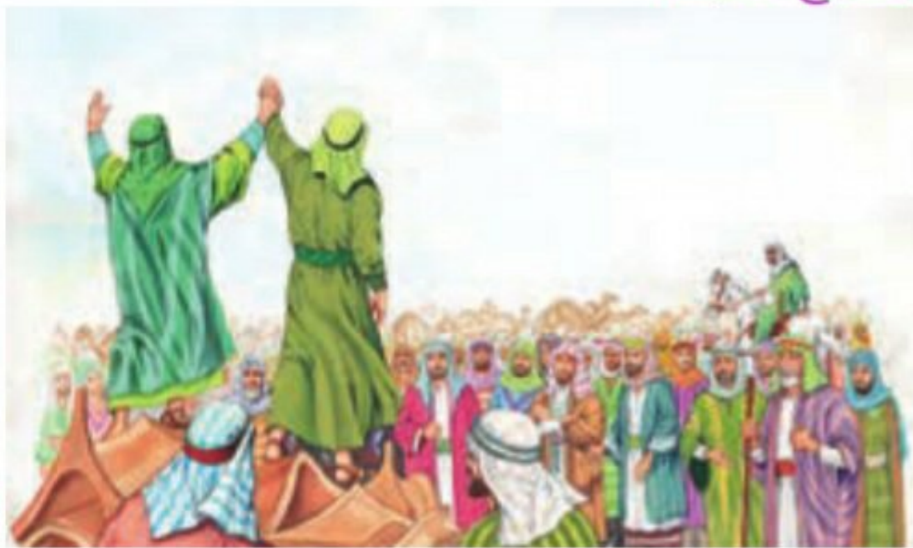
○ اجتماع غدیر خم

● واقعه غدیر اُحْم : رسول گرامی اسلام هنگامی که از آخرین سفر حج باز می‌گشت، دستور داد تا همه زائران خانه خدا در محلی به نام غدیر خم توقف کنند. آن حضرت سپس برای جمعیت حاضر خطبه‌ای طولانی خواند و از آنان پرسید: «چه کسی نسبت به مؤمنان در تصمیم‌گیری از خودشان برتر و اولی‌تر است؟»؛ مسلمانان یک‌صدا گفتند خدا و پیامبرش در این امر، اولی‌تر هستند. پیامبر سپس دست علی (علیه السلام) را بالا برد و فرمود: «ای مردم، هر کس که من پیشوای او هستم، پس این علی پیشوای اوست؛ خداوندا، دوستداران او را دوست بدار و دشمنانش را دشمن باش.»