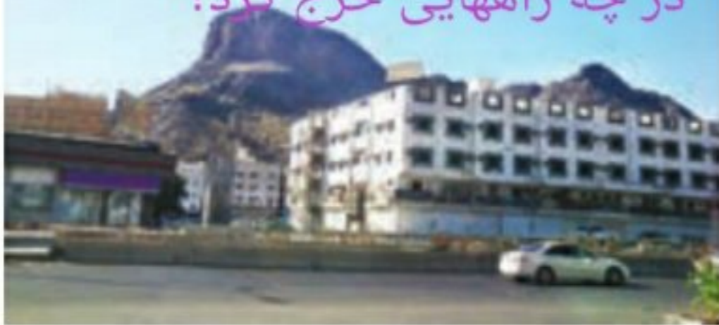
○ امروزه با توسعه شهر مکه، غار حرا در حومه شهر قرار گرفته است.