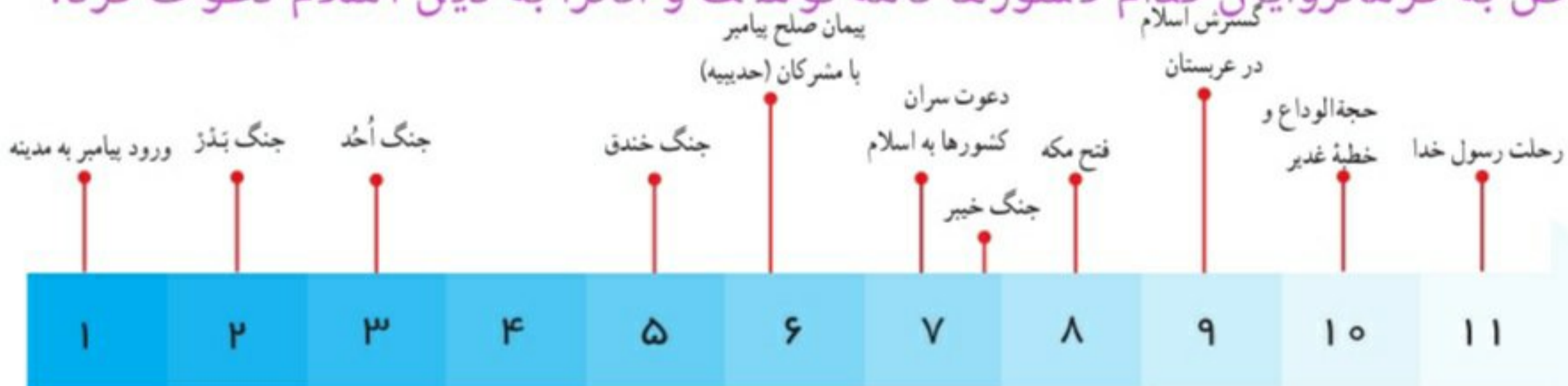
مهم ترین رویدادهای تاریخ اسلام از هجرت پیامبر تا رحلت آن حضرت (بر اساس سال های هجرت)

۲۸- پیامبر ص به فرمانروایان کدام کشورها نامه نوشت و آنانرا به دین اسلام دعوت کرد؟